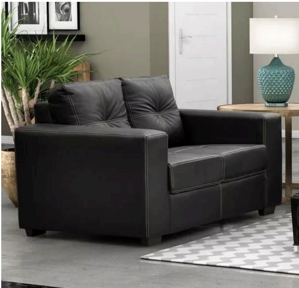
ITEM 23 - SOFÁ 3 LUGARES