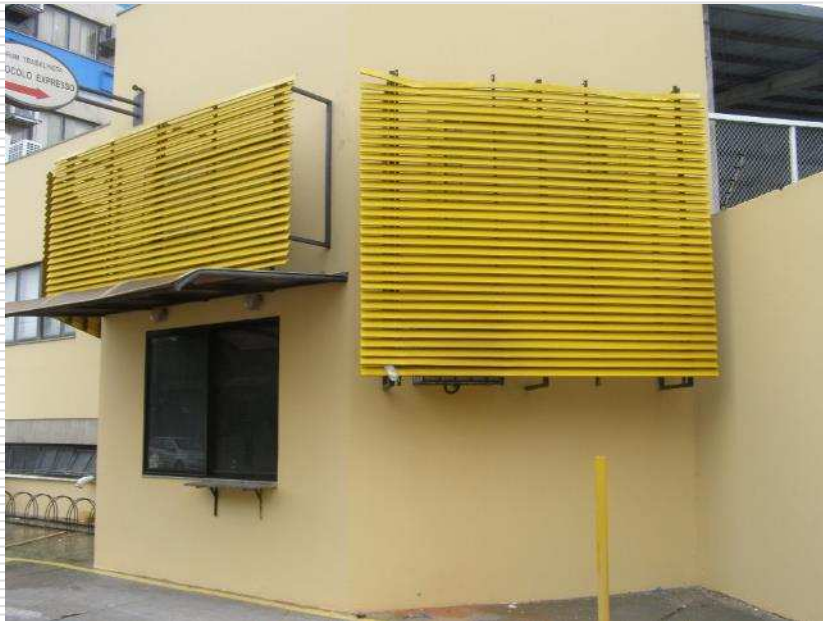
Detalhes das pinturas da parede exterior e do brise de alumínio