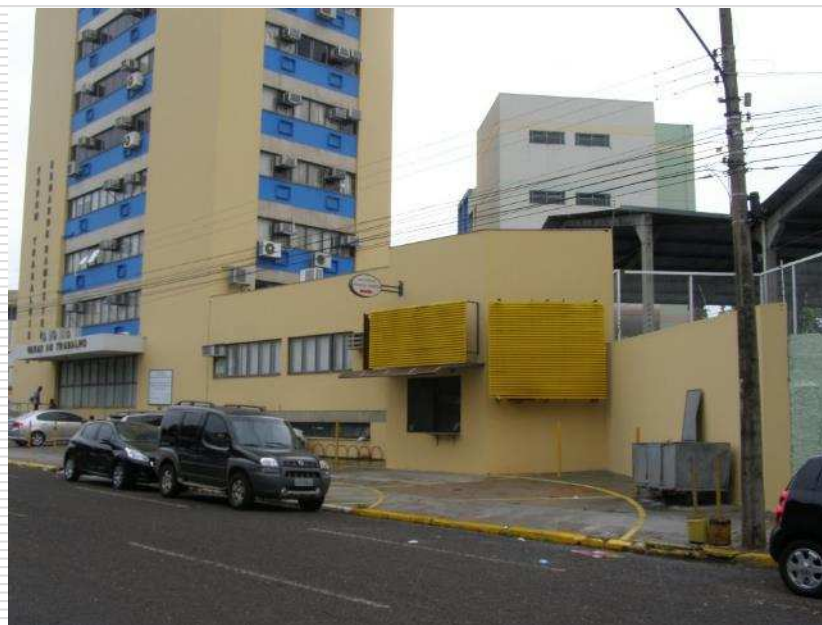
Vista geral da pintura executada do lado exterior