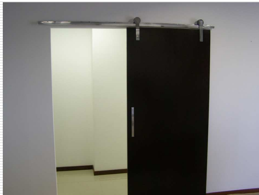
Porta de correr instalada