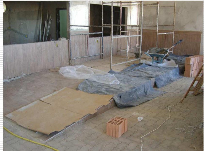
Detalhe da laje de piso