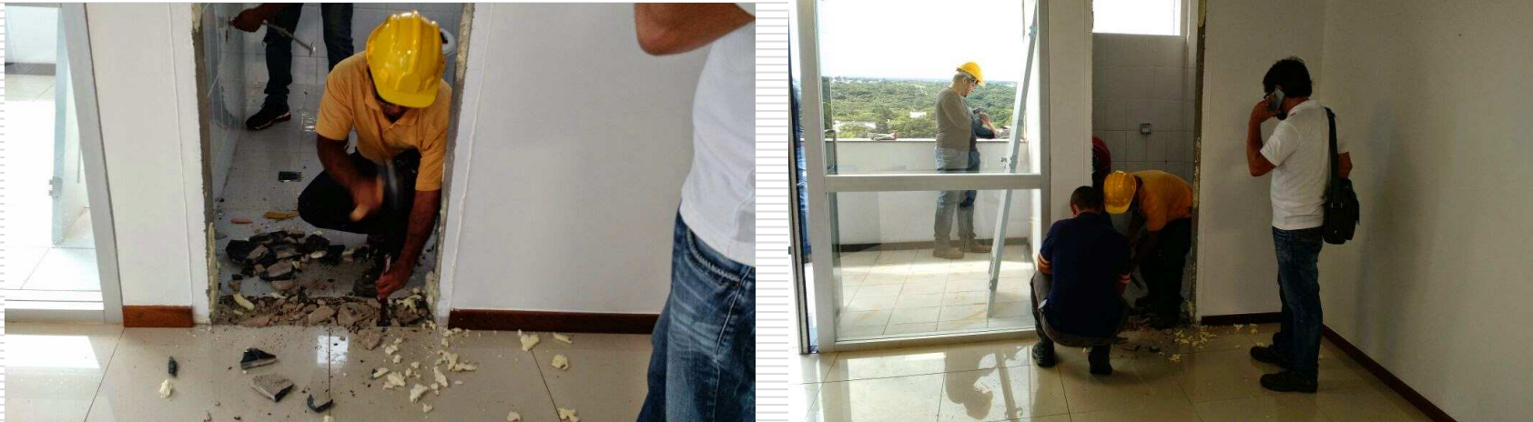
Execução da desmontagem do banheiro existente na presidência