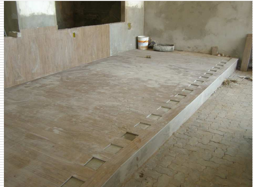
Detalhe do piso executado na parte externa