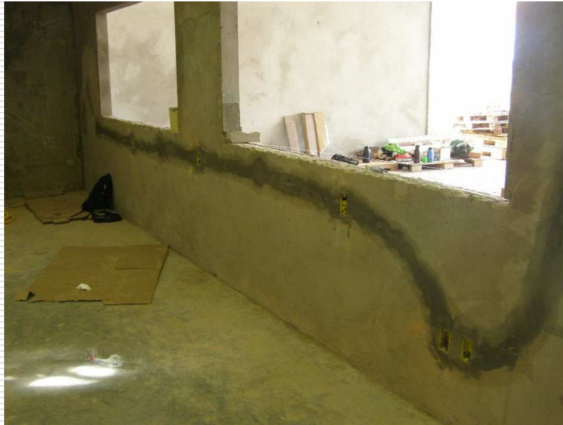
Detalhe das caixas de ponto de tomadas