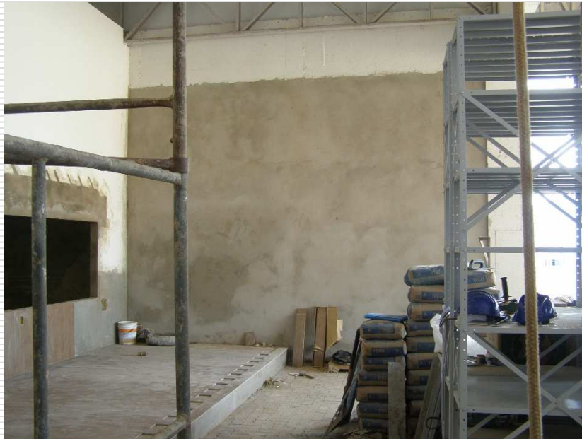
Fechamento de alvenaria executada