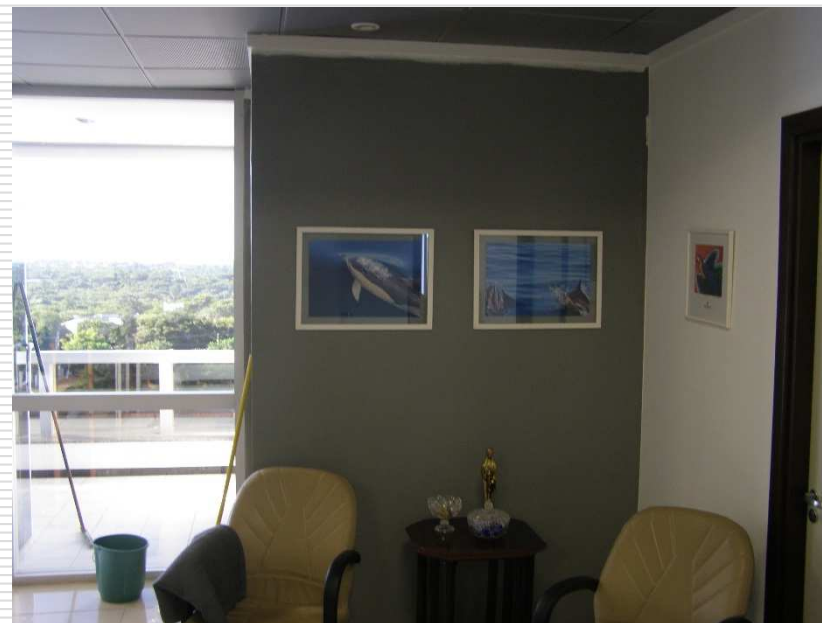
Detalhe do banheiro reformado