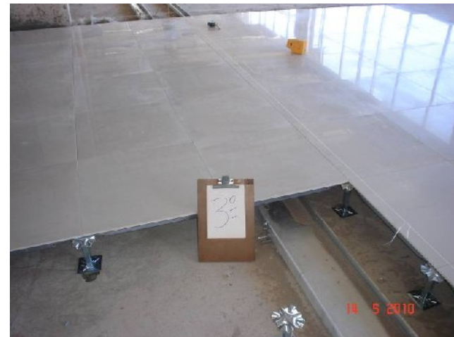
Detalhe da colocação de porcelanato sobre piso elevado no 3º pavimento