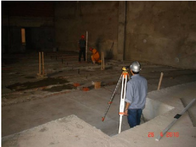
Nivelamento para regularização de contrapiso no plenário grande.