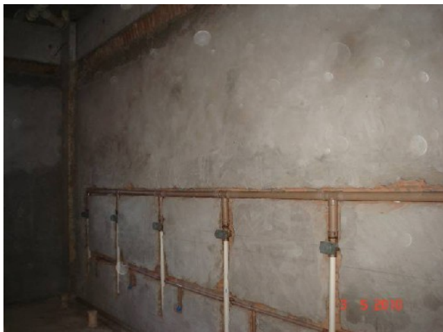
Detalhe da tubulação de água fria para abastecimento de válvulas de descarga em banheiro coletivo do térreo.