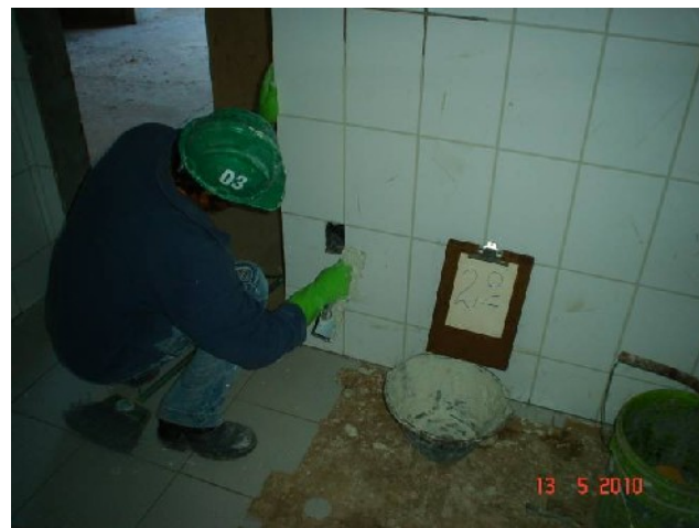
Detalhe de rejuntamento de azulejo em banheiro coletivo do 2º pavimento.