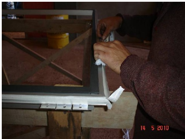
Detalhe da preparação da estrutura de alumínio para colocação de vidro refletivo laminado.