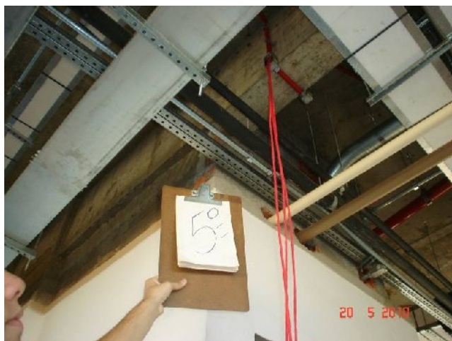
Detalhe do cabeamento para detecção de alarme no 5º pavimento