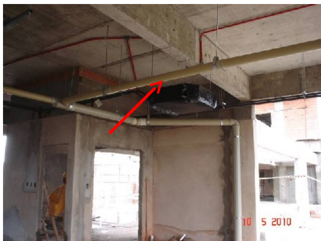
Detalhe da tubulação de águas pluviais no 1º pavimento