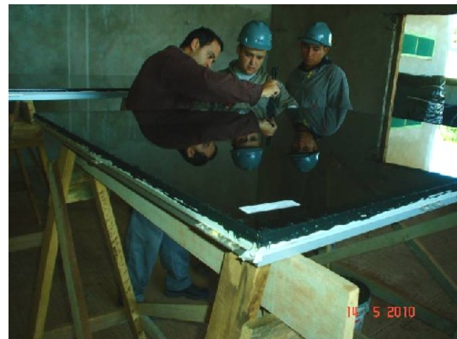
Detalhe da colagem do vidro refletivo sobre a estrutura de alumínio, com utilização de silicone estrutural.