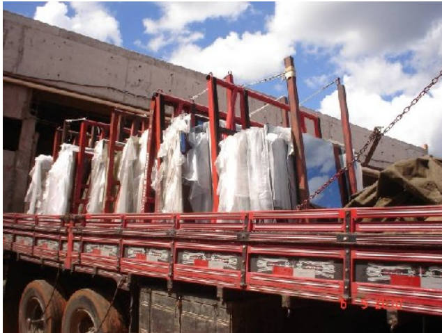
Descarga de vidro refletivo laminado azul.