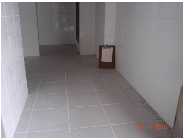
Detalhe da execução de piso cerâmico em banheiro coletivo do 4º pavimento.