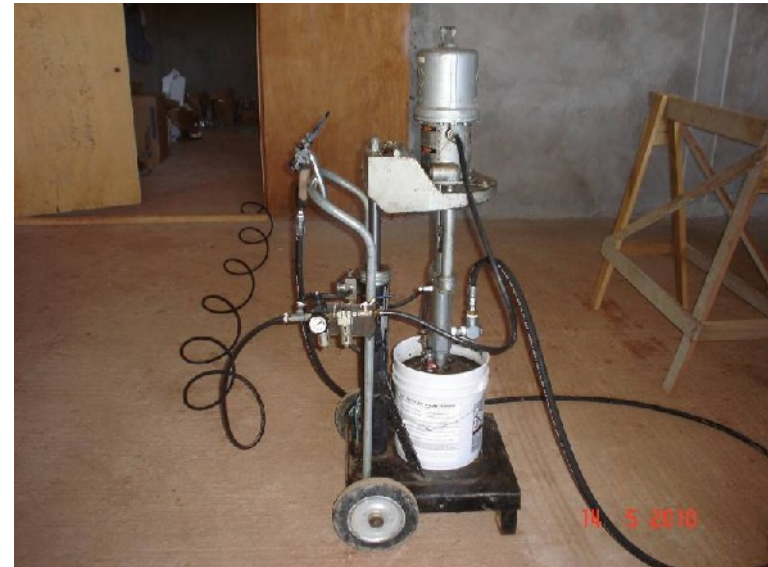
Maquina pneumática para aplicação de silicone na colagem de vidros.