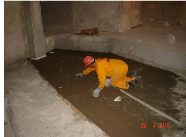
Detalhe da execução da regularização de contra-piso no plenário grande.