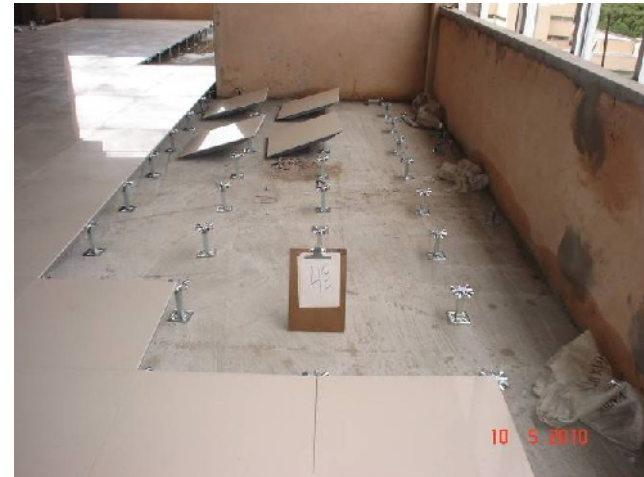
Detalhe da colocação de porcelanato sobre piso elevado no 4º pavimento