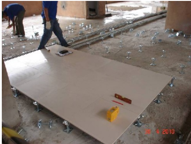
Detalhe da colocação de porcelanato sobre piso elevado no 5º pavimento