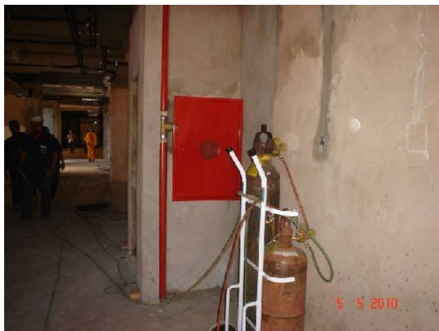
Detalhe da instalação de hidrante no 5º pavimento.