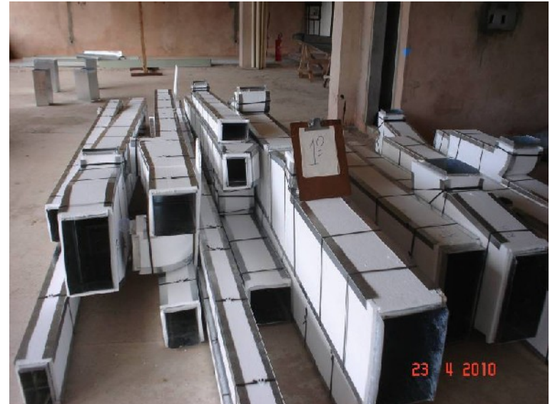
Tubulação de exaustão e insuflamento para ar condicionado.