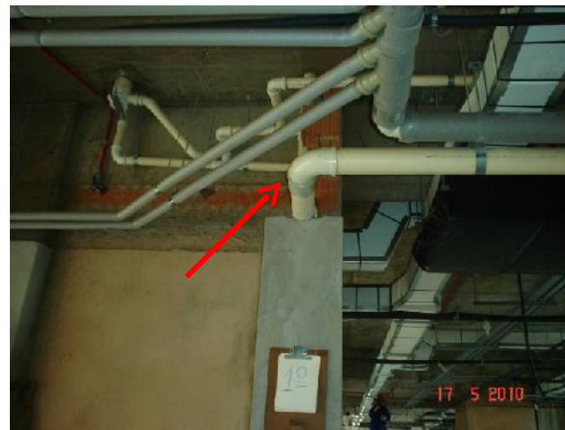
Detalhe da tubulação de ramal de esgoto e de descarga no 1º pavimento.