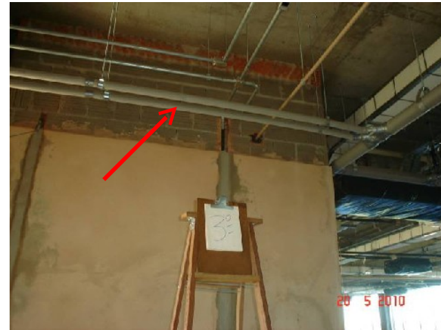
Detalhe da tubulação de dreno das unidades evaporadoras no 3º pavimento.