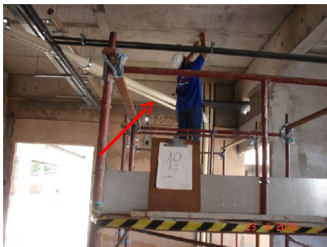
Detalhe do ramal de esgoto no 1º pavimento.