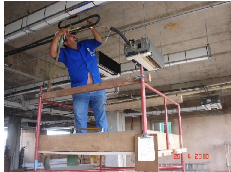
Execução da solda da tubulação frigorígena junto às unidades evaporadoras.