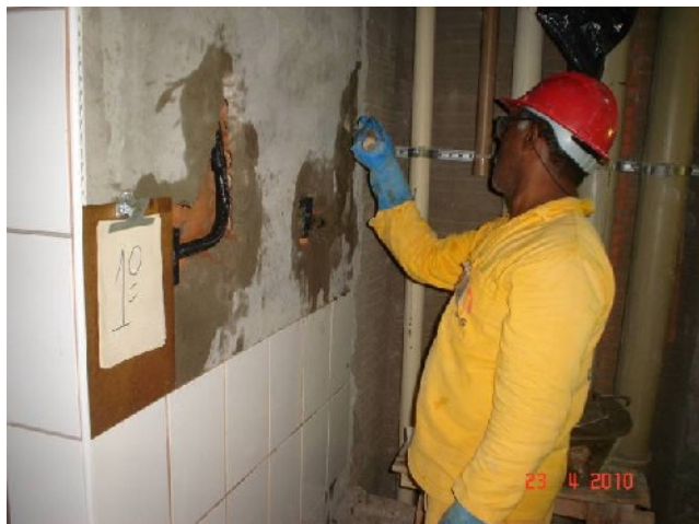
Detalhe do azulejo colocado em banheiro coletivo no 1º pavimento.