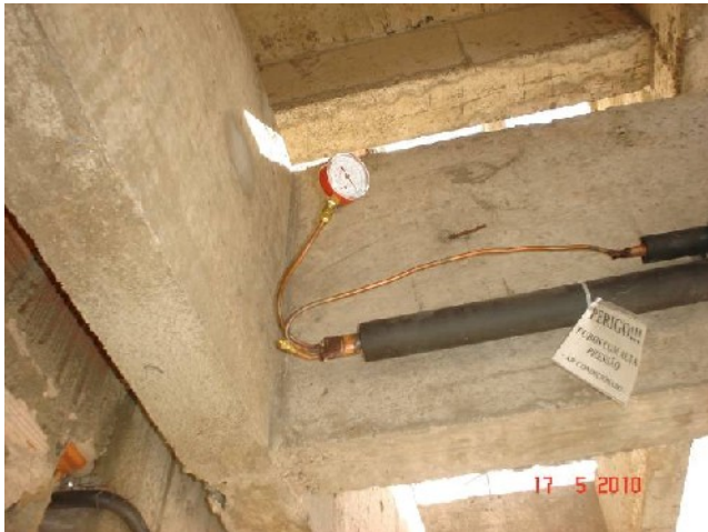
Detalhe do manômetro para verificação da pressão do gás refrigerante R410-A da tubulação frigorígena.