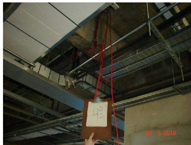
Detalhe do cabeamento para detecção de alarme no 4º pavimento