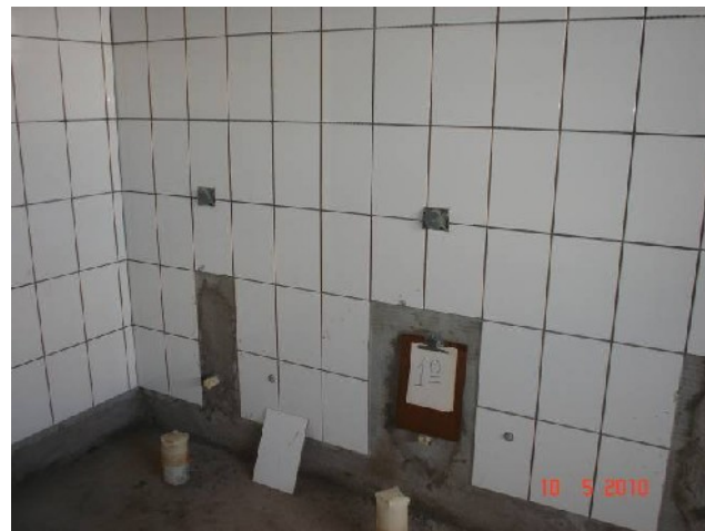
Detalhe do azulejo colocado em banheiro coletivo no 1º pavimento.