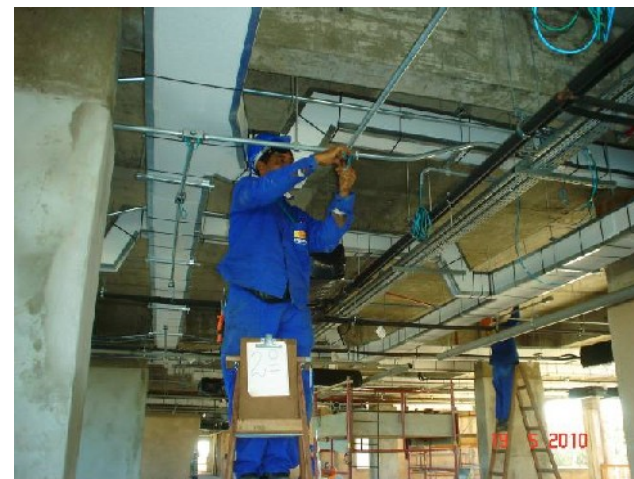
Detalhe da colocação de fiação no 2º pavimento.