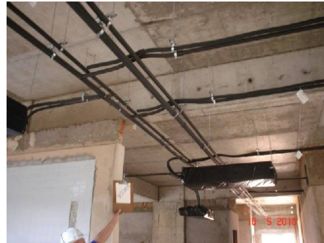
Detalhe de tubulação frigorígena e unidades evaporadoras no pavimento térreo.