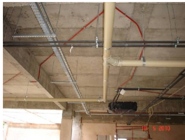
Detalhe da tubulação (vermelha) para detecção de alarme no 2º pavimento.