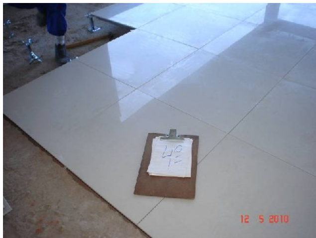
Porcelanato colocado sobre piso elevado no 4º pavimento