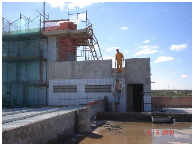
Detalhe do revestimento externo, em pastilha cerâmica, na casa de máquinas do elevador.