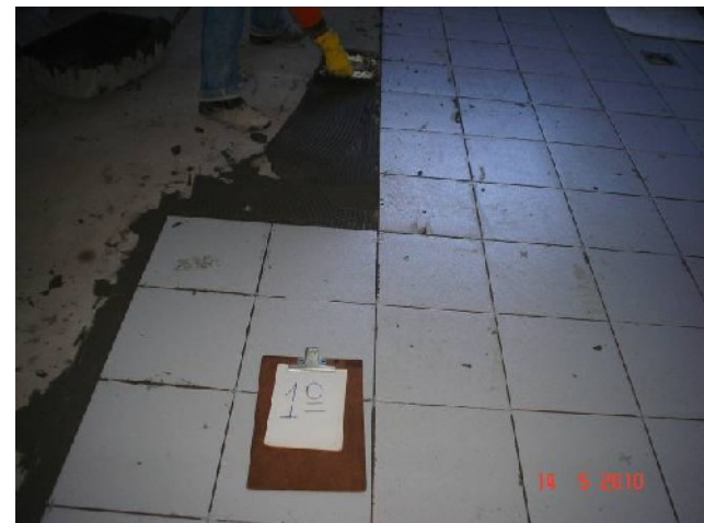
Detalhe da execução de piso cerâmico em banheiro coletivo do 1º pavimento.