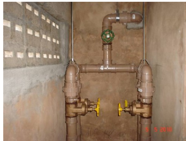
Detalhe da tubulação de água fria na saída do barrilete.