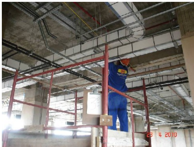
Detalhe da colocação de eletrocalha para instalações elétricas no 3º pavimento.