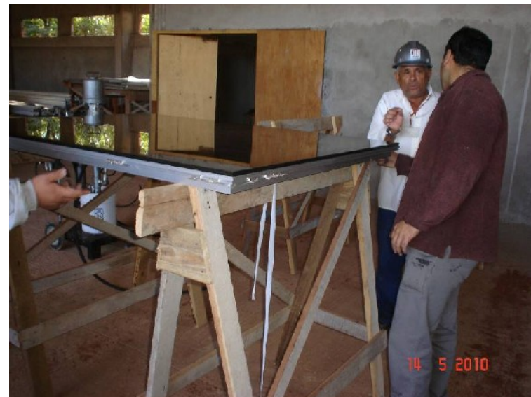
Detalhe da colagem de vidro nos quadros para a fachada.