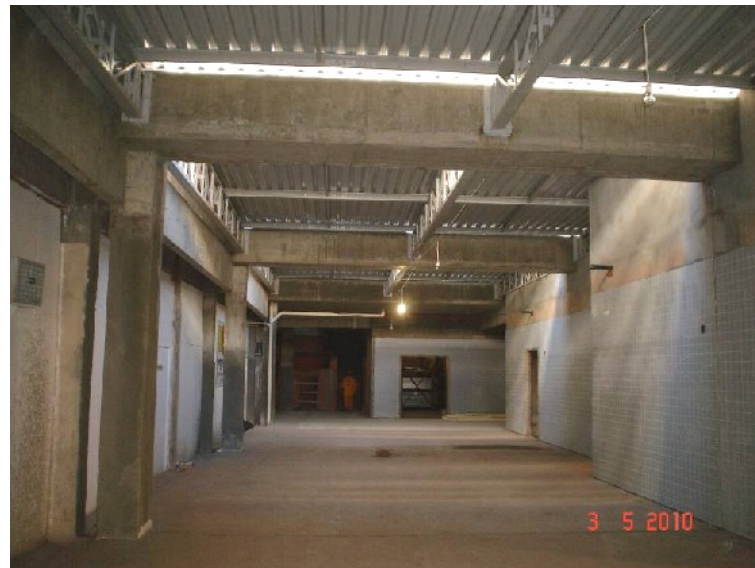
Detalhe do saguão de entrada principal.