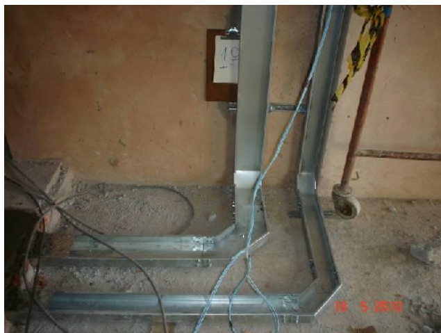
Detalhe da colocação de eletrocalha sob o piso elevado do 1º pavimento.