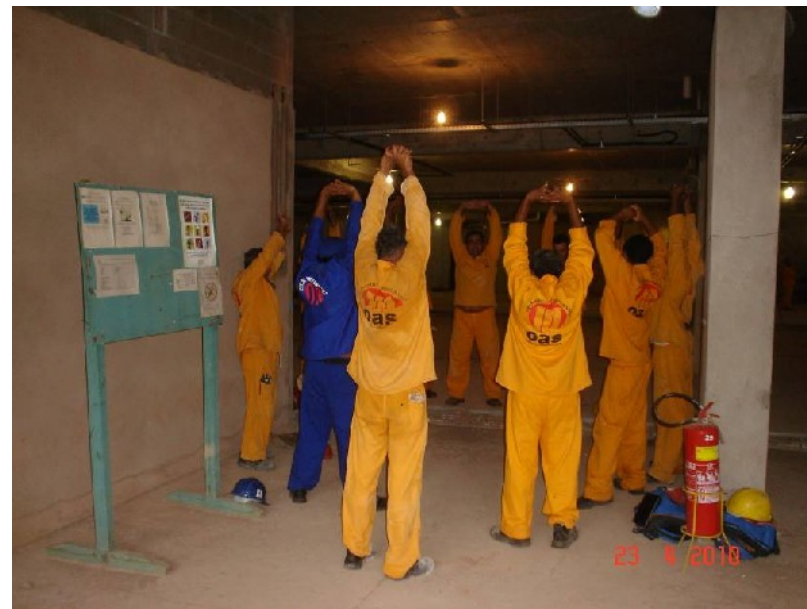
Equipe de colaboradores em ginástica laboral