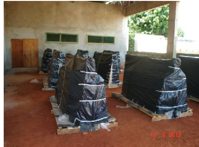
Detalhe do armazenamento dos vidros refletivos.