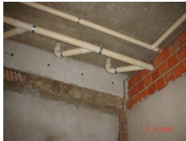
Detalhe de ramal de descarga e de esgoto em banheiros coletivos do térreo.