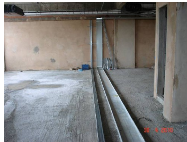
Detalhe da colocação de eletrocalha sob o piso elevado do 3º pavimento.