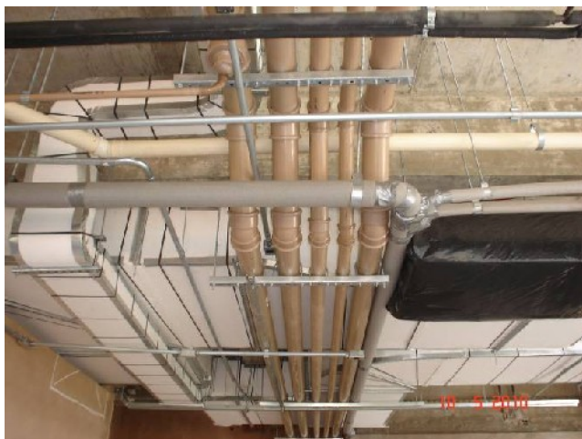
Vista geral da tubulação de água fria (marrom) para as respectivas colunas de abastecimento no 5º pavimento