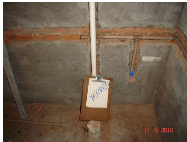
Detalhe da tubulação de água fria em banheiro individual no térreo.