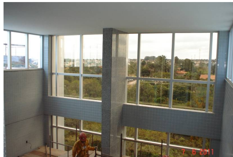
Vista do pátio interno do hall dos elevadores panorâmicos.