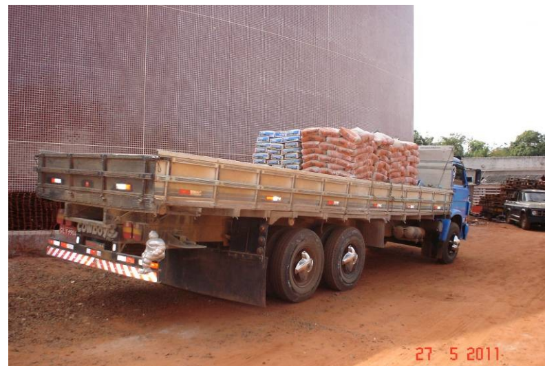
Detalhe de material a ser utilizado na obra – cimento e argamassa.