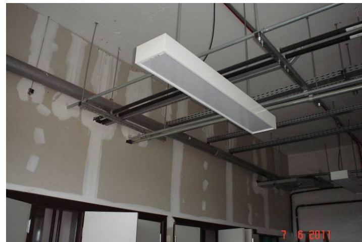
Detalhe das instalações de luminárias nas salas de utilidades.