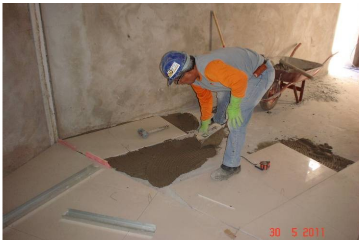
Porcelanato (50x50cm) sobre contrapiso, no corredor que interliga o 1º pavimento da parte A com a parte B.