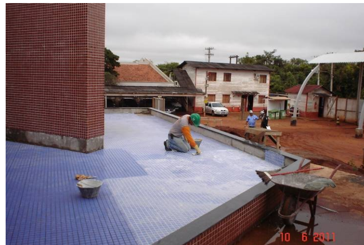
Pastilha cerâmica no piso do espelho d'água da entrada principal do prédio.