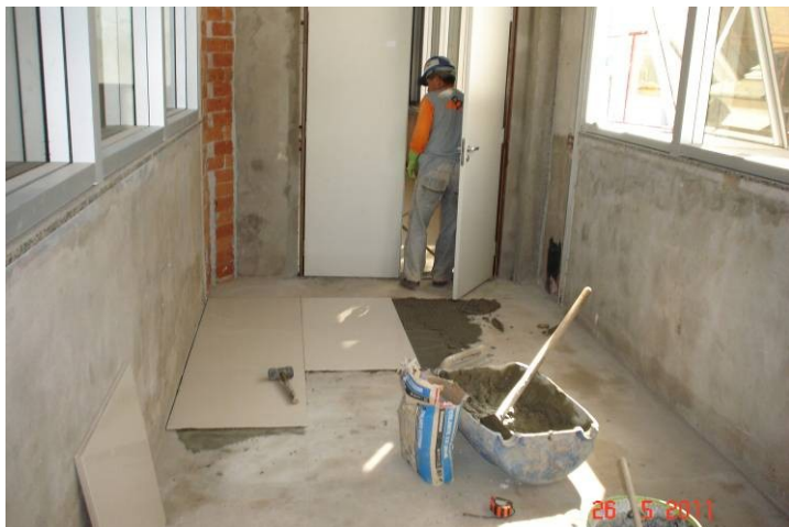
Porcelanato (50x50cm) sobre contrapiso, no corredor que interliga o 1º pavimento da parte A com a parte B.