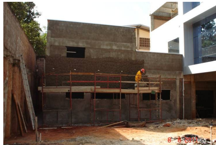
Chapisco e emboço externo em paredes da área destinada à marcenaria.