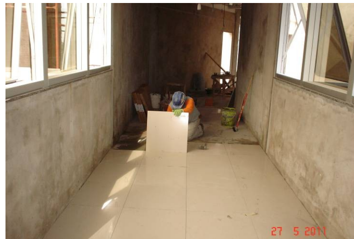
Porcelanato (50x50cm) sobre contrapiso, no corredor que interliga o 1º pavimento da parte A com a parte B.