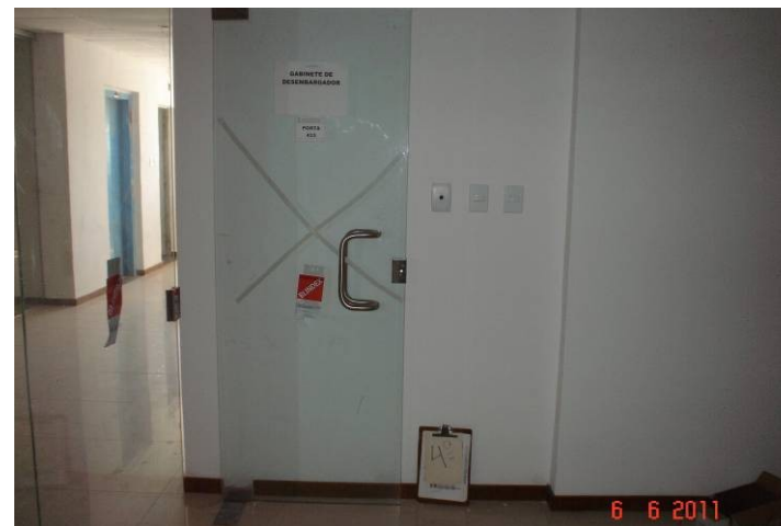
Instalação de esquadria em vidro (10mm) com ferragens e perfis.