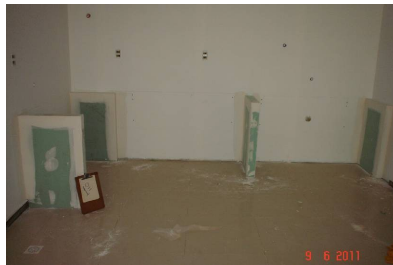
Divisória em “dry wall”, no 1º pavimento, mostrando os apoios para bancadas em granito.