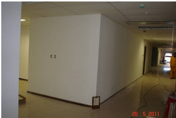
Divisória em “dry wall” no 1º pavimento.