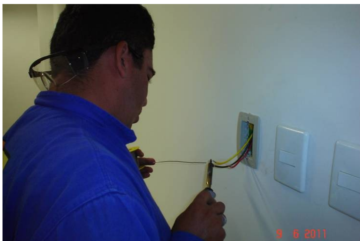
Detalhe da ligação da fiação do botão de volume de som ambiente.