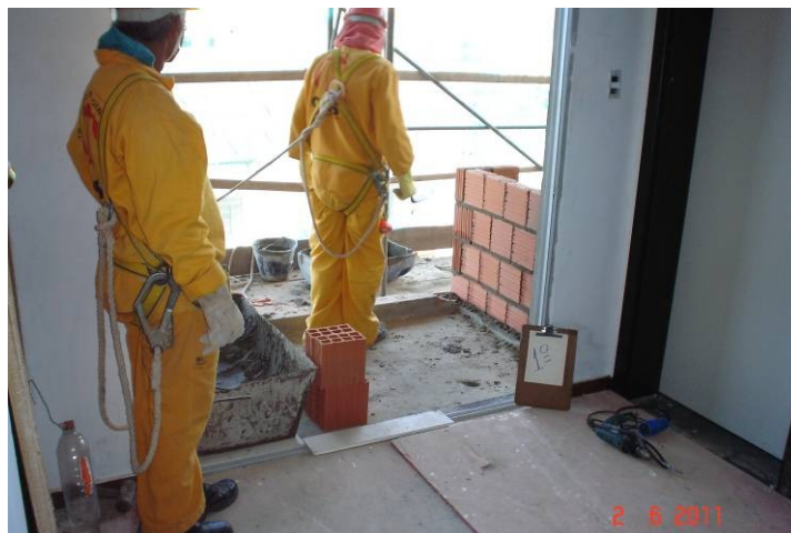
Alvenaria em bloco cerâmico no fechamento do shaft externo no 1º pavimento.