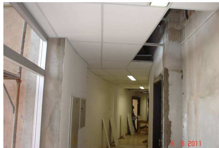
Forro modular removível instalado no corredor do 1º pavimento, que interliga a parte A com a parte B.