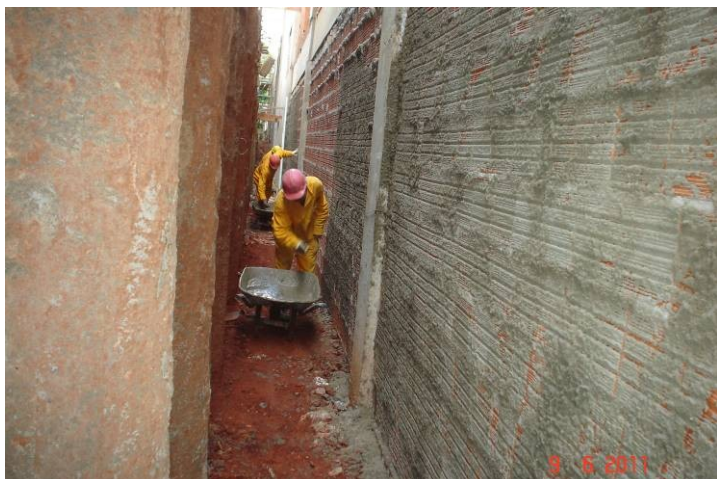
Chapisco externo em parede junto à contenção de estacas – fachada leste.