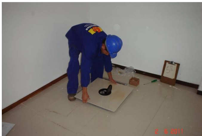
Detalhe da instalação da tomada de piso.