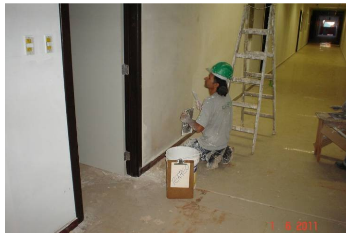
Aplicação de massa acrílica sobre parede de gesso acartonado no pavimento térreo.