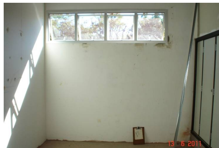
Vidro plano azul (4mm) instalado em janela de alumínio anodizado na sala de utilidades do 1º pavimento.