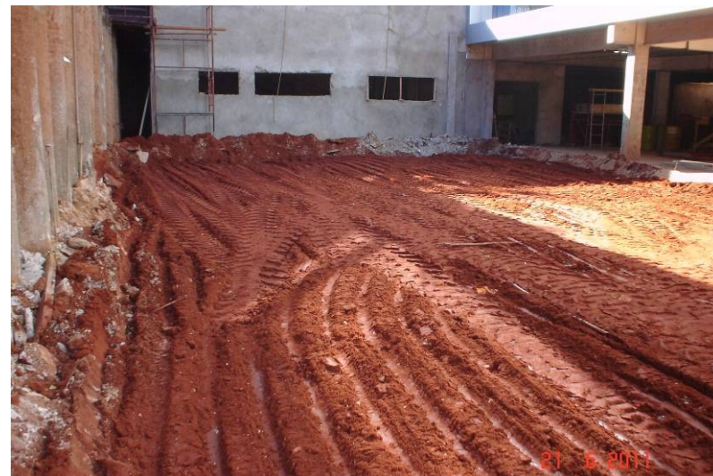
Corte e aterro, com execução mecanizada, na parte externa do subsolo.