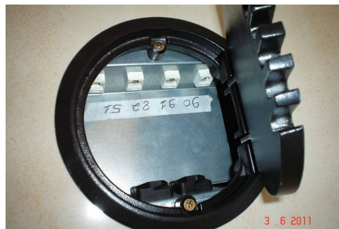
Detalhe da caixa de piso elevado com tomadas elétricas e conectores tipo RJ45.