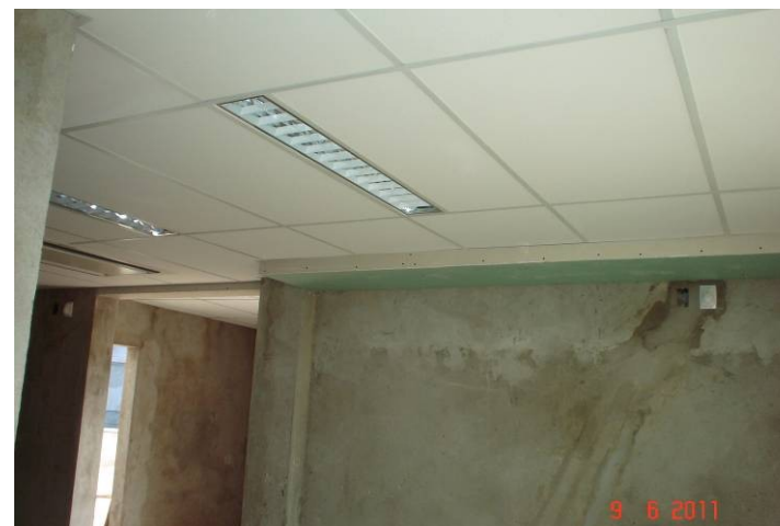
Forro modular removível instalado no 1º pavimento.