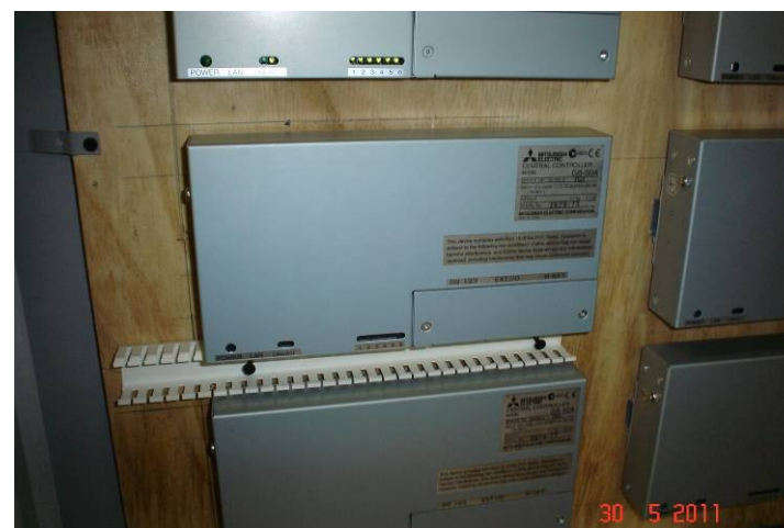
Instalação das centrais de controle tipo GB da central de ar condicionado.