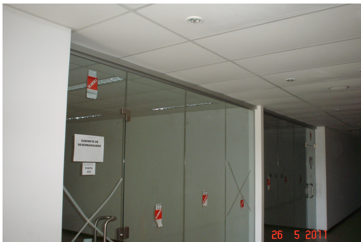
Instalação de esquadria em vidro (10mm) com ferragens e perfis.