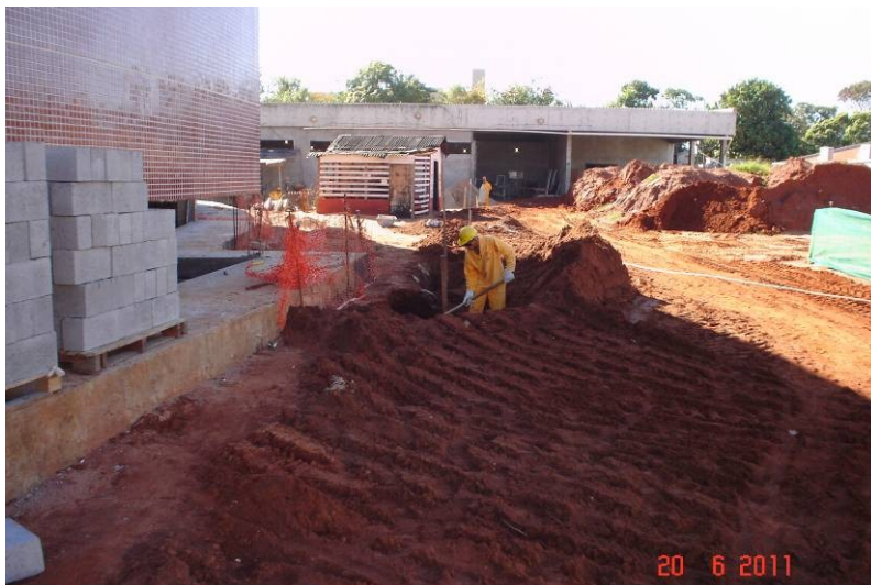
Movimentação mecanizada de terra e aterro compactado com o próprio material.