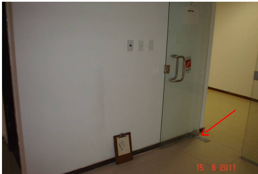
Detalhe da mola hidráulica instalada em porta de vidro no 1º pavimento.