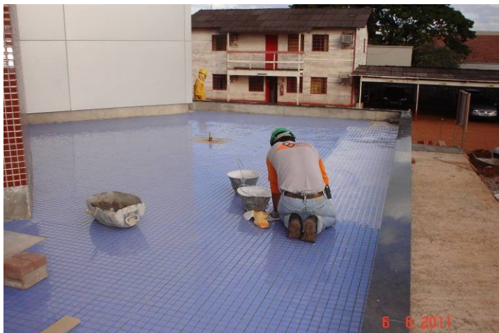
Pastilha cerâmica no piso do espelho d'água da entrada principal do prédio.