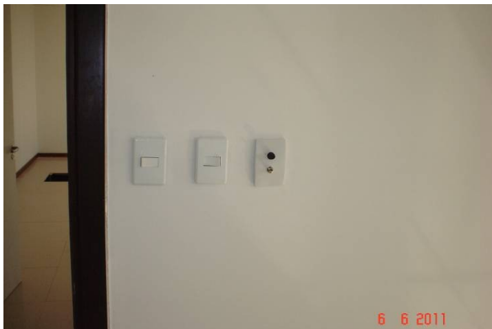
Detalhe da instalação de interruptores e botão de volume de som ambiente.