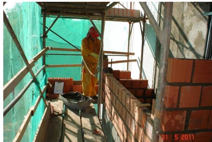
Alvenaria em bloco cerâmico no fechamento do shaft externo no 2º pavimento.