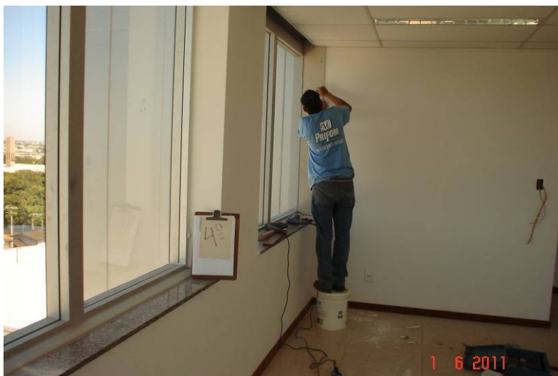
Acabamento em parede “dry wall” no 4º pavimento.