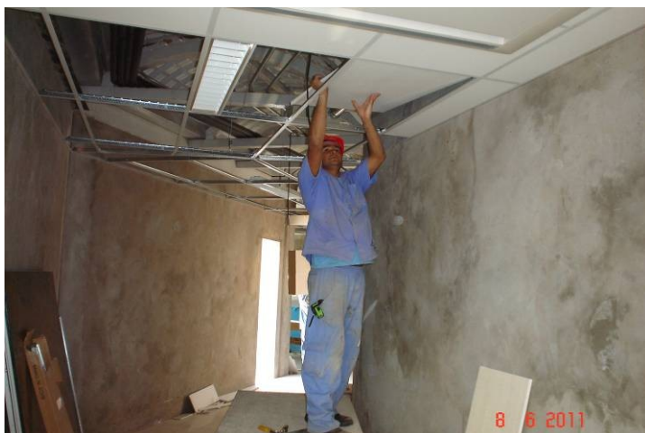
Forro modular removível instalado no 1º pavimento, no corredor que interliga a parte A com a parte B.