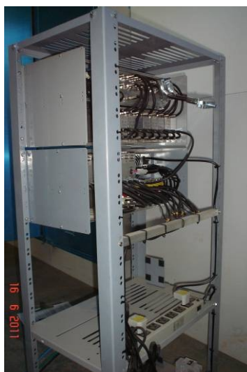
Detalhe do rack do sistema de antena coletiva para TV com conectores e equipamentos.