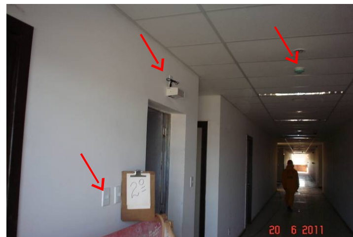
Detalhe de luminárias, blocos autônomos, interruptores e detectores de fumaça instalados no 2º pavimento.