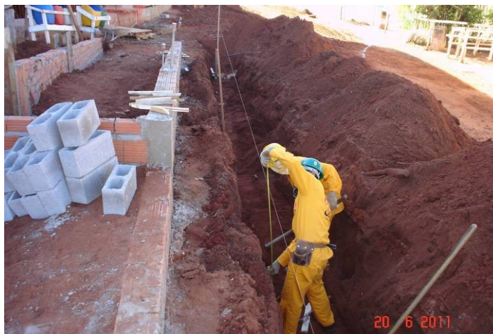
Vala escavada para rede externa de esgoto.