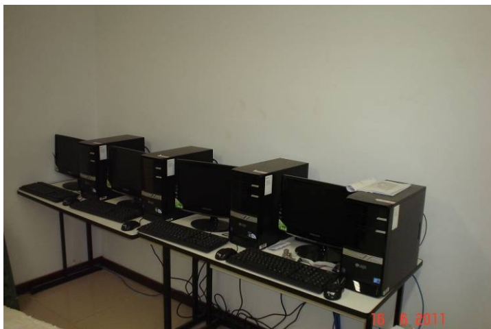
Detalhe dos microcomputadores de controle de som e de CFTV.