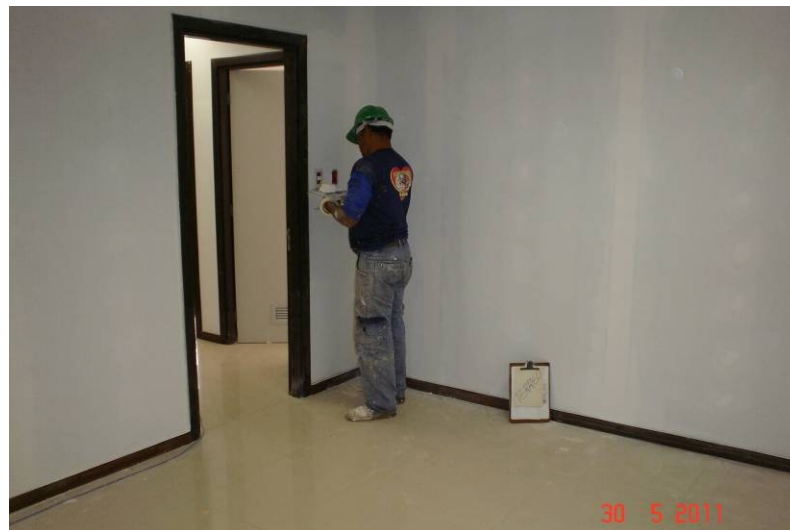
Detalhe da execução de pintura no pavimento térreo.