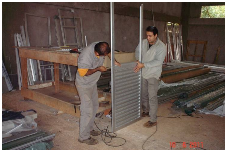
Montagem de porta em alumínio anodizado.