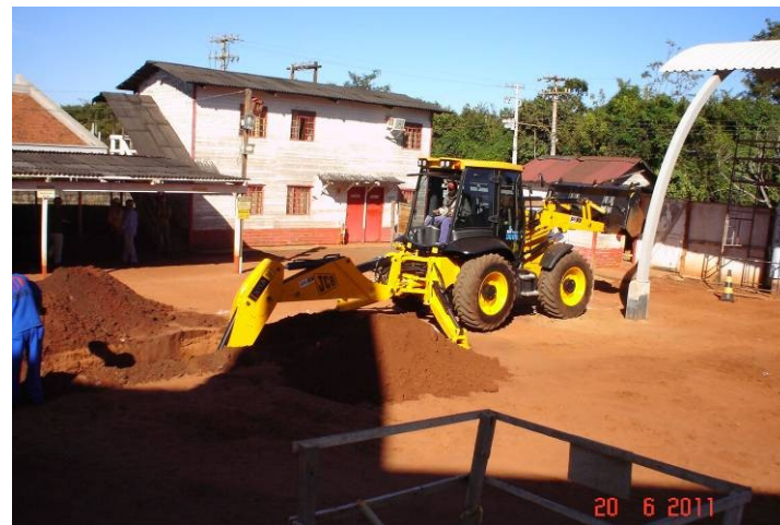
Escavação mecanizada de vala para rede externa de águas pluviais.