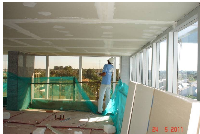
Forro em gesso acartonado no teto do 5º pavimento - hall dos elevadores panorâmicos.