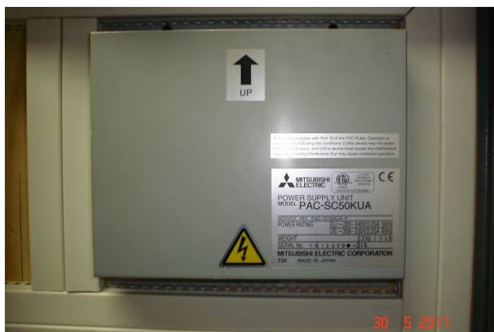
Detalhe do quadro das fontes de alimentação ("PAC") do sistema de ar condicionado.