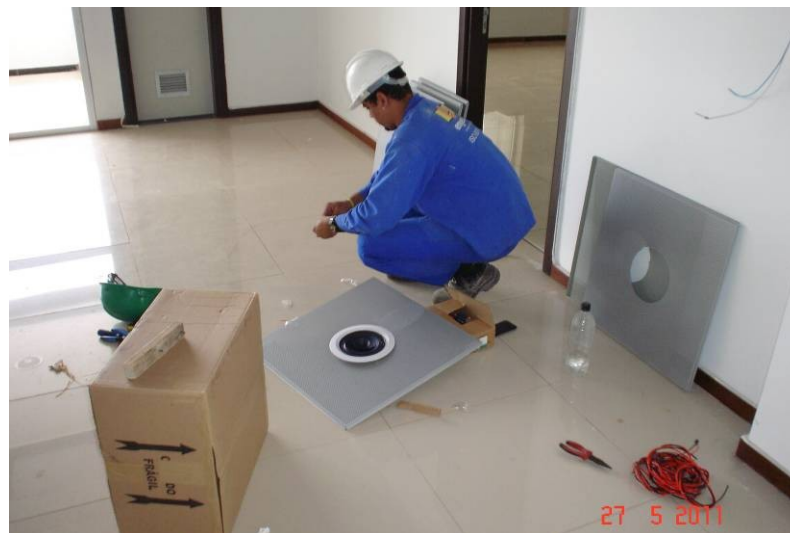
Detalhe da instalação de sonofletores em forro de alumínio perfurado no 5º pavimento.