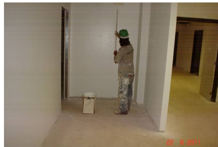
Aplicação de pintura sobre massa acrílica em parede do térreo.