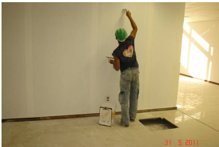
Aplicação de massa acrílica sobre parede de gesso acartonado no pavimento térreo.