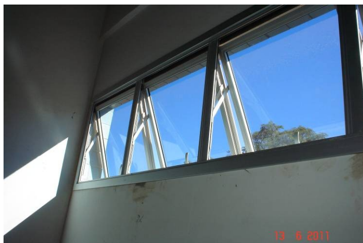
Vidro plano azul (4mm) instalado em janela de alumínio anodizado na sala de utilidades.