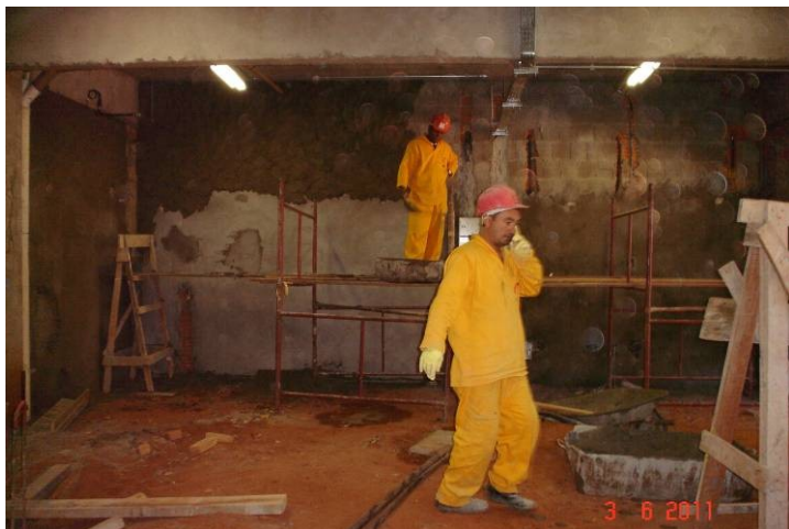
Revestimento em massa única em paredes da área destinada à marcenaria.