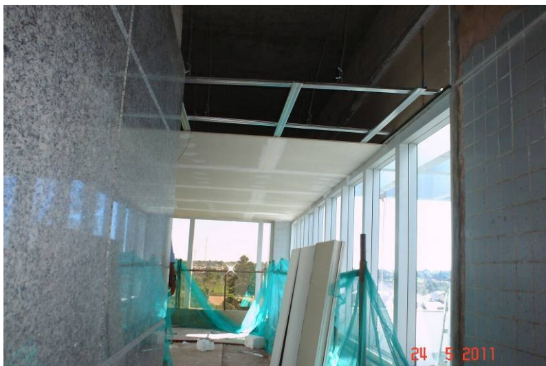
Forro em gesso acartonado no teto do 5º pavimento - hall dos elevadores panorâmicos.