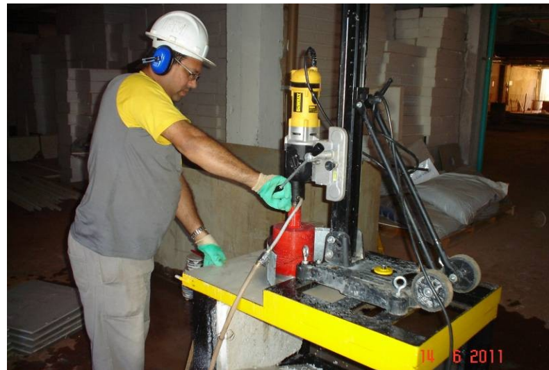
Máquina de perfurar piso metálico elevado e porcelanato.