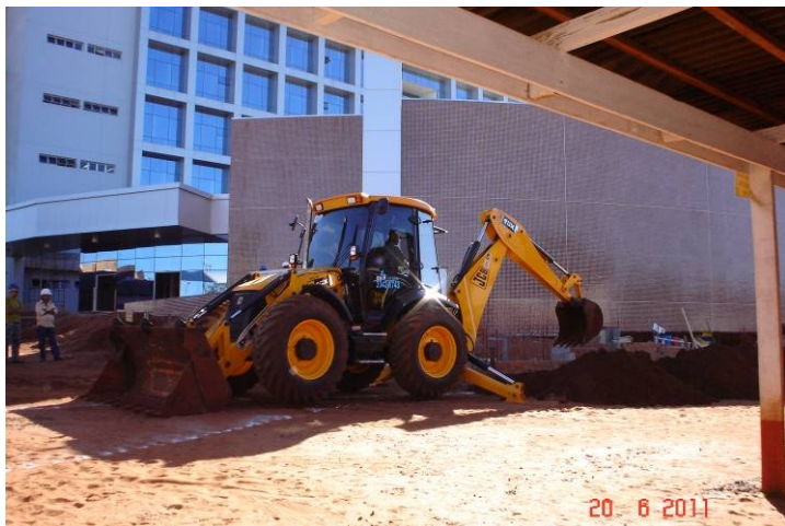
Escavação mecanizada de vala para rede externa de esgoto.