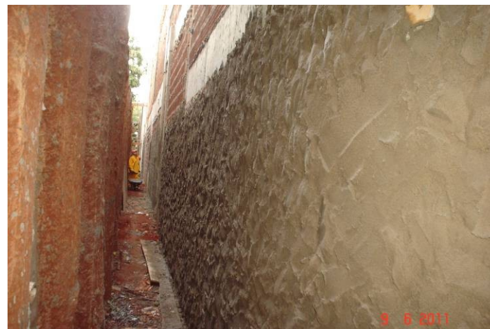
Emboço externo em parede junto à contenção de estacas – fachada leste.