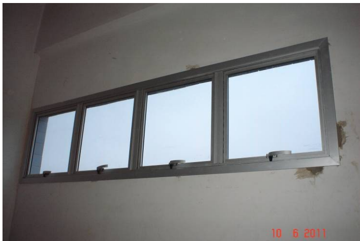
Janela em alumínio anodizado, instalada na sala técnica do 5º pavimento.