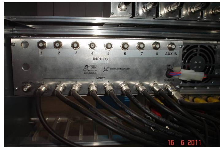
Detalhe da interligação do sistema de som nos racks.