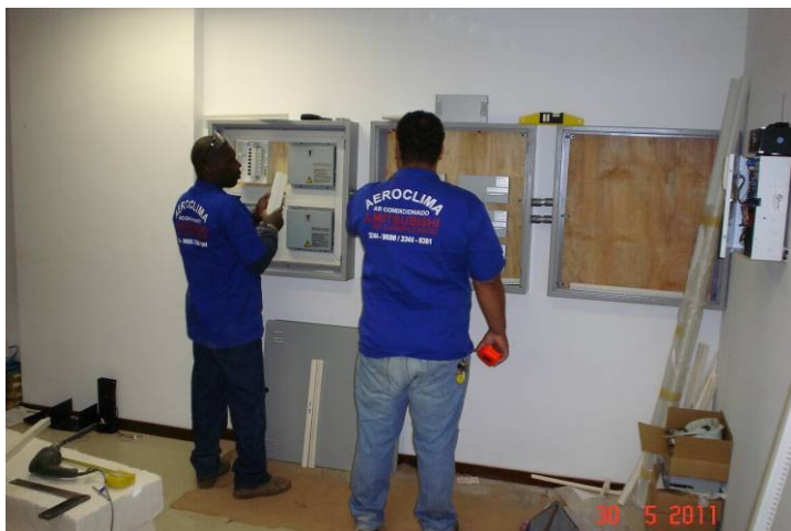
Instalação dos quadros das fontes de alimentação ("PAC") do sistema de ar condicionado.