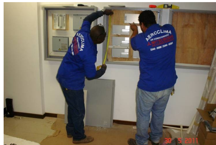
Instalação dos quadros das fontes de alimentação ("PAC") do sistema de ar condicionado.