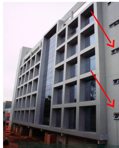
Janelas em alumínio anodizado instaladas na sala técnica -fachada norte.