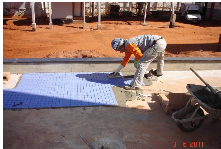
Pastilha cerâmica no piso do espelho d'água - entrada principal do prédio.