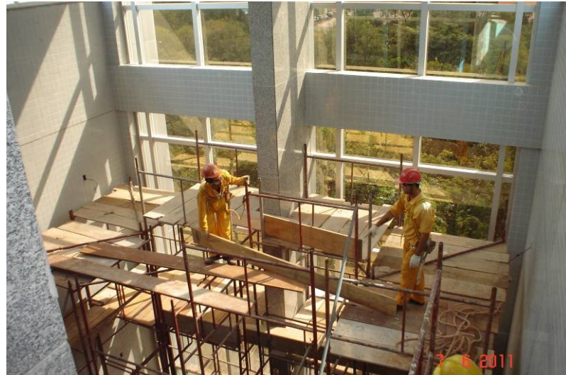
Detalhe da equipe de trabalho na desmontagem de andaime no hall dos elevadores panorâmicos.