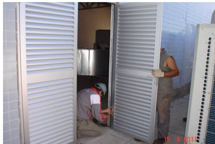
Instalação de porta de alumínio anodizado na casa de máquinas do sistema de ar condicionado na cobertura.