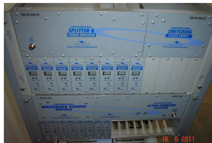
Detalhe do sistema de antena coletiva para TV.