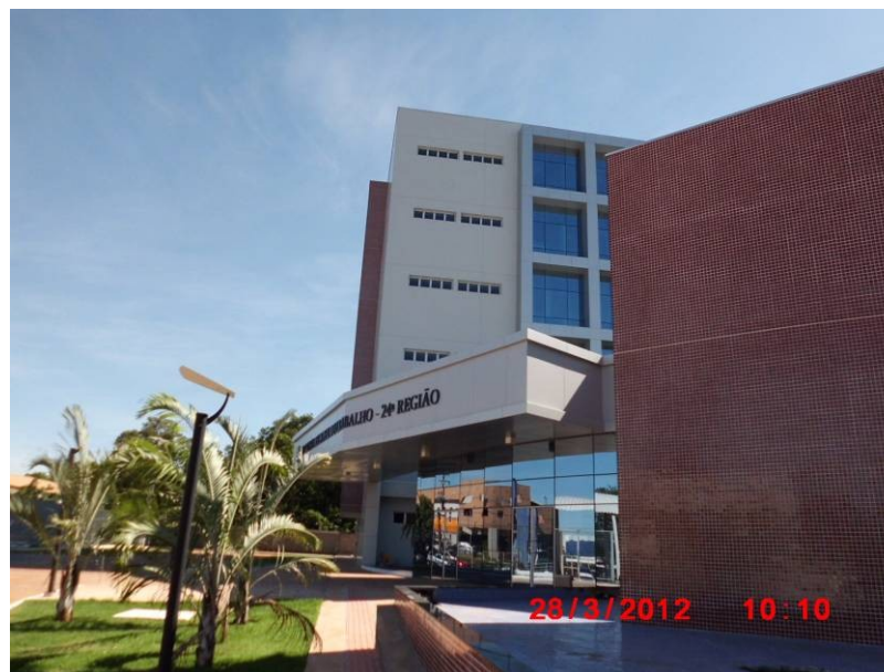
Vista geral da fachada oeste.