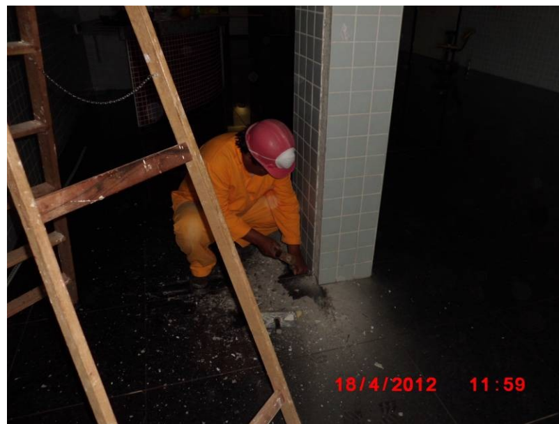
Retrabalho de retirada de pastilha cerâmica.