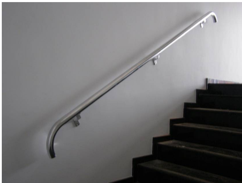
Corrimão em aço inox em escada do térreo, na escada de acesso ao plenário.