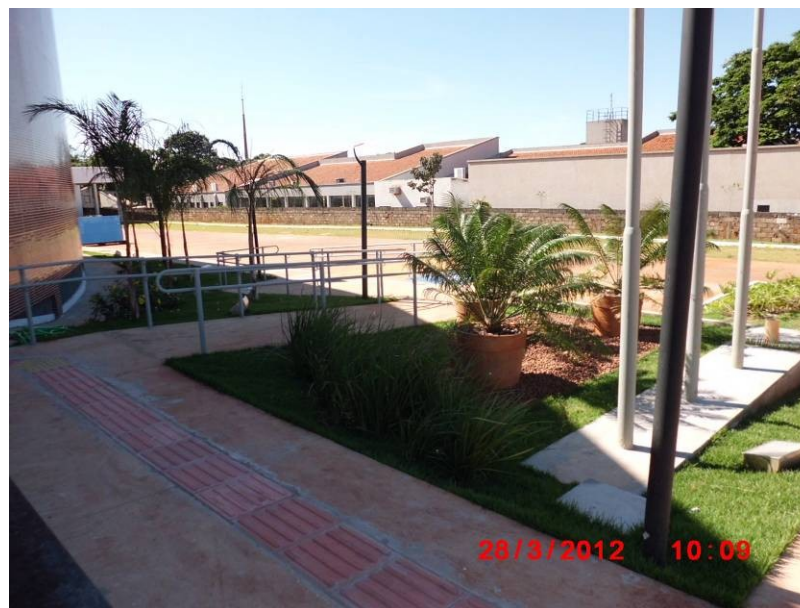
Vista da jardinagem externa próximo a saída do plenário.