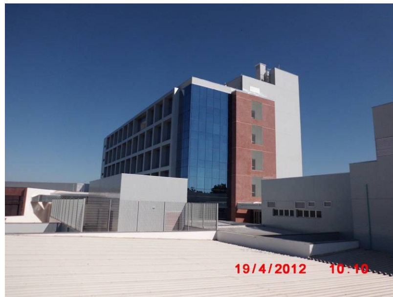
Vista de parte da Fachada Leste.