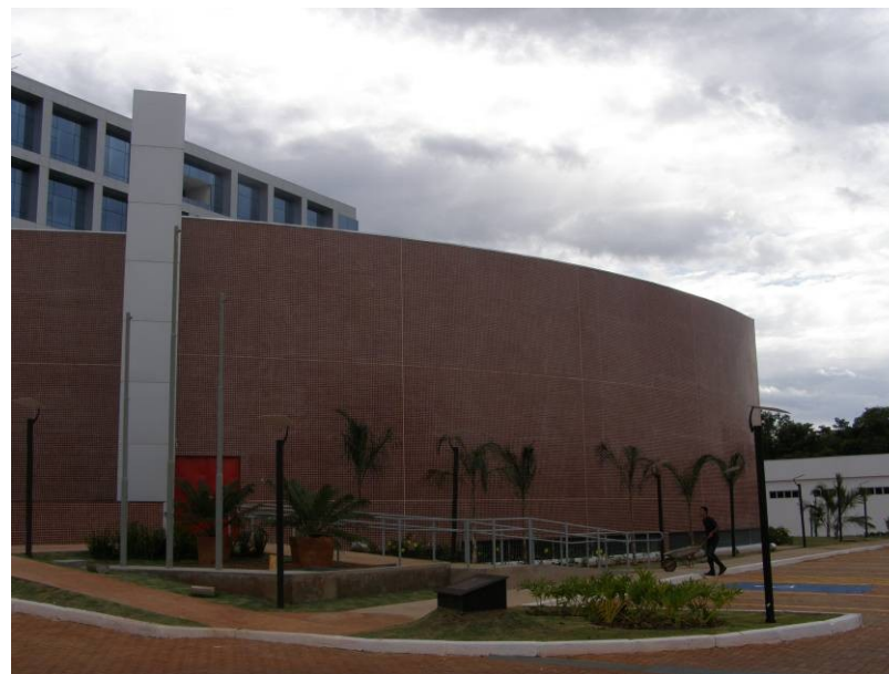
Vista geral externa da Fachada Sul.