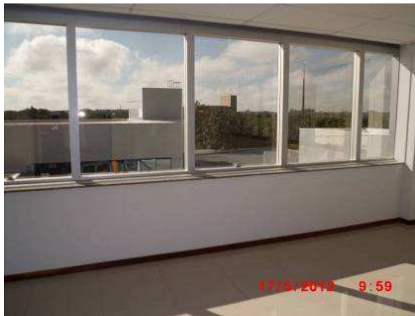
Vista parcial de ambiente interno do 2º pavimento.