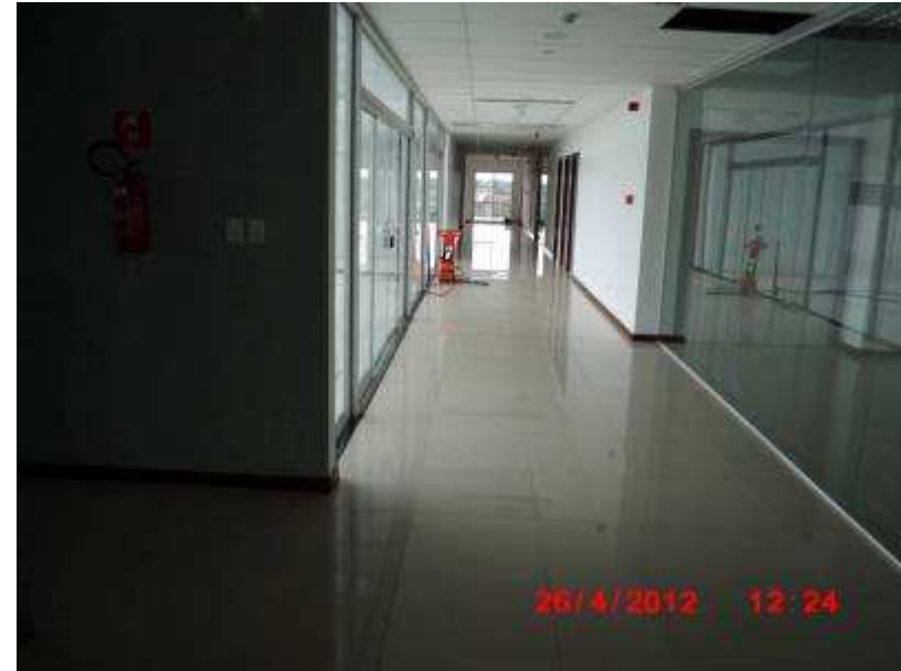
Limpeza de ambiente interno do 5º pavimento.