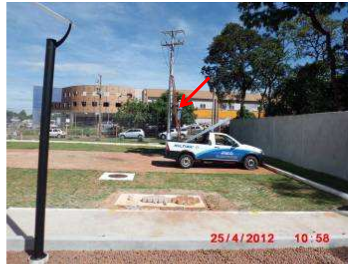
Passagem do cabo óptico de interligação entre os prédios.