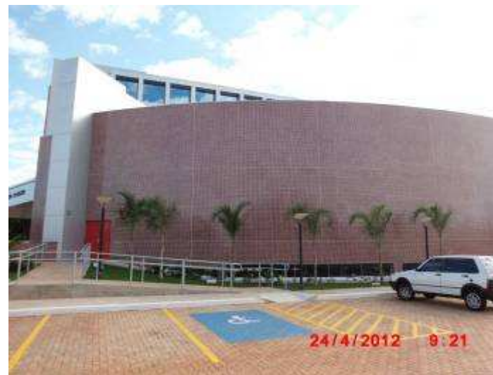
Vista parcial do estacionamento de veículos da fachada sul.