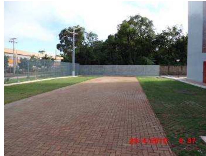
Vista parcial do estacionamento interno frontal (fachada leste)