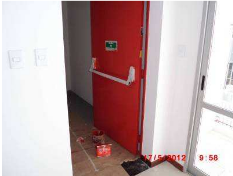
Serviços de pintura em esquadria da porta corta-fogo.