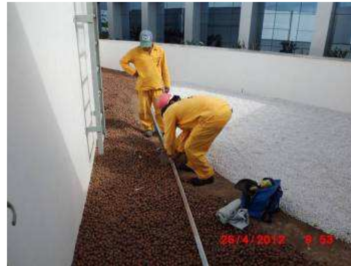
Colocação de separador da argila expandida e pedras de quartzo no jardim seco (1º pavimento).