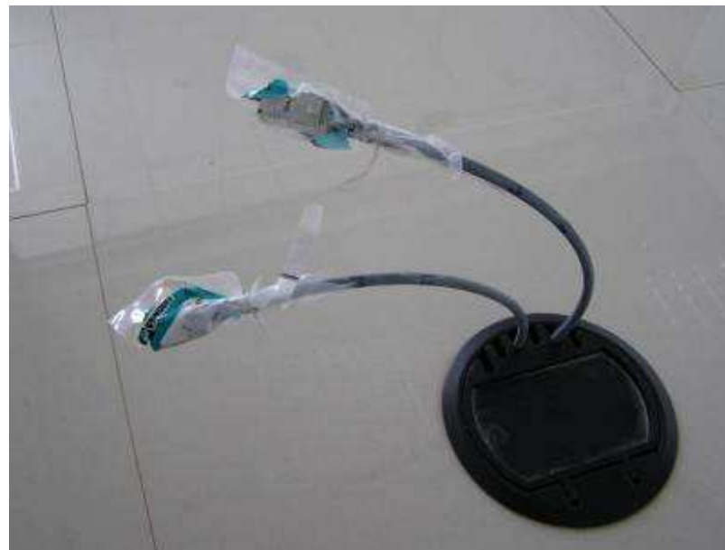
Detalhe de conectores blindados instalados.