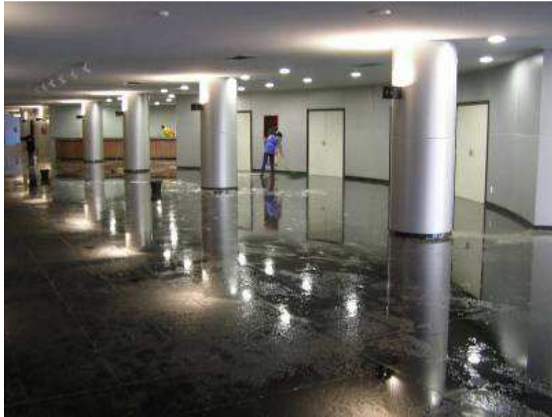
Detalhe de serviço de limpeza.