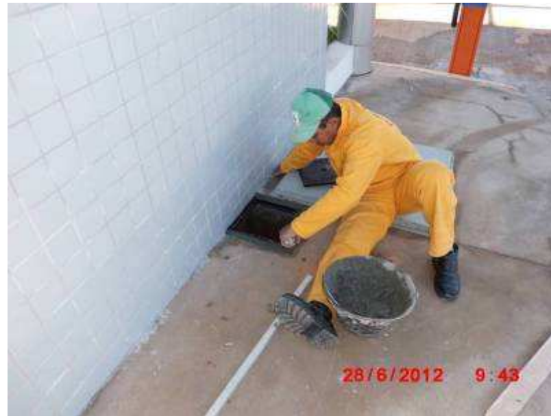
Colocação de tampa de caixa de passagem de instalações elétricas.