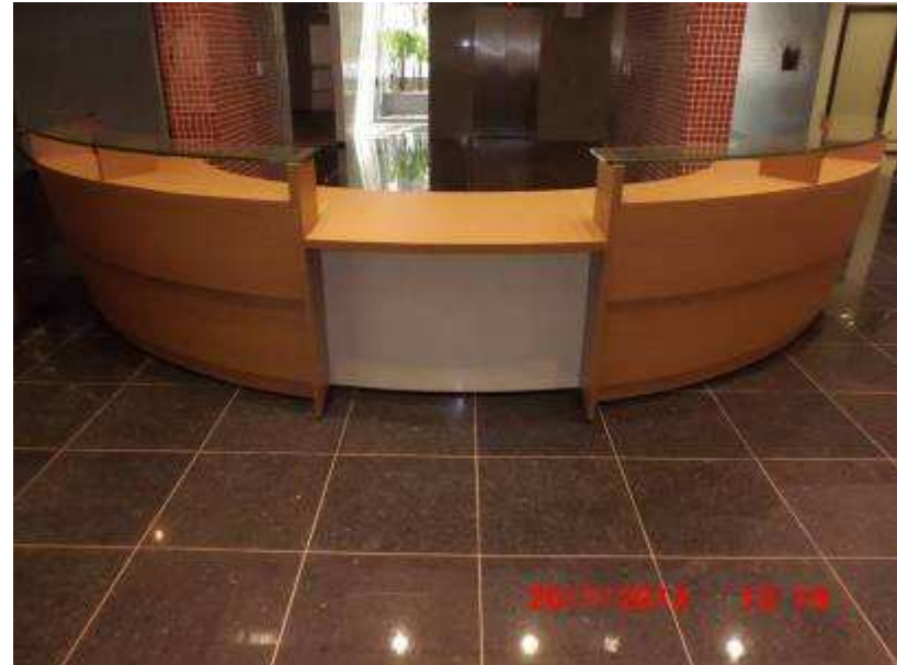
Vista do balcão da recepção.