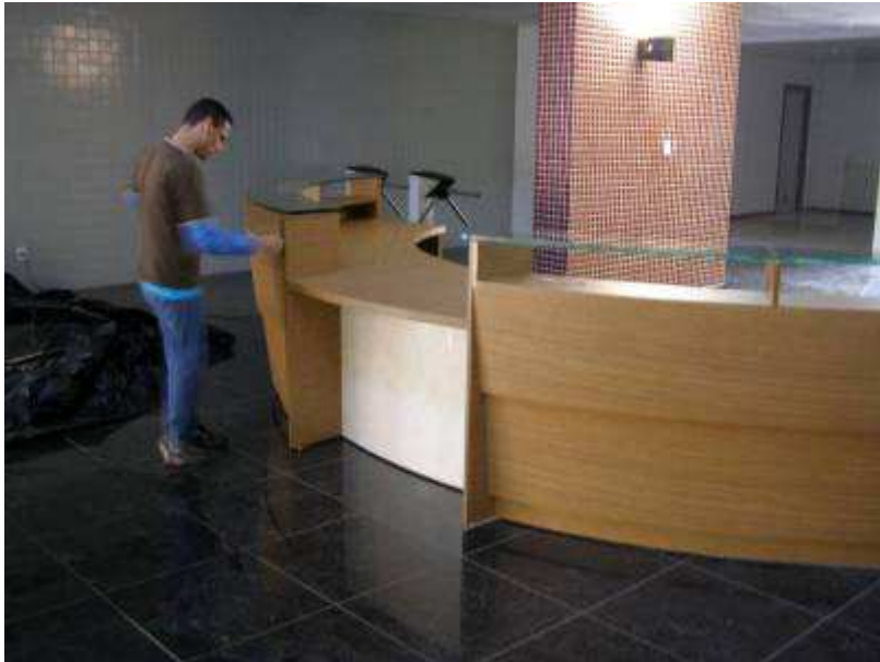
Detalhe da instalação de balcão da recepção.