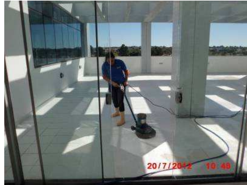
Detalhe de serviço de limpeza.