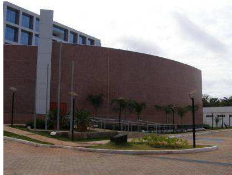
Vista da fachada sul.