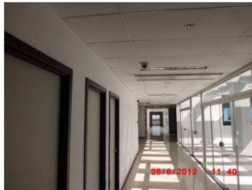
Vista interna do 5º pavimento.