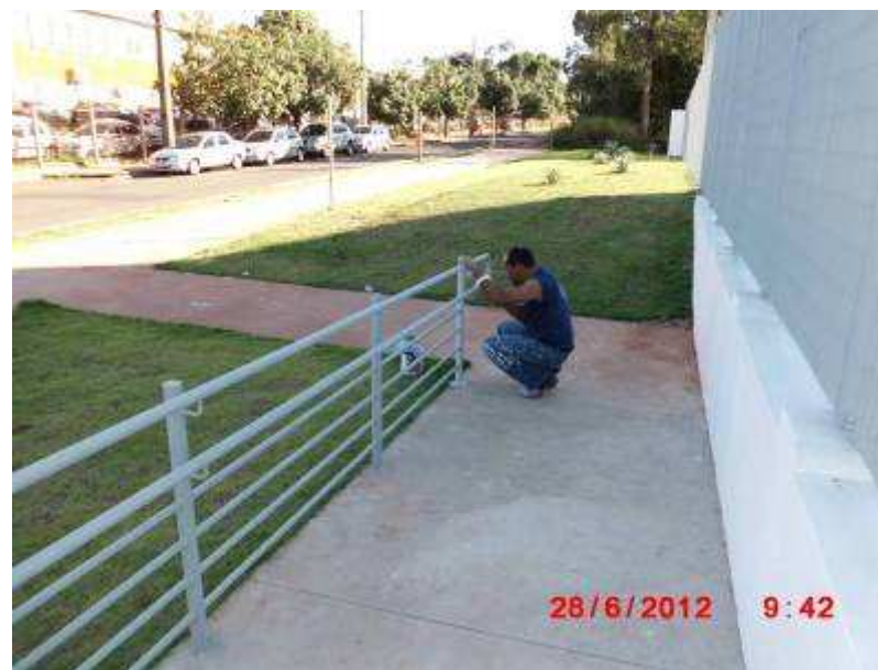
Equipe executando pintura de guarda corpo e corrimão.