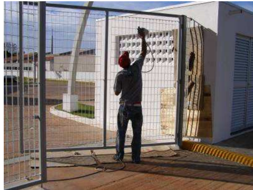
Serviço de pintura em gradil.