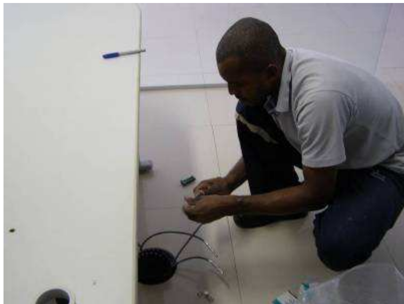
Serviço de instalação de conectores blindados.