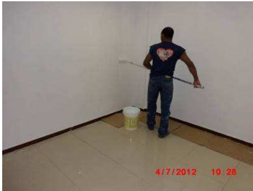
Serviço de pintura interna.