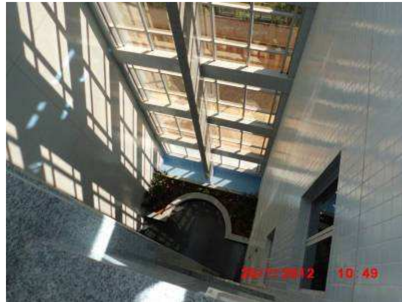
Vista interna pelos elevadores panorâmicos.