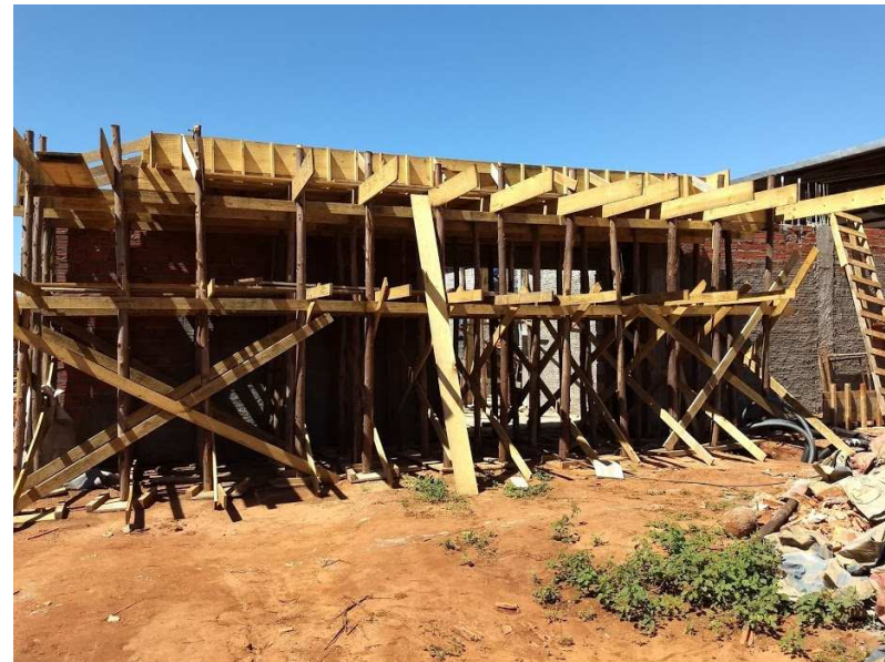
FACHADA – FORMA E ESCORAMENTO DA LAJE MACIÇA DA MARQUISE