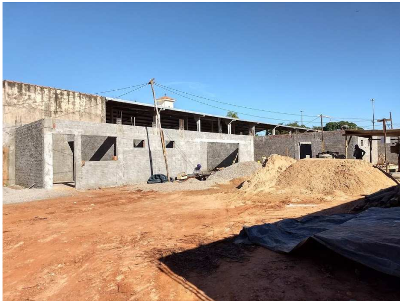
FUNDO DA OBRA – SALA MULTIUSO E TERCEIRIZADOS CHAPISCADA COM CONTRAPISO REGULARIZADO