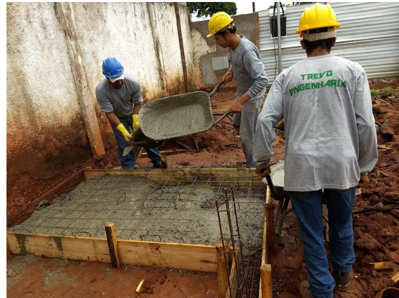
CONTROLE TECNOLÓGICO E CONCRETAGEM DO RADIER DO ABRIGO DE LIXO