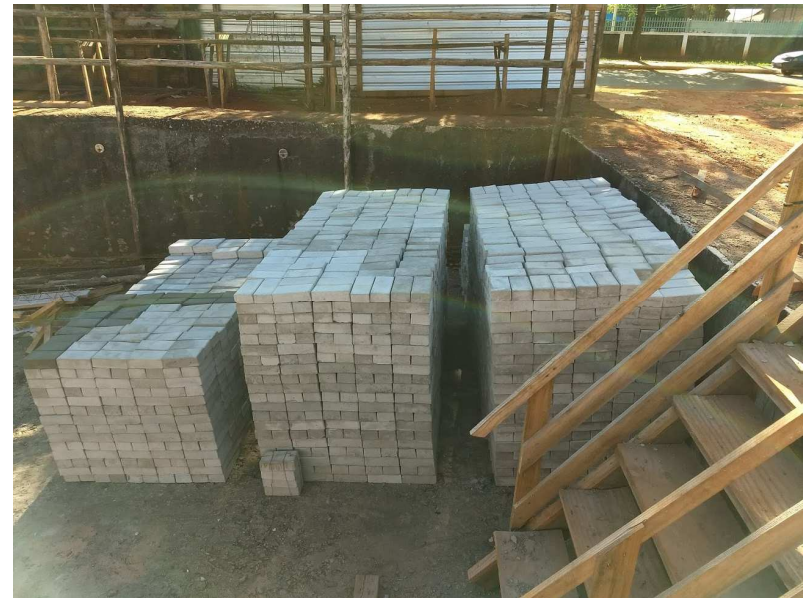
Detalhe da fabricação dos ecoblocos no canteiro de obra