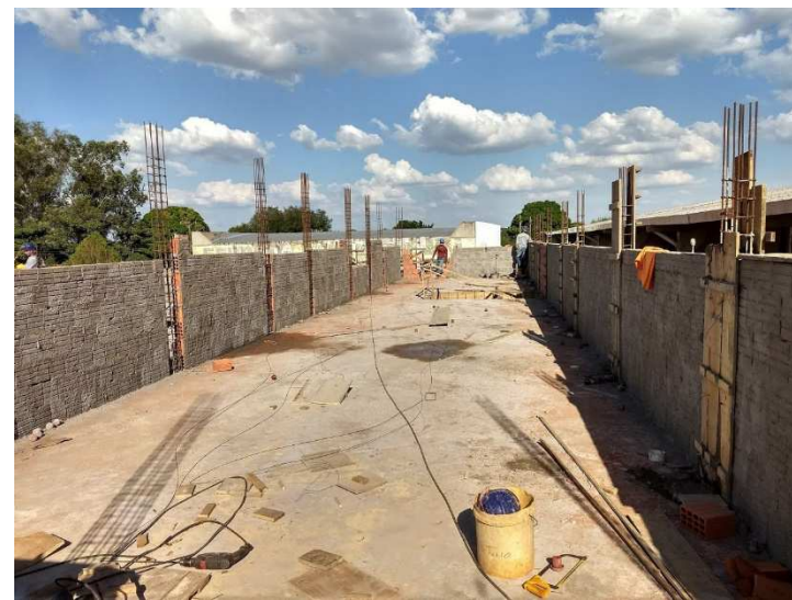
Chapisco na platibanda e, em seguida, o 2º pavimento chapiscado