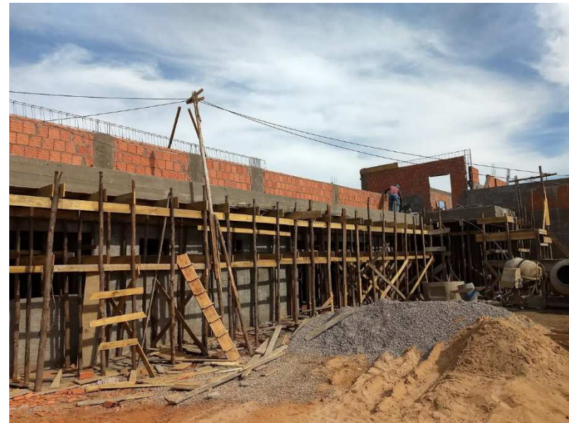
Alvenaria de vedação do 2º pavimento e caixa d'água.