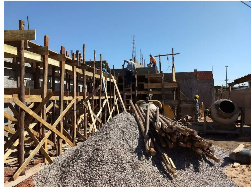
Detalhe de escoramento de laje pré-moldada e de laje maciça (beiral)