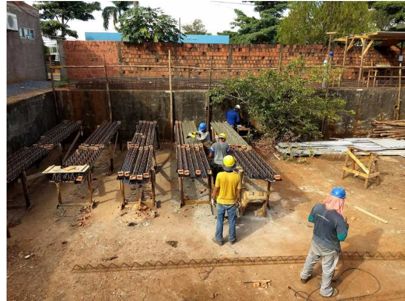
Detalhe da fabricação de lajes pré-moldadas no canteiro de obra