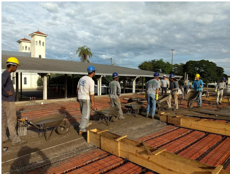
Transporte horizontal e lançamento final do concreto