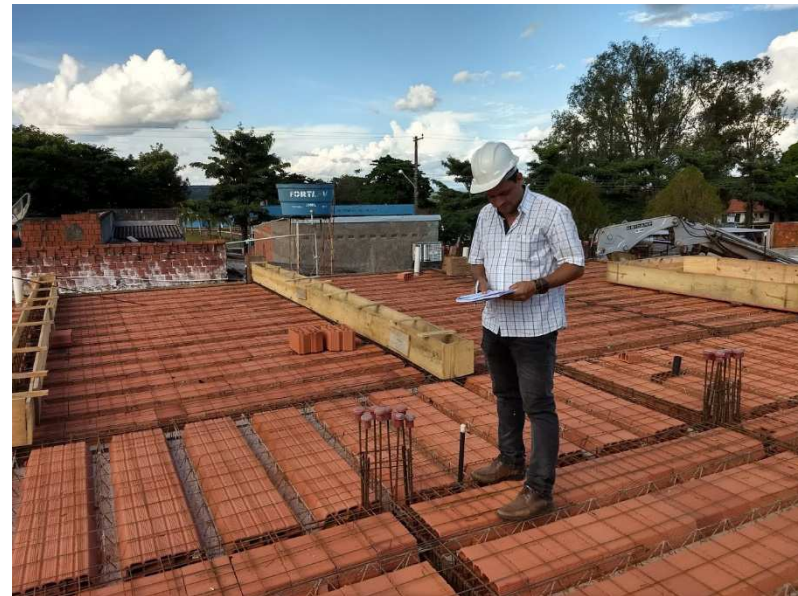
Conferência das armaduras para liberação da concretagem