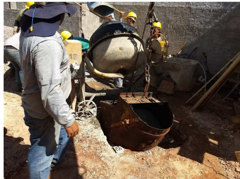
Confecção de concreto em betoneira e lançamento primário em caçamba adaptada no munk