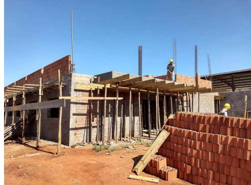
Alvenaria de vedação das platibandas