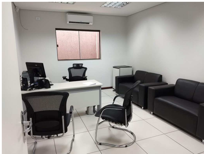
Detalhe do gabinete do Juiz e da sala da OAB