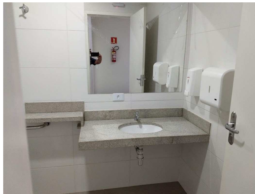
Detalhe dos espelhos nos banheiros