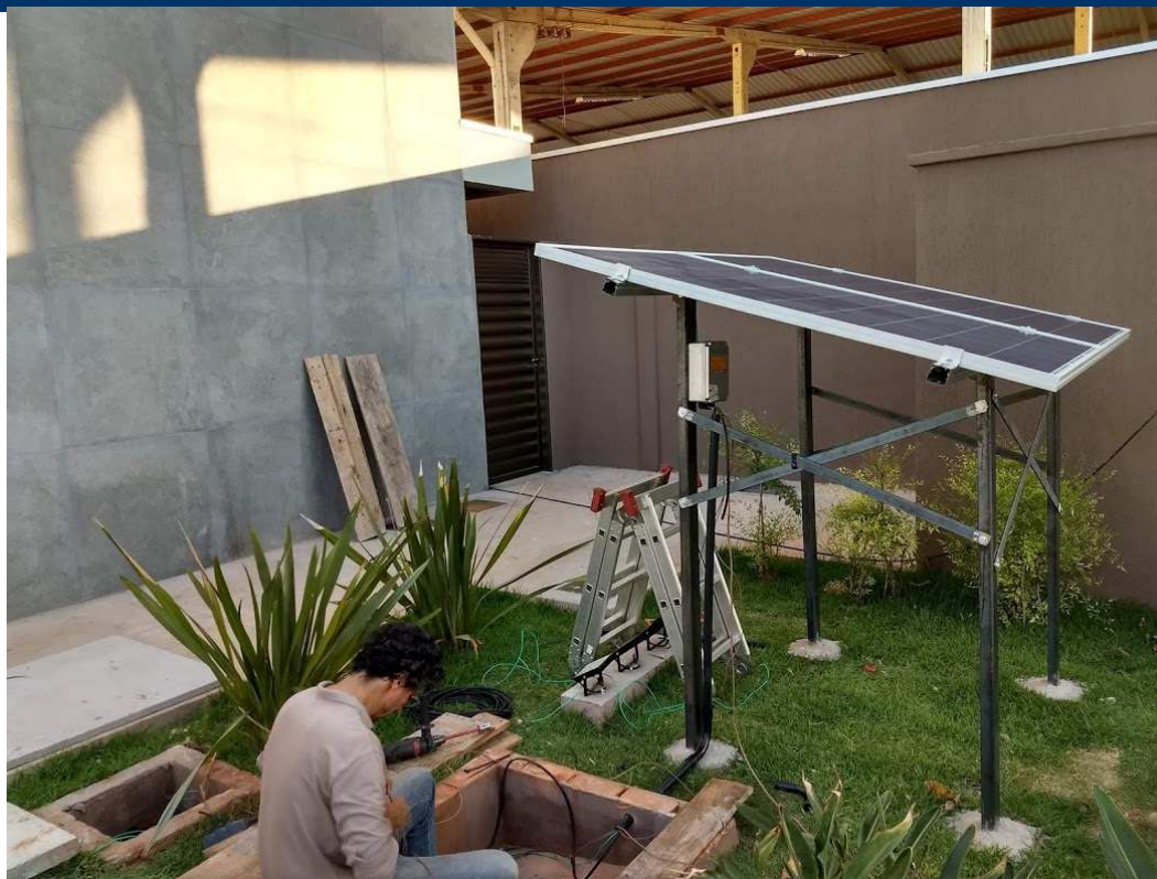
Detalhe da instalação das placas fotovoltaicas