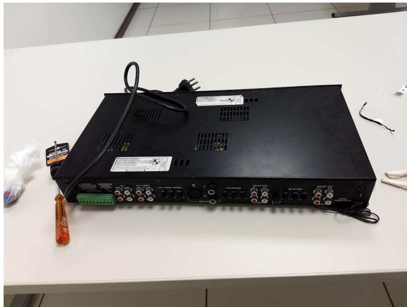
Detalhe da mesa de som