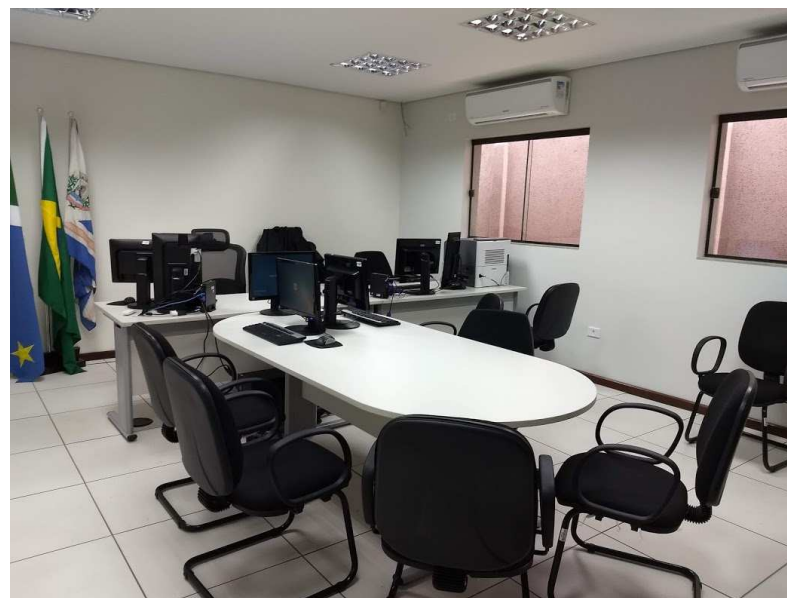
Detalhe da secretaria mobiliada e da sala de audiência