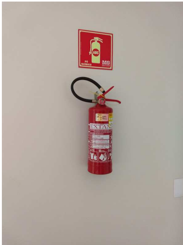
Detalhe das sinalizações