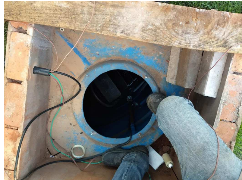
Detalhe da bomba movida a energia solar e o reservatório de 5000l enterrado (cisterna)