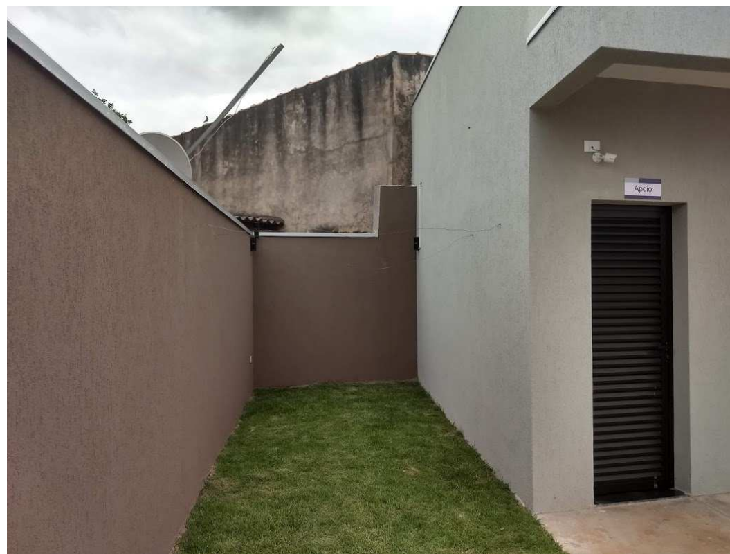
Detalhes da infraestrutura das câmeras e do IVA