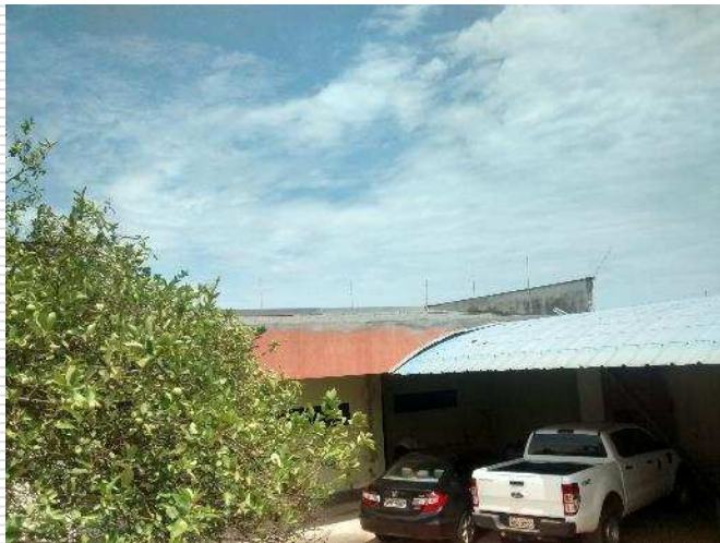
Cobertura e estrutura do arquivo.