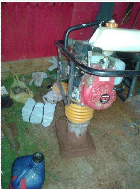
Compactador de solo do tipo "sapo"