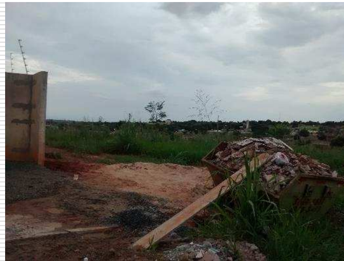
Caçambas para retirada de entulhos