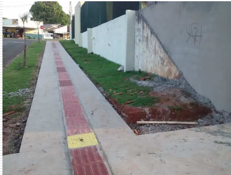
Calçamento externo com piso tátil