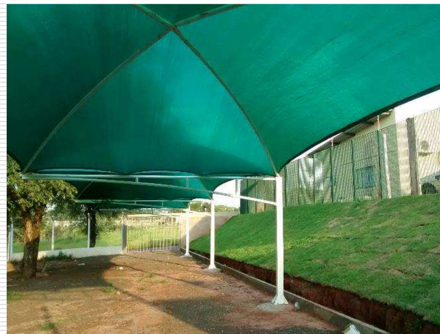
Sombreadores instalados no pátio inferior.