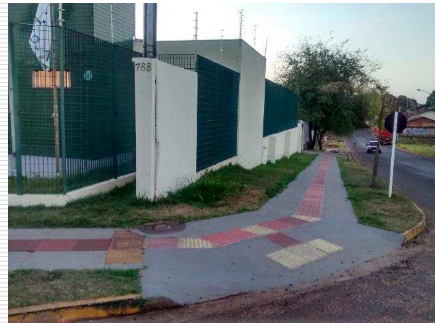
Calçada com piso tátil direcional