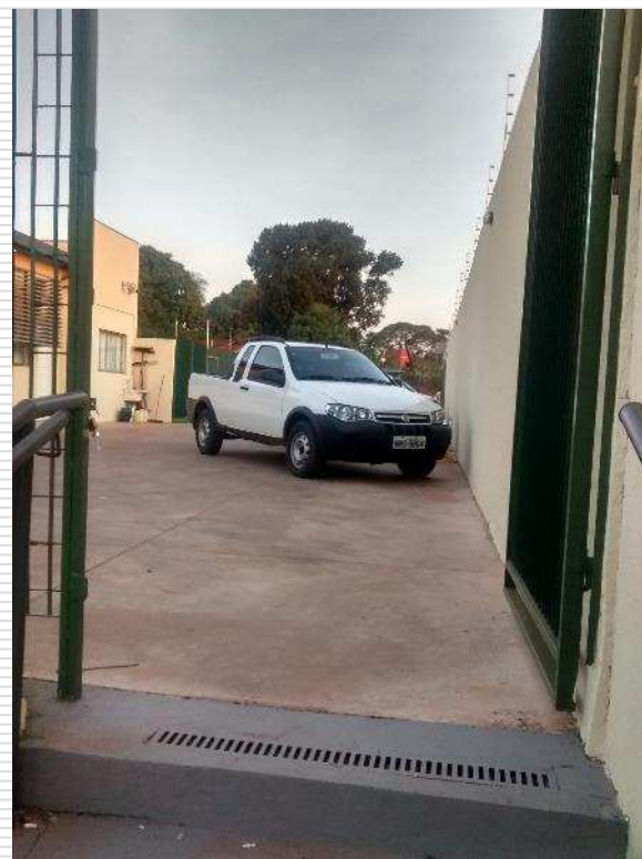
Portão de elevação para veículos e portão de acesso ao pátio superior