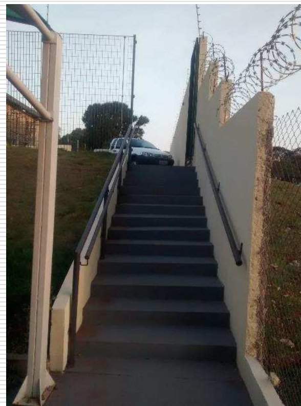
Escadaria de acesso ao pátio superior e alambrado