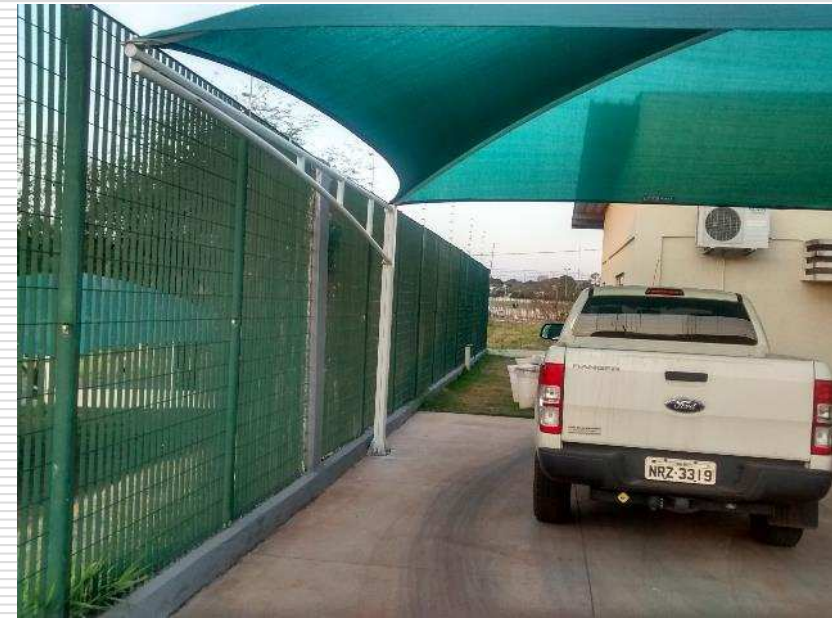
Sombreadores do pátio superior