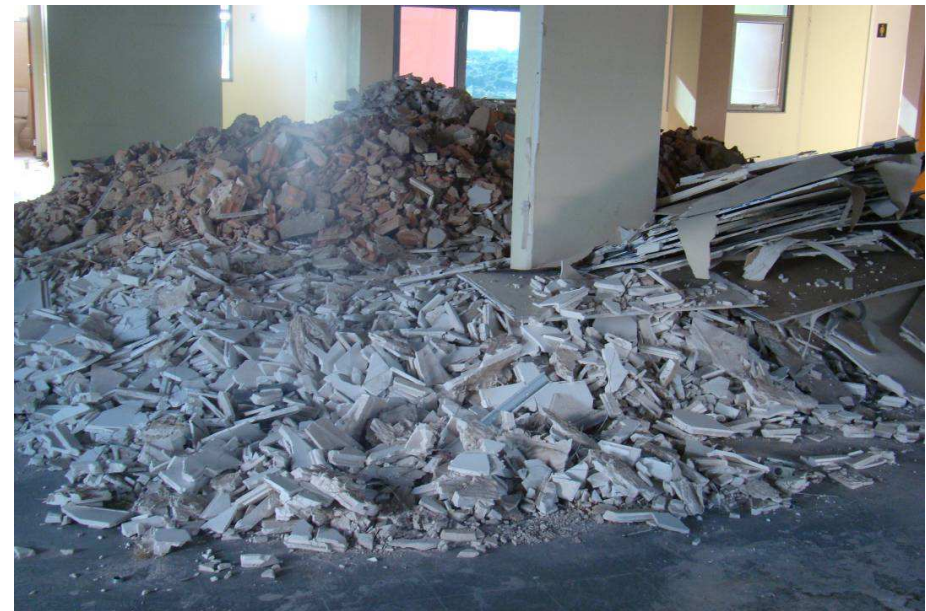
Detalhes da demolição de alvenaria e da demolição de forro de gesso