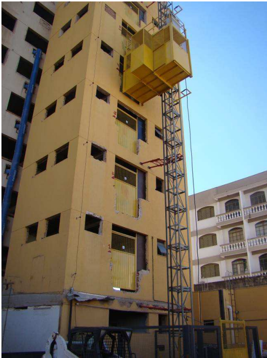
Cremalheira e Mestre de obras