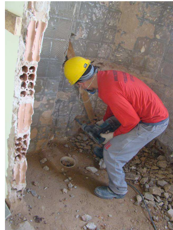
Detalhes do Transporte de entulho em caminhão basculante e Demolição de argamassa