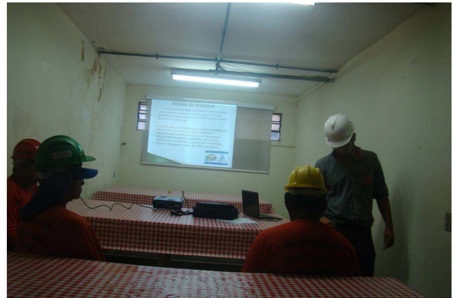
Detalhes das placas de obra, dos vãos das esquadrias após a retirada e treinamento da mão de obra para o trabalho seguro, conduzido pelo técnico de segurança do trabalho (Danilo).