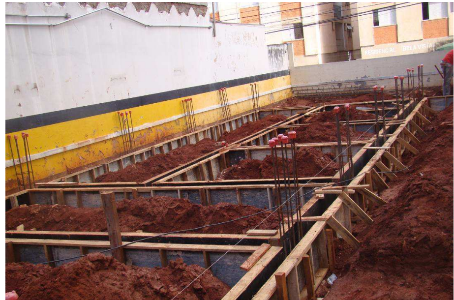
Detalhes dos blocos de transição das salas de subestação e do grupo gerador e das formas dos baldrames com arranque dos pilares.