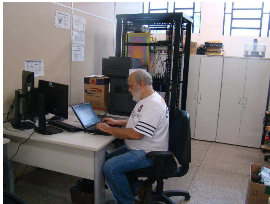
Desinstalação, remanejamento de endereço e reinstalação de uma central telefônica phillips (SOPHO iS3030)