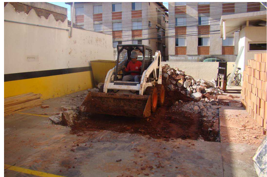
Detalhes da demolição do piso de concreto e do carregamento de entulho em caminhões basculantes