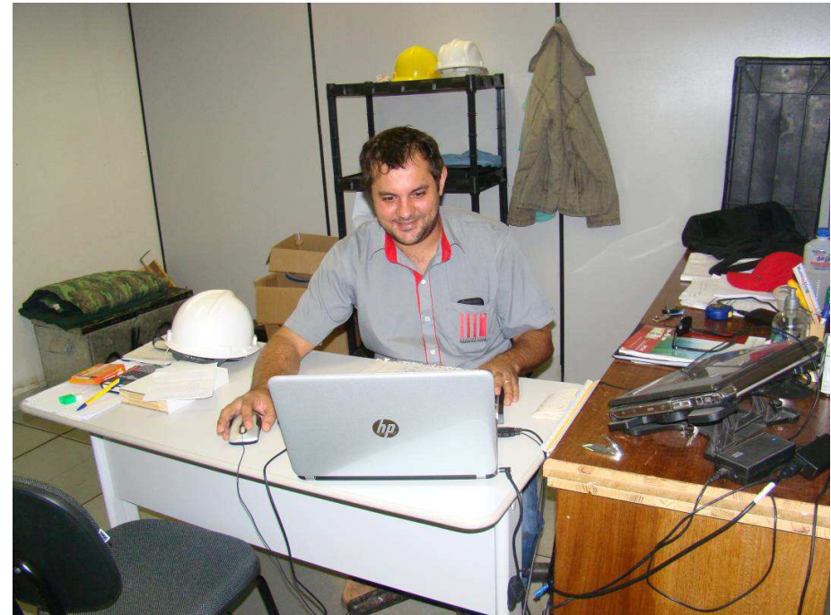
Equipe técnica da Construtora, Engenheiro Jr, Mestre e Eng. Pleno.