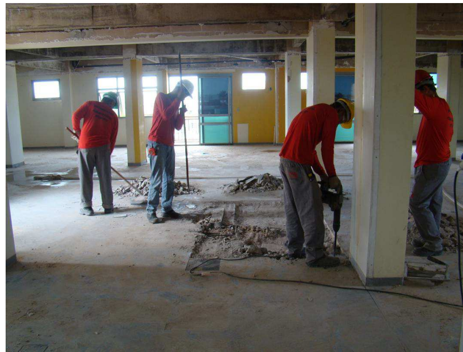
Detalhes da retirada de telhas de aço e o agulhamento das terças. Detalhe da retirada de piso de Paviflex e da sua regularização.