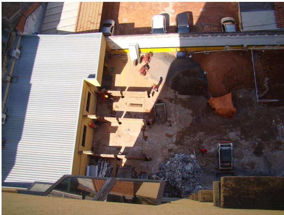
Vista do canteiro de obras e parte do almoxarifado