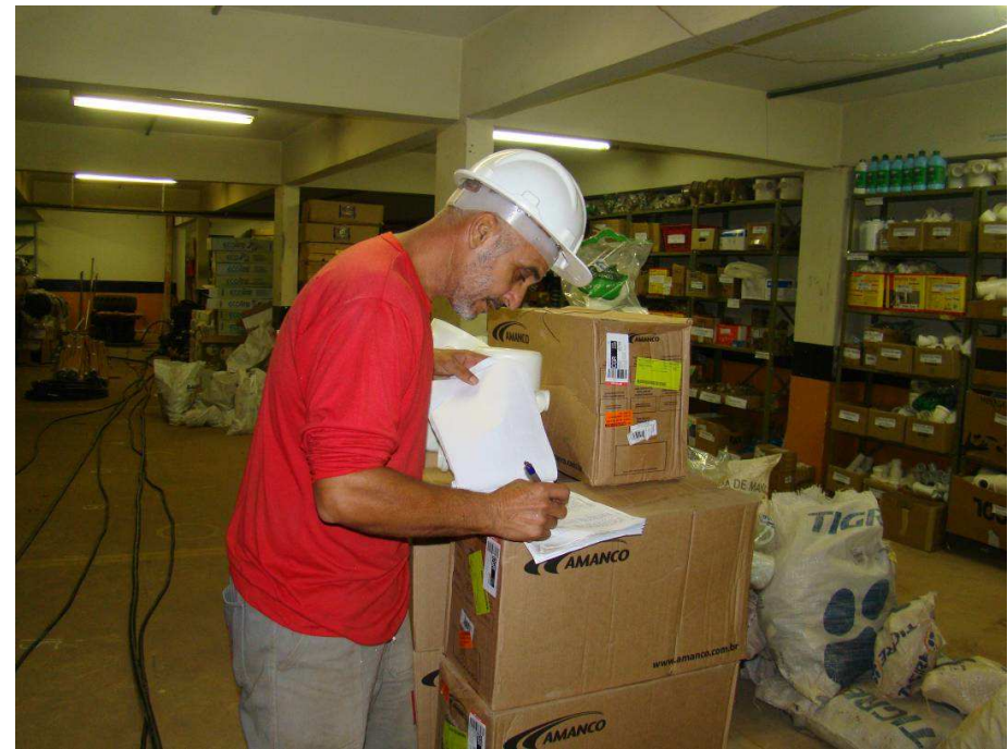
Apontador e Almoxarife da obra