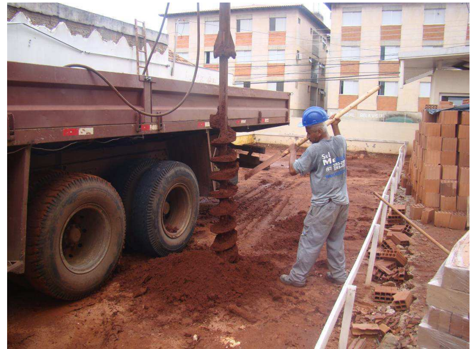
Detalhes do início da montagem do gabarito dos anexos e da fundação indireta (estaca rotativa).