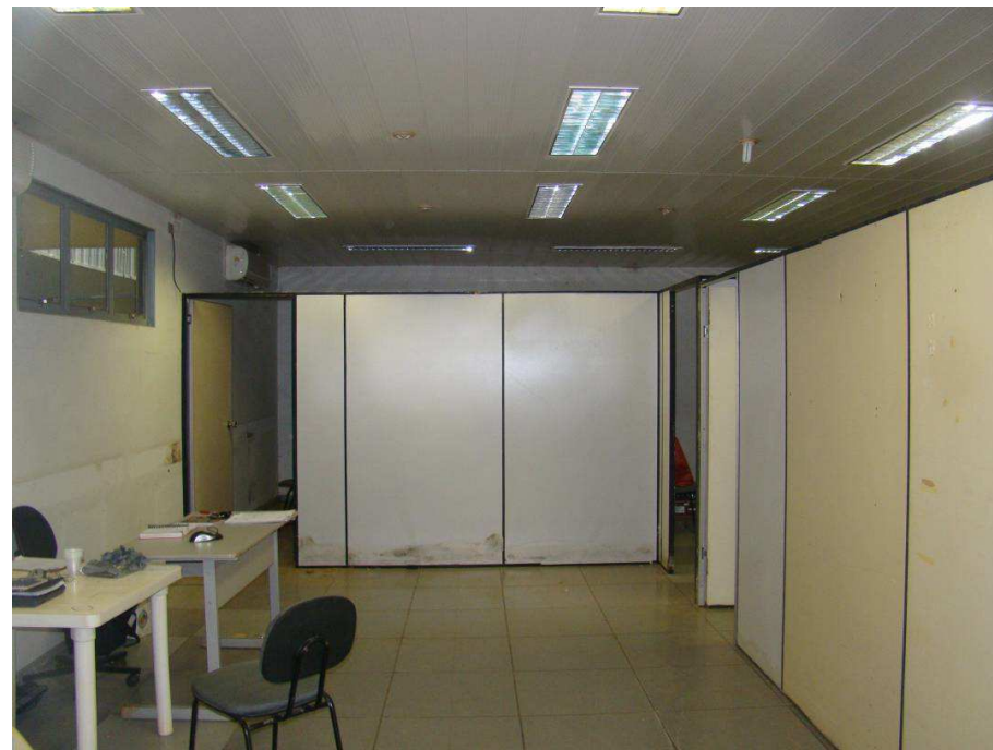
Caçambas estacionárias e escritório da Construtora.