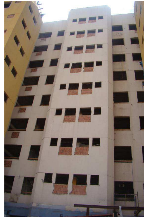
Detalhes de parede de alvenaria e vergas no 8º pavimento e fechamento de alvenaria nas fachadas