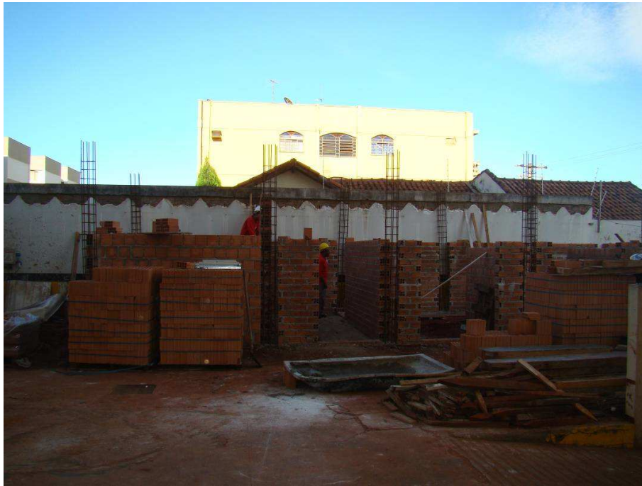
Vista da alvenaria dos anexos com as armaduras dos pilares. Detalhes das vigas baldramas e o término da desforma