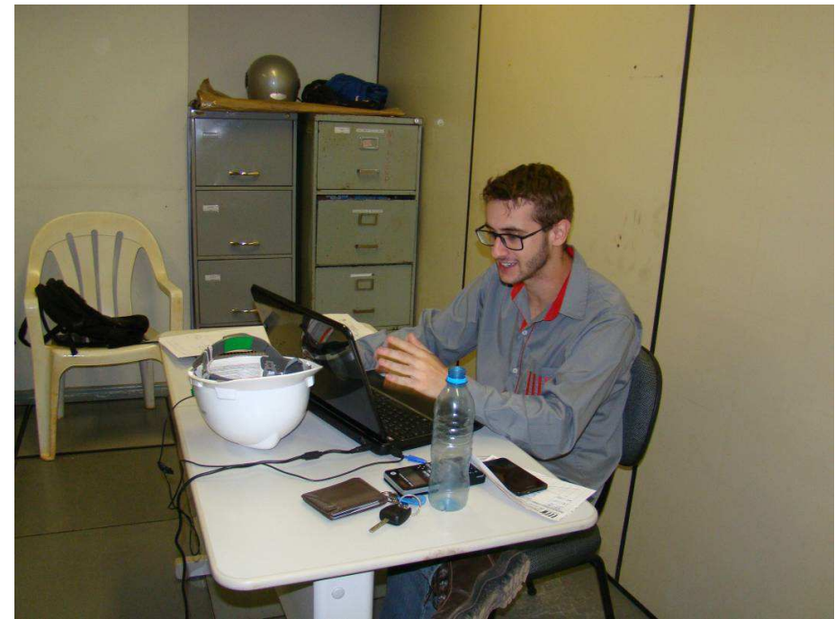
Técnico em segurança do trabalho e estagiário de engenharia