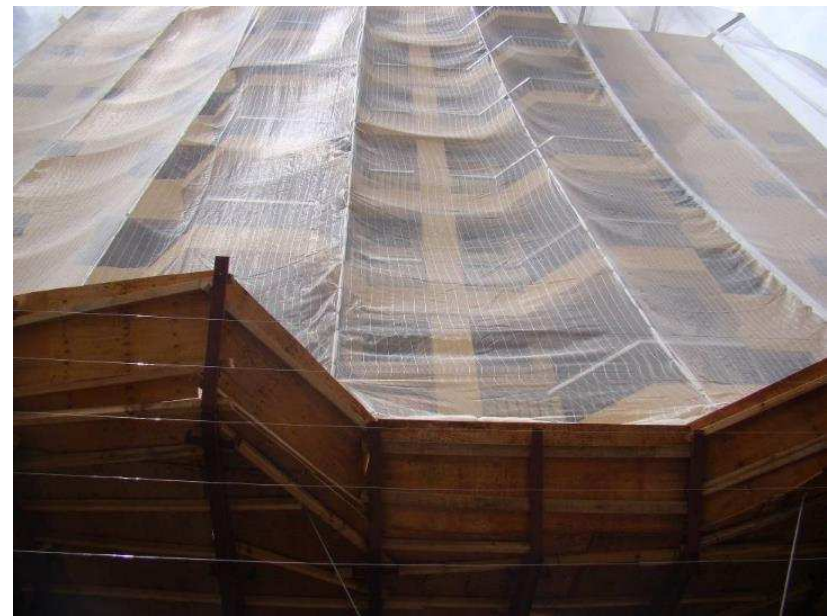
Montagem de proteção de fachada em tela e bandejas