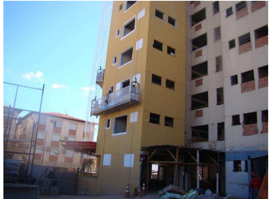
Detalhe do emassamento interno e aplicação externa de Permacyrl com balancim