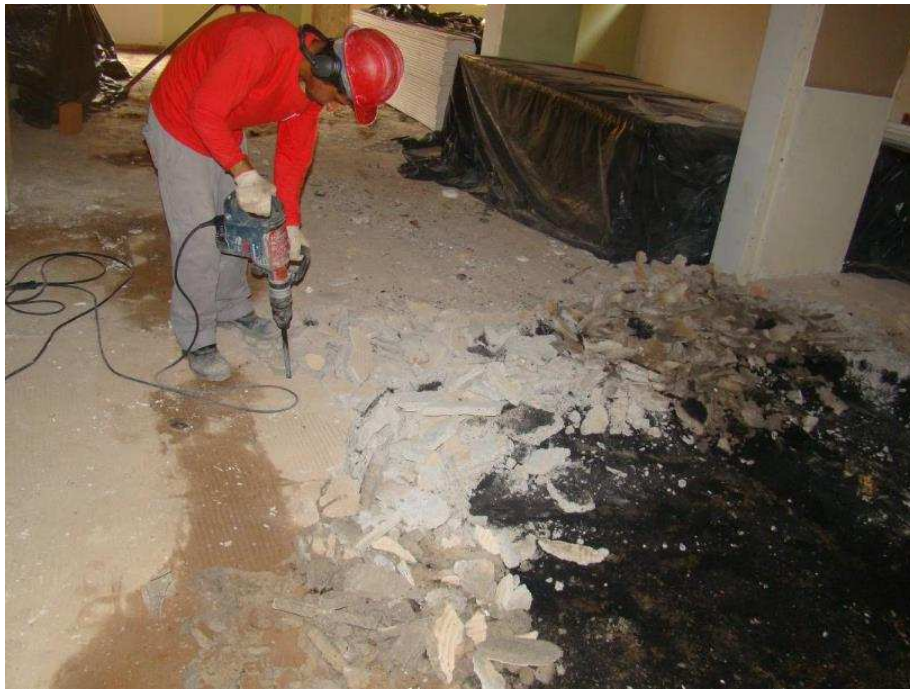
Detalhes de contrapiso no térreo (enchimento com carvão)