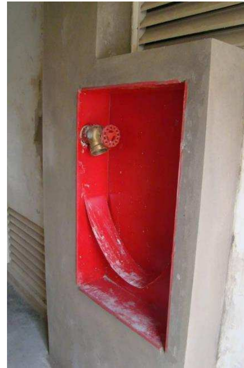
Detalhe das caixas de hidrantes com o registro instalado