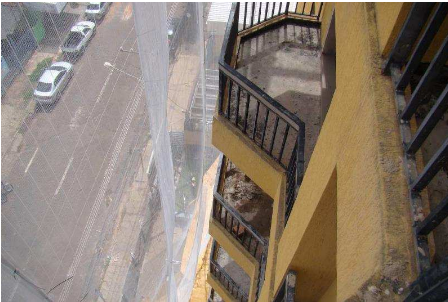
Demolições de piso e argamassa de revestimento de lajes de sacadas da fachada