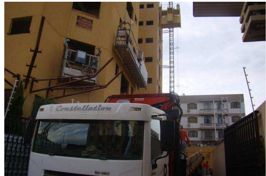
Montagem de bandejas, balacim fachadeiro e sistema de transporte vertical externo