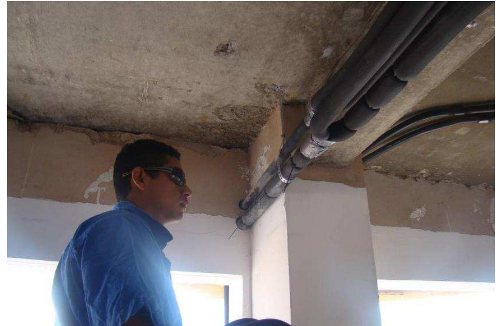
Detalhe da tubulação frigorífica e do teste de pressão.