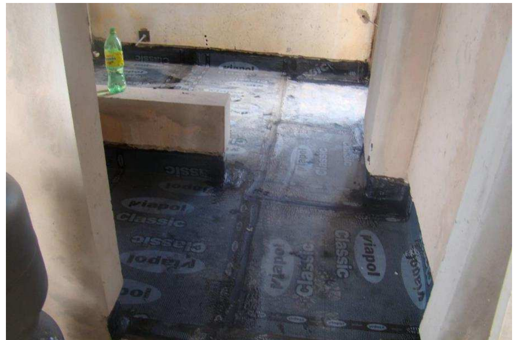
Detalhe da manta asfáltica 4,00mm aplicada na cobertura.