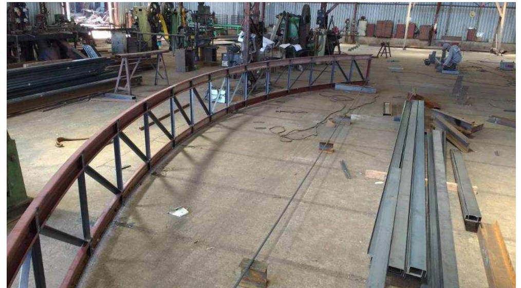
Detalhe das estruturas metálicas sendo montadas na Sulmetal