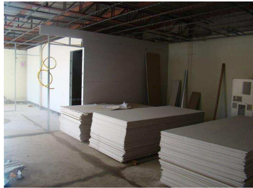
Detalhes do início da retirada do forro e transferência do “Modular Safe” com os “Nobreak” – Situação sem o forro, o piso elevado e os equipamentos de informática