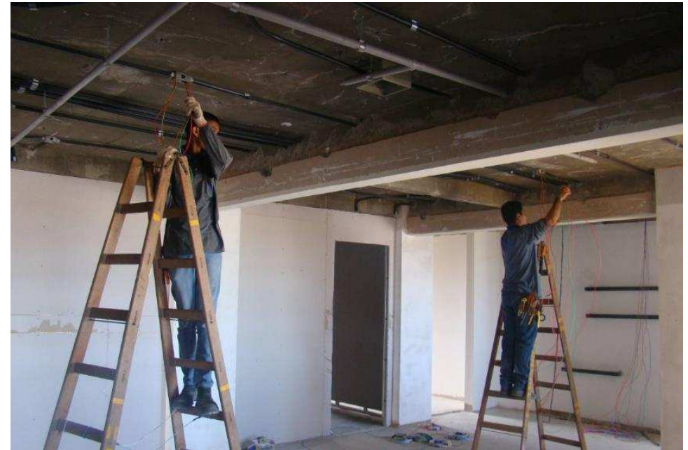
Detalhe do início da montagem dos “shaft” e da enfição