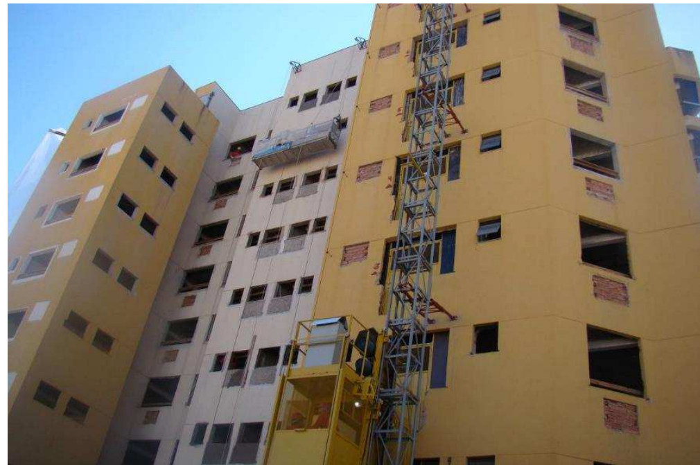
Detalhe do processo de emboço externo com balancim