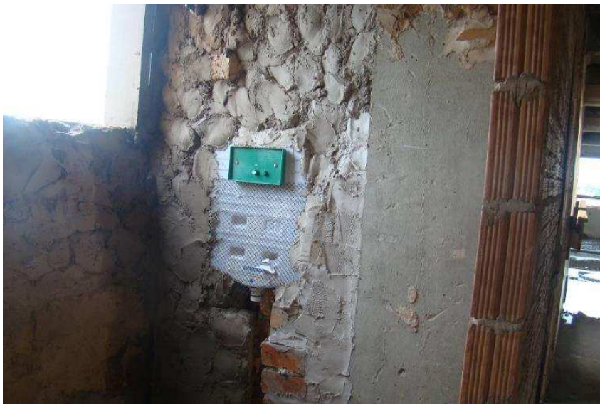
Detalhe do processo de reboco nos banheiros