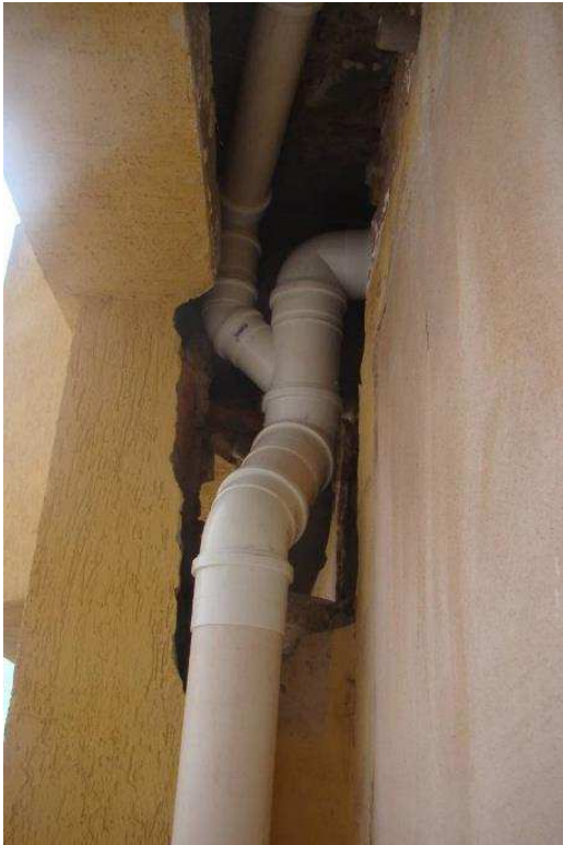
Detalhe da prumada de água pluvial das sacadas (sul) e esquema de água fria dos banheiros c/ cx de descarga embutida