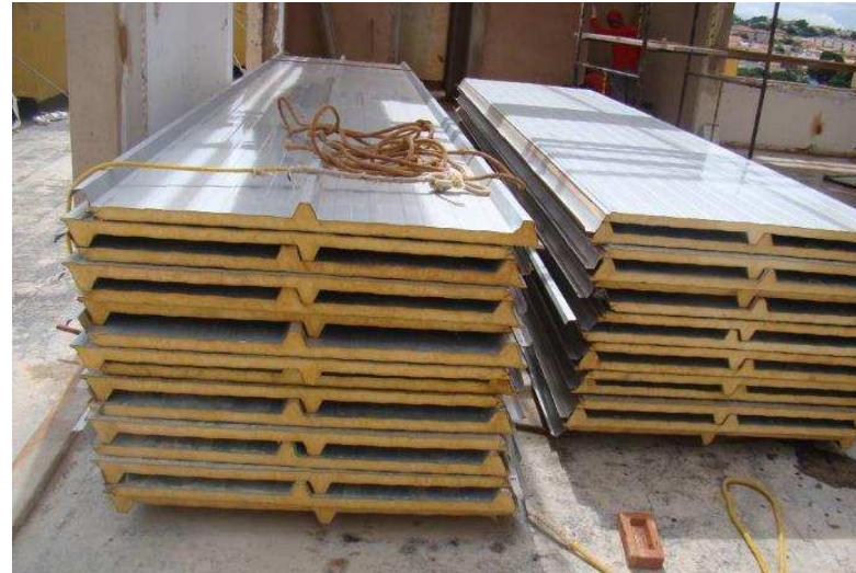
Detalhe da Cobertura com telha termoacustica aço trapezoidal galvalume.