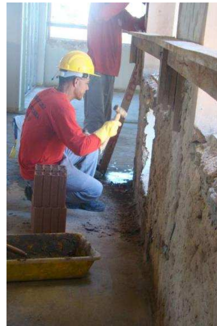
Demolição de caixa de concreto para ar condicionado de janela