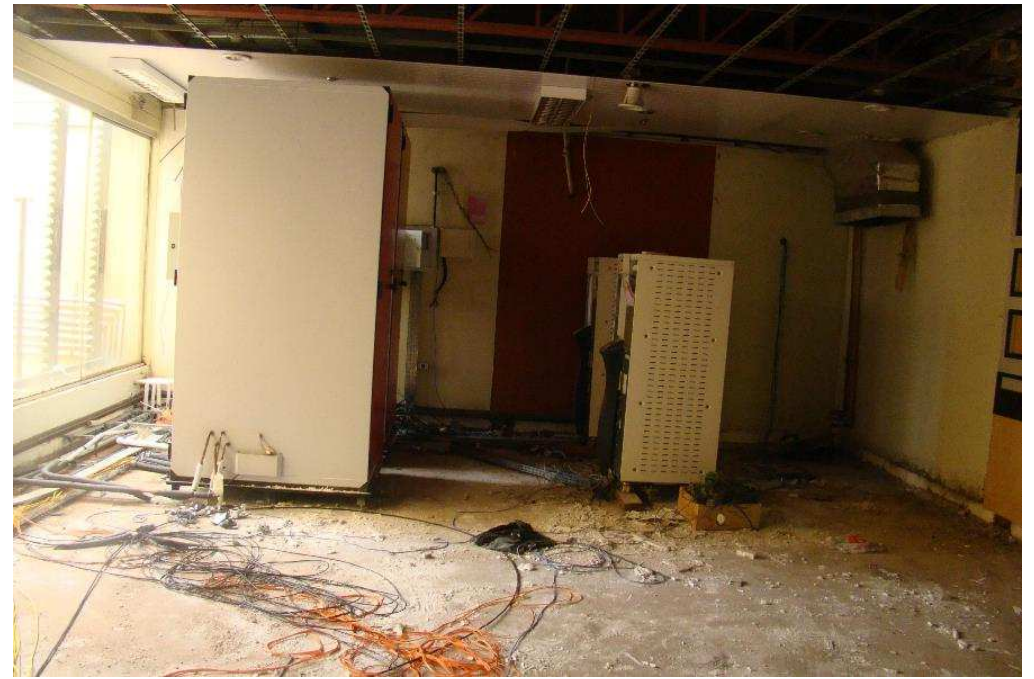
Retirada de forro, piso elevado, divisórias no térreo (área dos cofres modulares e no-breaks)