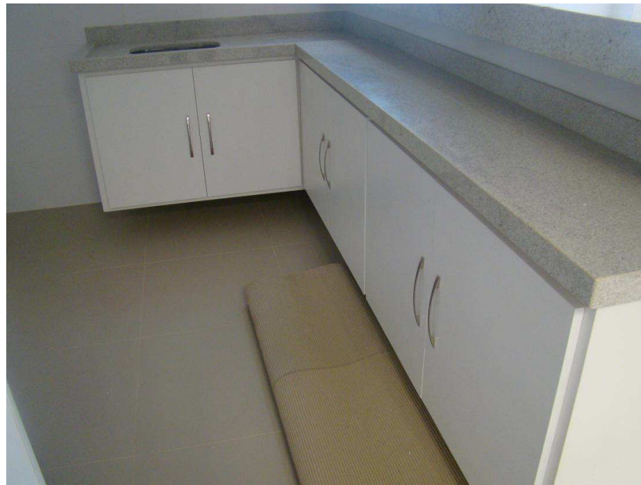
Detalhes dos armários em MDF com bancadas e cubas.