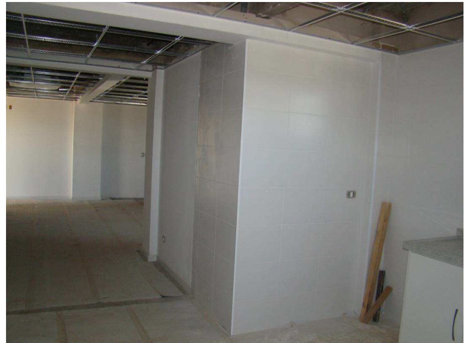
Detalhes do piso elevado instalado e protegido com papel acartonado e de porcelanato da varanda limpo e rejuntado