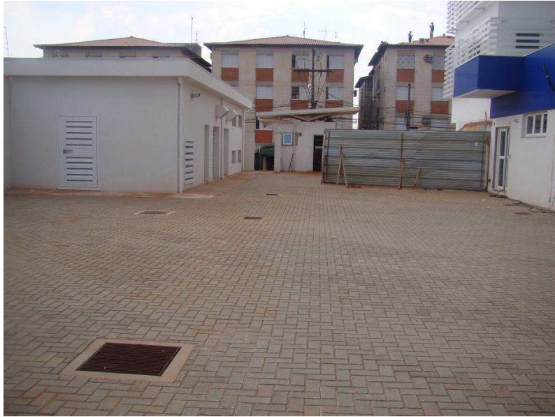
Detalhe das caixas de inspeção e de areia com grelha de captação