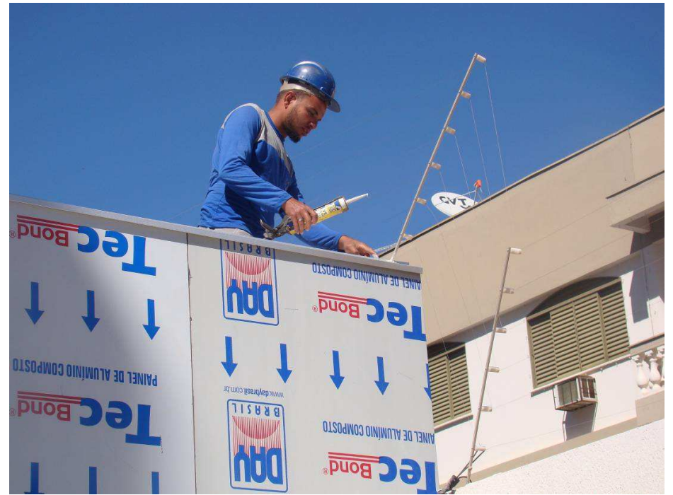
Detalhe da instalação de sobrefachada da fachada e o rejuntamento do alumínio composto com silicone