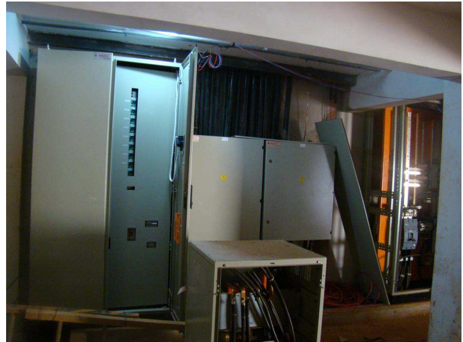
Detalhes das luminárias de embutir e do painel de distribuição para 30 disjuntores