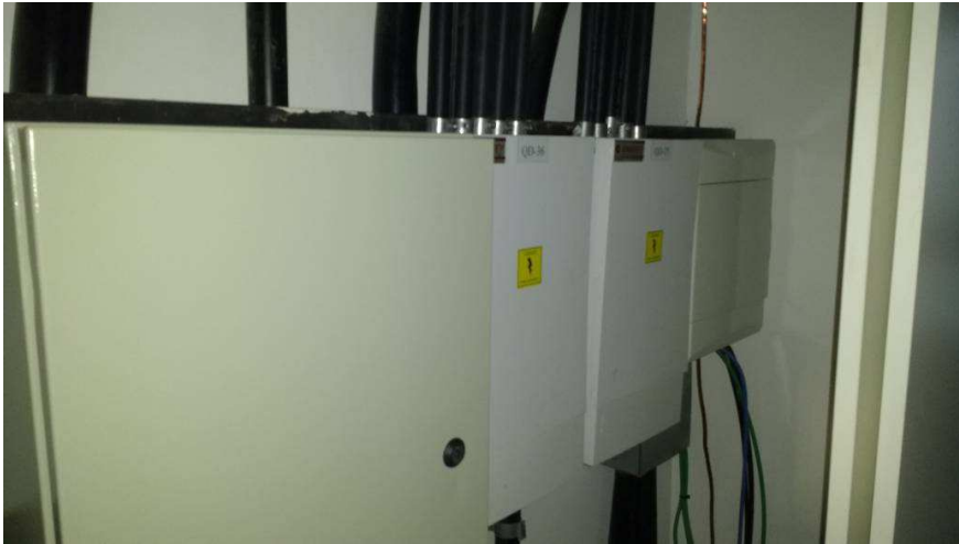
Detalhe de quadros de distribuição e da iluminação de emergência