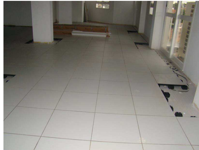
Detalhe do piso elevado instalado no 7º e 8º pavimento