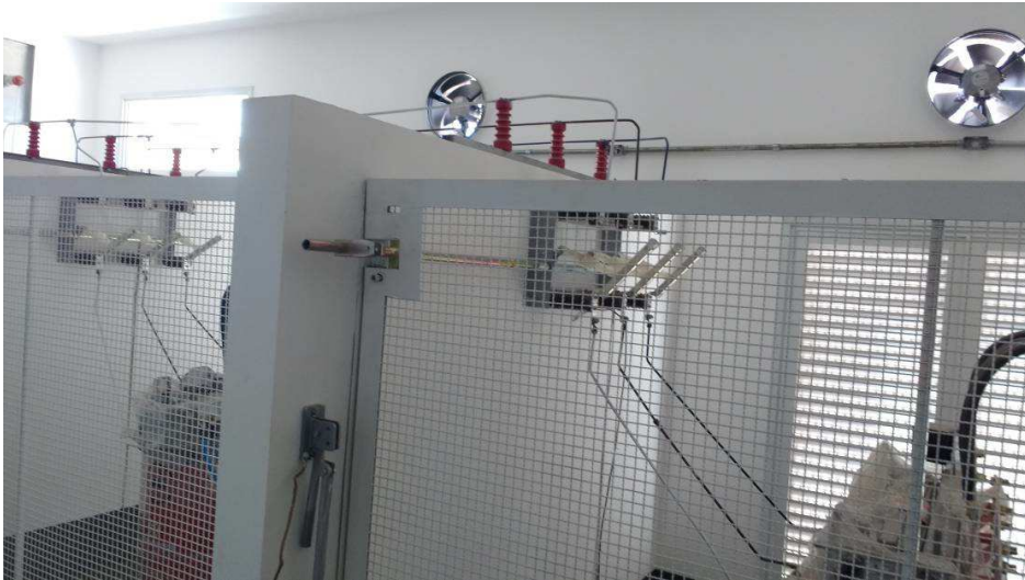
Detalhes dos exaustores