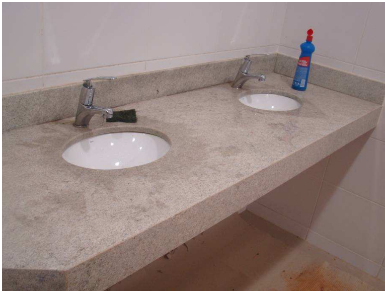
Detalhes de bancadas aqualux já com as torneiras c/ acessibilidade