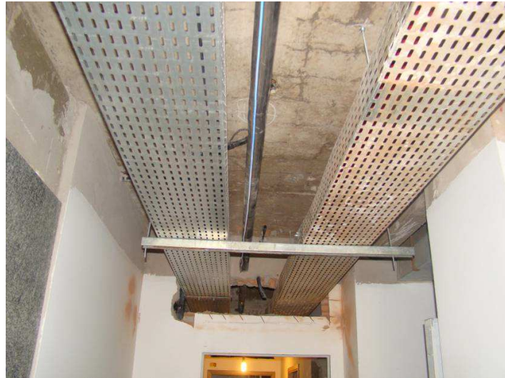
Detalhes das eletrocalhas e das luminárias de embutir