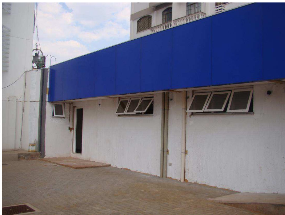
Detalhe da instalação do alumínio composto instalado