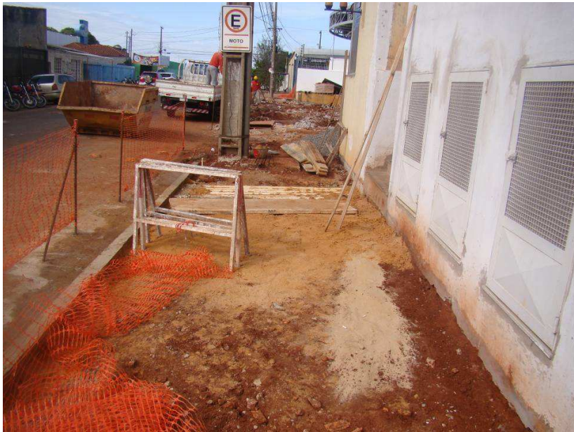
Detalhes da demolição do piso do passeio público (fachada)