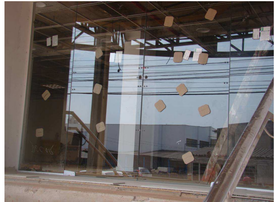
Detalhes das esquadrias de vidro no Térreo