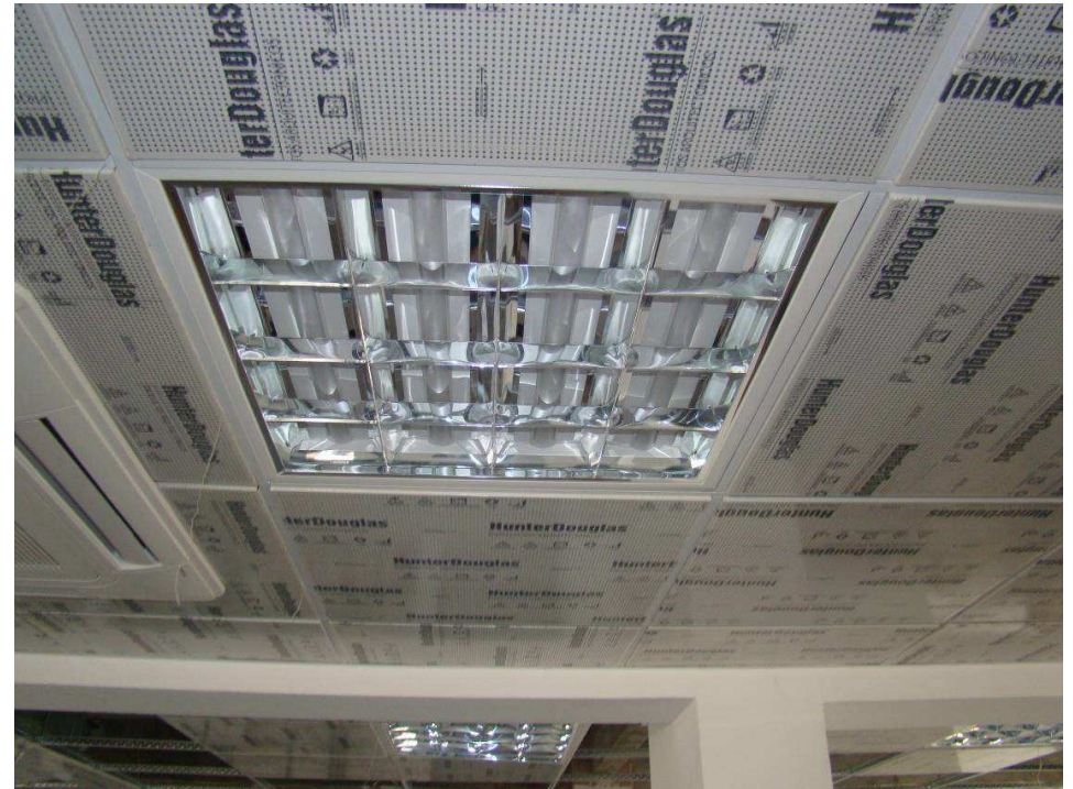
Detalhes da montagem da estrutura do forro metálico e o mesmo conjuntamente com a luminárias de embutir quadrada