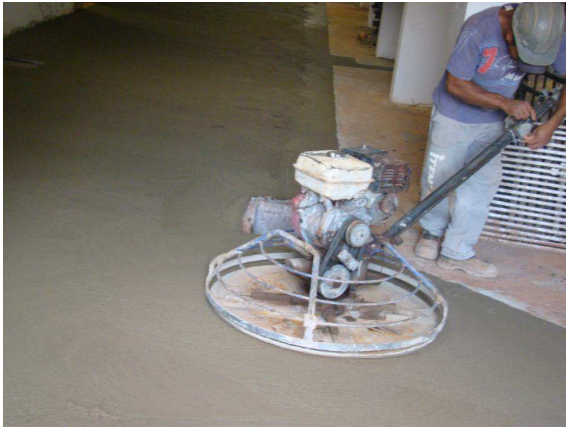
Detalhes da regularização de piso no subsolo