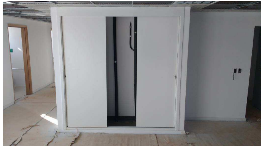
Detalhes de portas das salas e "shaft"