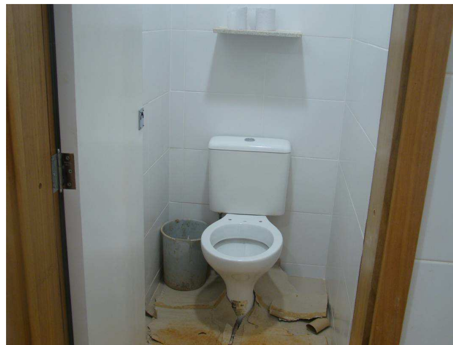
Detalhes dos banheiros acessíveis com as louças e barras instaladas