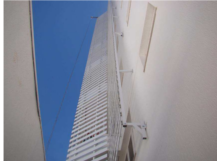
Detalhes da pintura externa da fachada e do látex no interior da Vara.