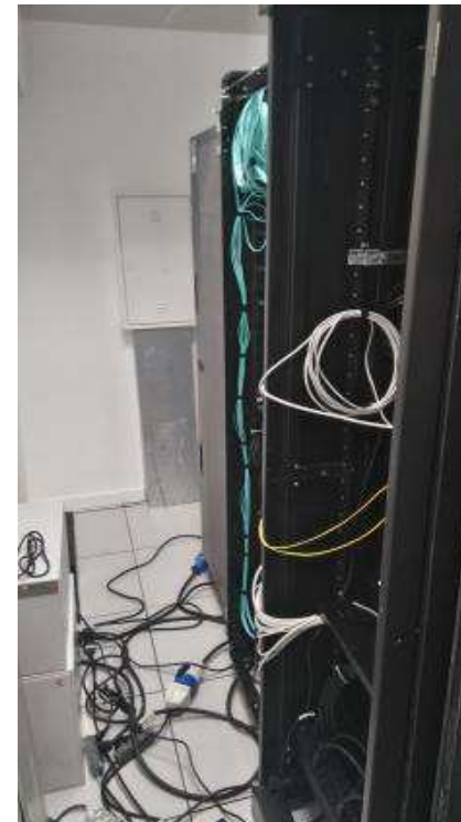
Detalhes dos racks instalados na sala de TI. Na vista do fundo, está reinstalado a central telefônica de PABX.