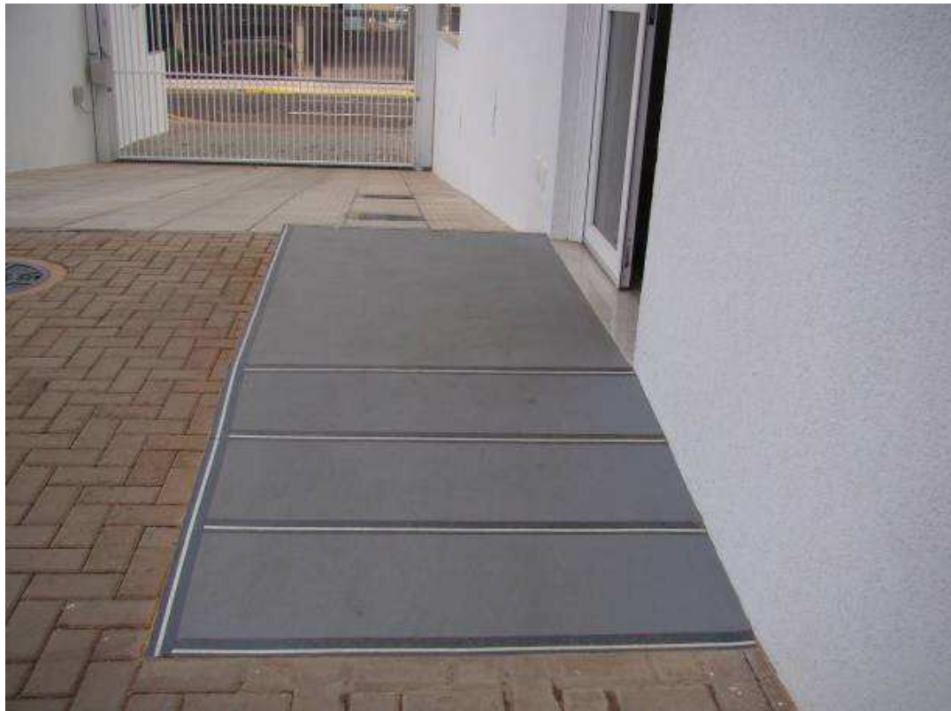
DETALHES DAS FITAS ANTI-DERRAPANTE FOTOLUMINESCENTE