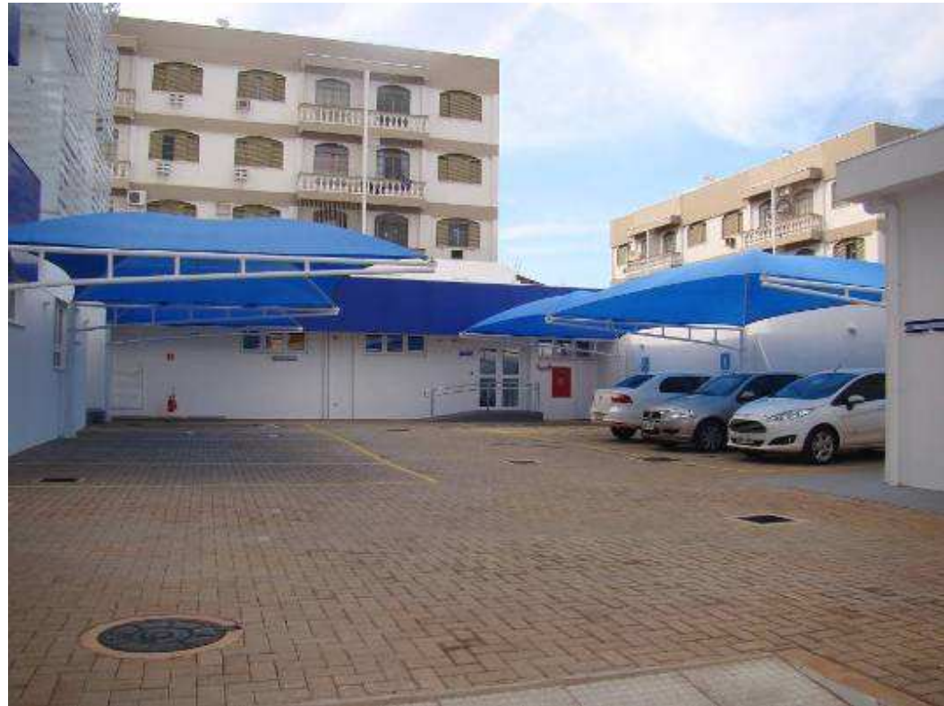
Detalhes Cobertura veículos com tela sombreamento em estrutura de aço