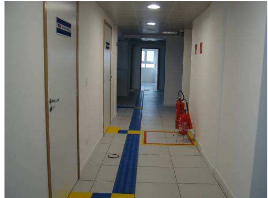
Detalhes Mapa tátil em acrílico com pedestal E Piso tátil PVC alerta e direcional 25x25cm