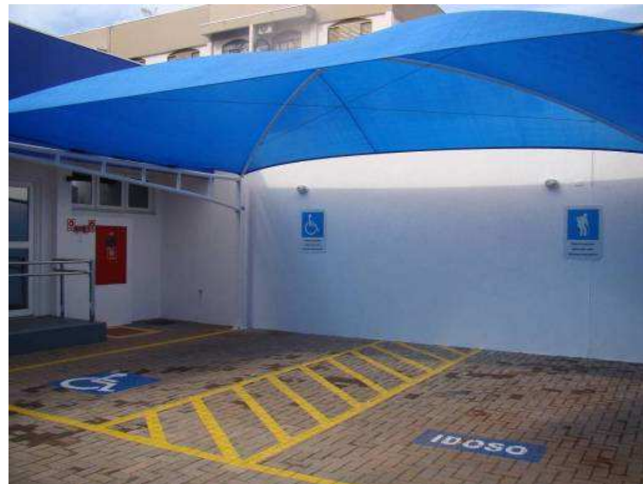
Demarcação de vaga com símbolo universal para idoso pintura hidrofugante em piso, soleira rodape granilite