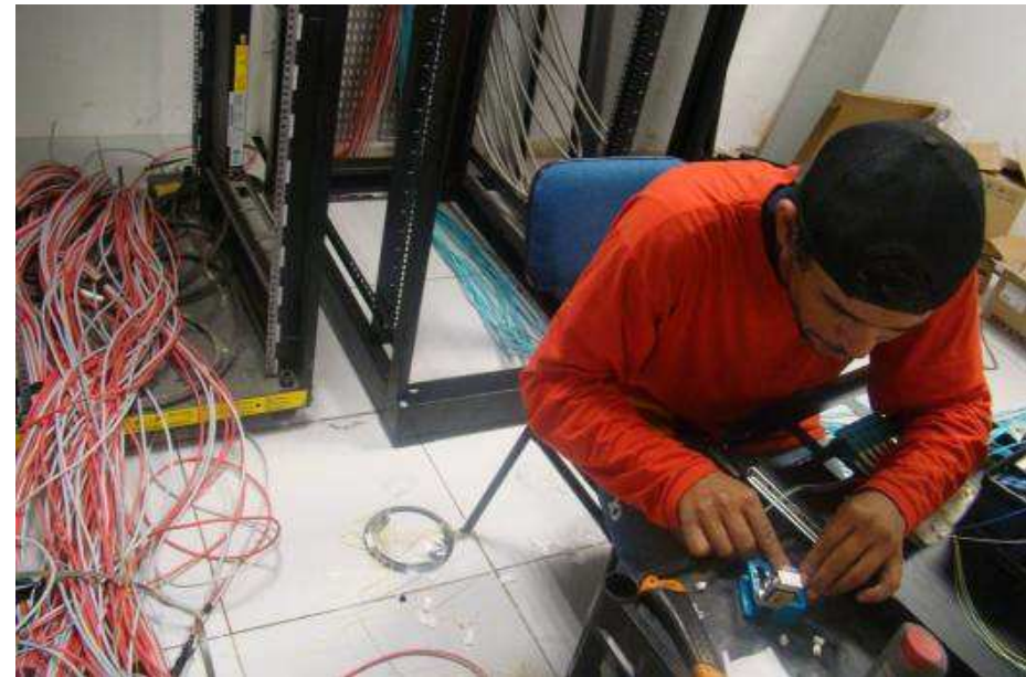
Detalhes da Crimpagem, certificação e identificação de cabos CI e dos cabos UTPs