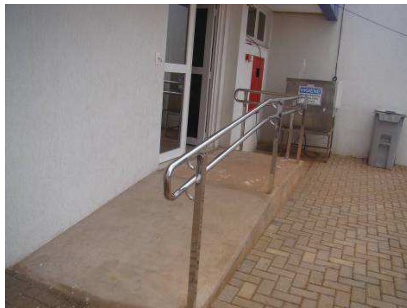
Detalhes do corrimão interno e externo