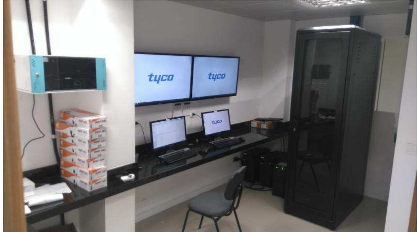
Detalhes do rack na sala de segurança contendo servidores, switches e storage (armazenagem de imagens).