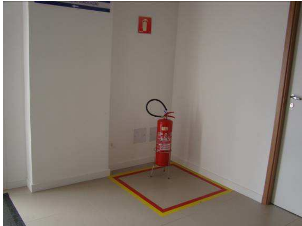
Detalhes de extintor de pó químico com demarcação de piso e placa de sinalização.