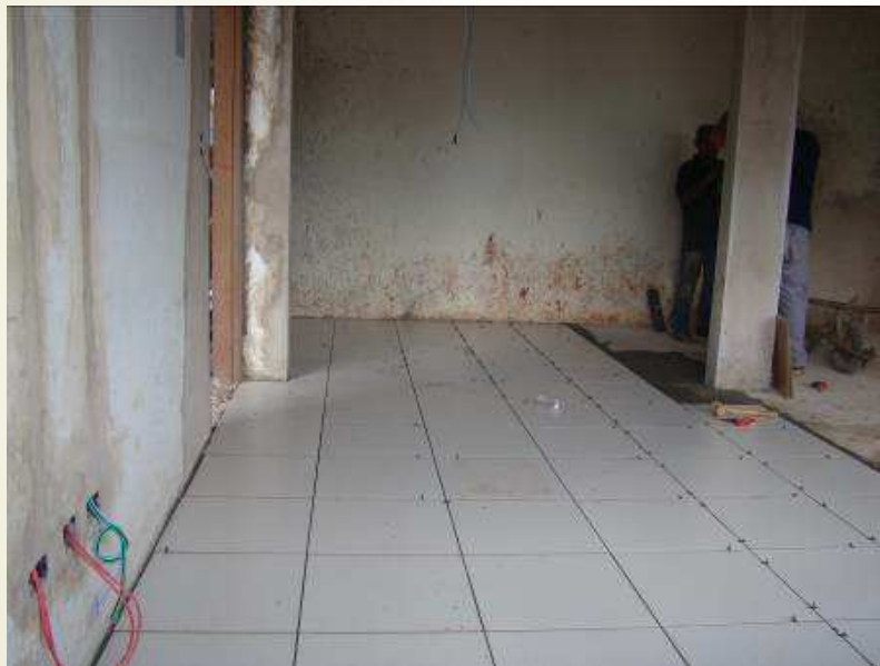
Detalhe da sala da OAB com o piso sendo instalado.