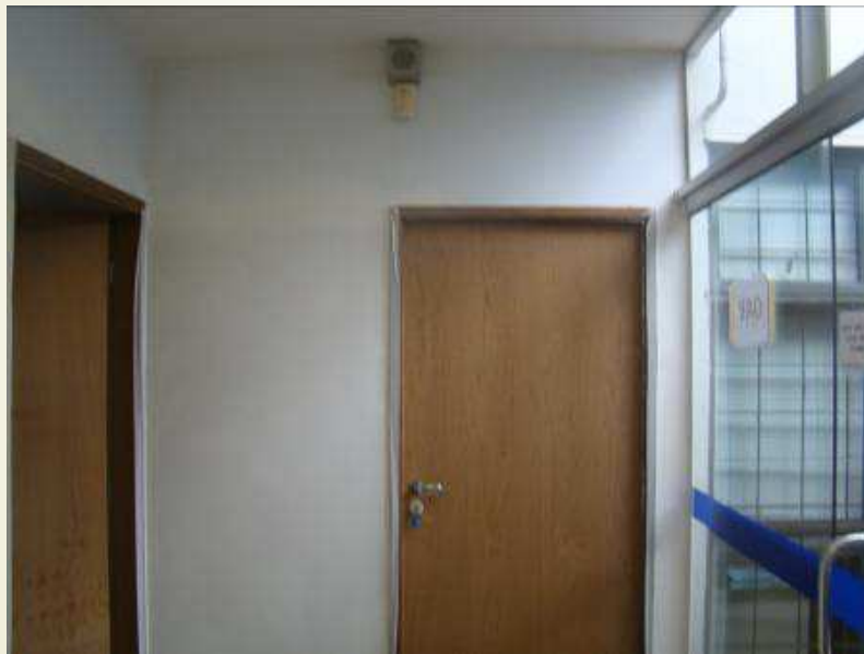
Detalhe da parede acabada da sala dos Juízes auxiliares com a porta instalada