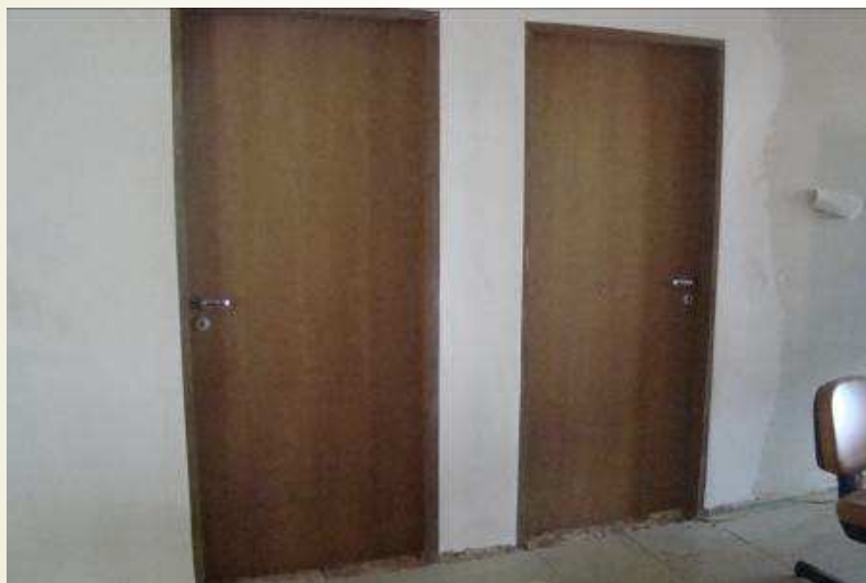
Detalhe das portas instaladas e da parede acabada das novas salas de audiência