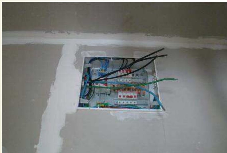
Detalhe do quadro de energia na sala da Secretaria do Foro.