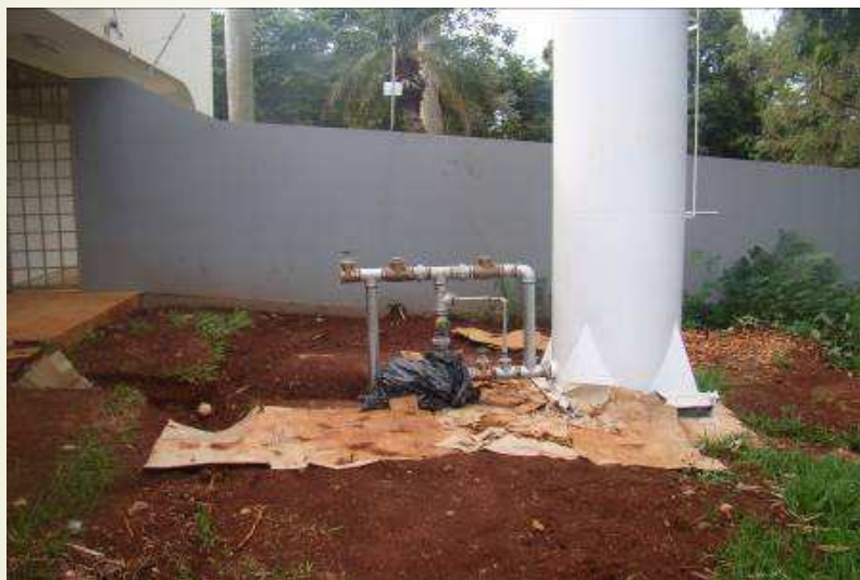
Detalhe da caixa d'água instalada com o barrilete