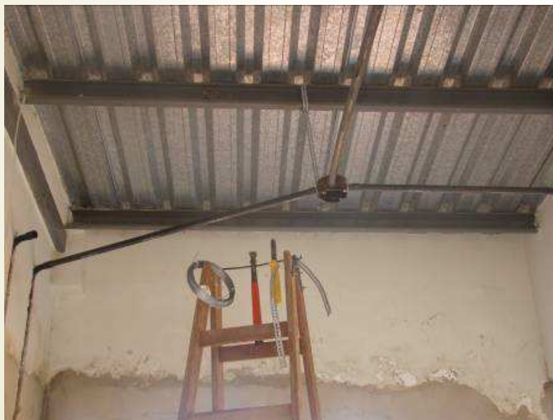
Detalhe da telha trapezoidal