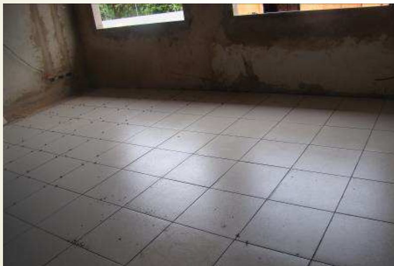
Detalhe do piso cerâmico padrão médio