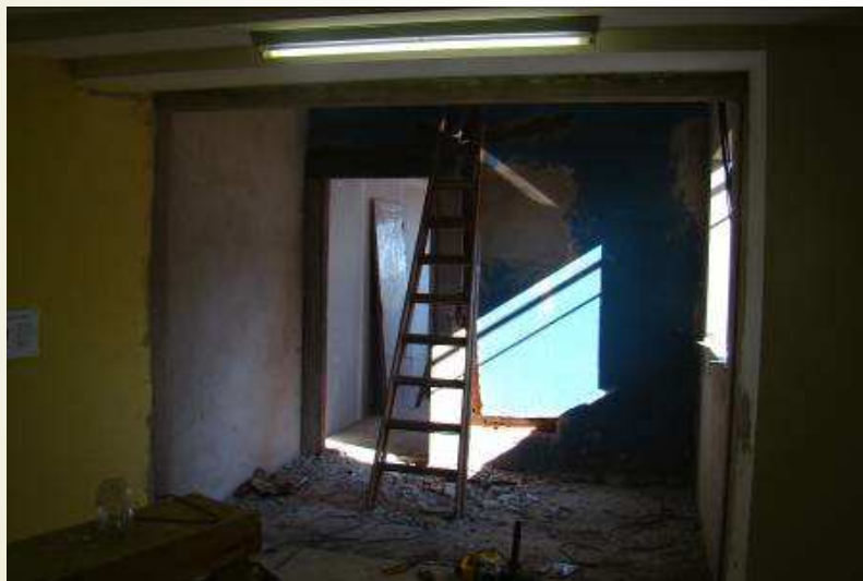
Detalhe do requadro para vãos de esquadrias