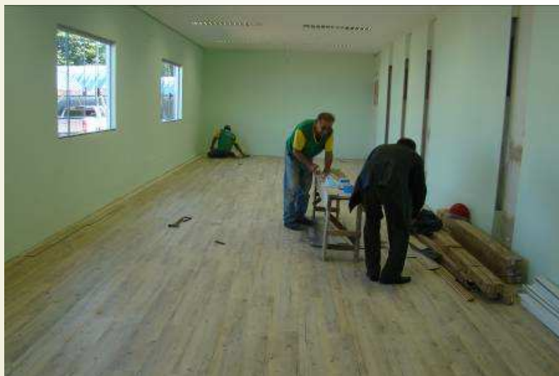
Detalhe da pintura látex acrílica interna sem selador e teto com pintura PVA