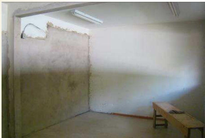
Detalhe da parede chapiscada e emboçada