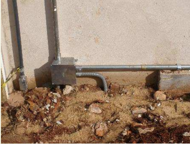
Detalhe da infraestrutura externa da segurança institucional