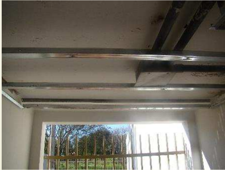
Detalhe da estrutura do forro de gesso na Central de Atendimento ao Cidadão