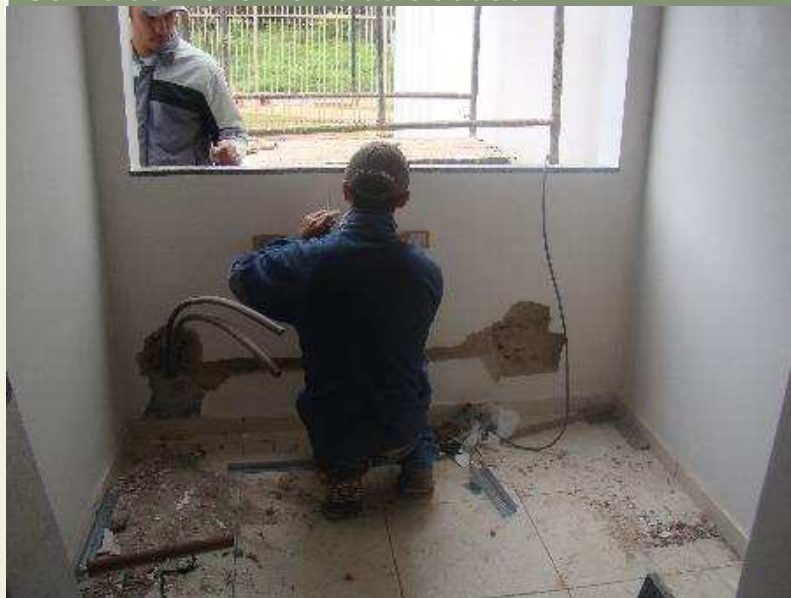
Detalhe da criação da infraestrutura elétrica do Centro de Atendimento ao cidadão