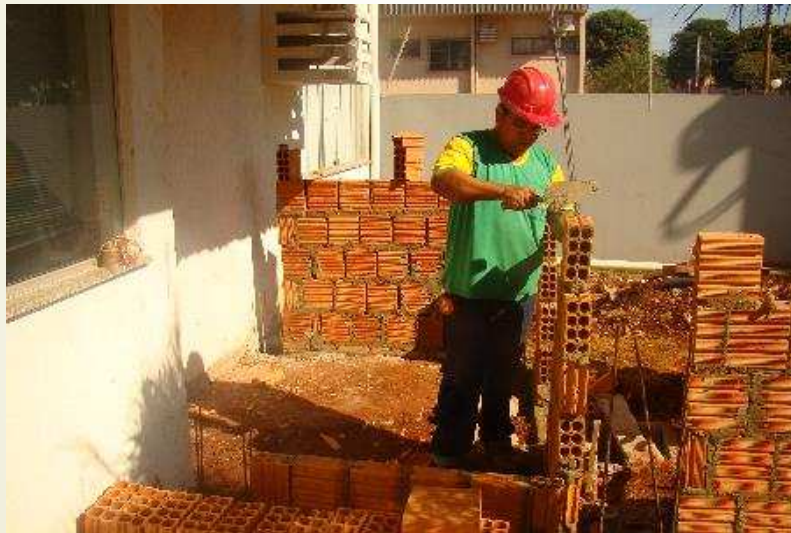
Detalhe da alvenaria de vedação da central de atendimento ao cidadão