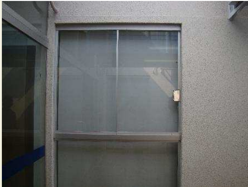
Detalhe da esquadria adaptada para dar condições de passagem à infraestrutura da climatização