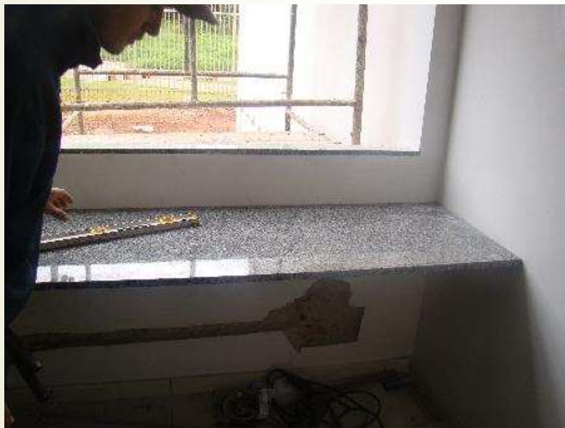
Detalhe da instalação da bancada de atendimento