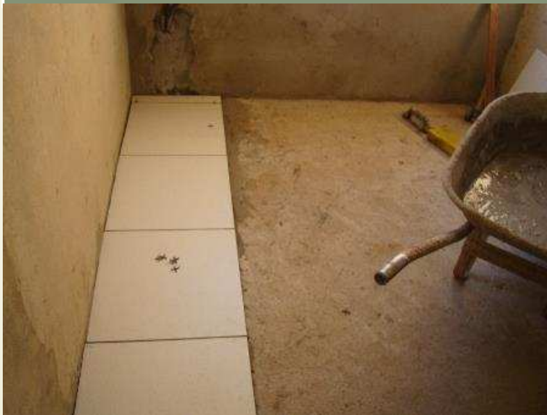
Detalhe da instalação do piso na Central de Atendimento ao Cidadão