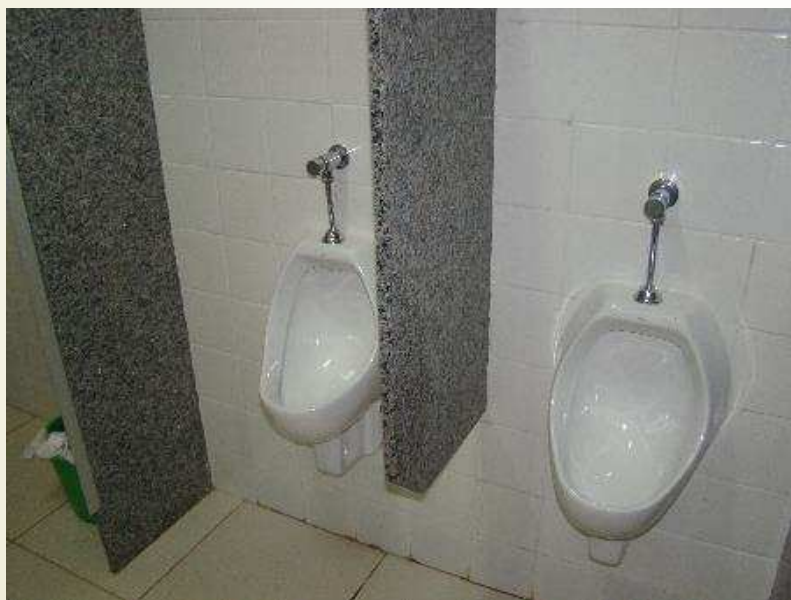
Detalhe das divisórias de granito dos banheiros