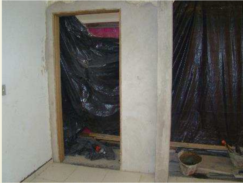
Detalhe do assentamento do batente e de requadramento na portaria