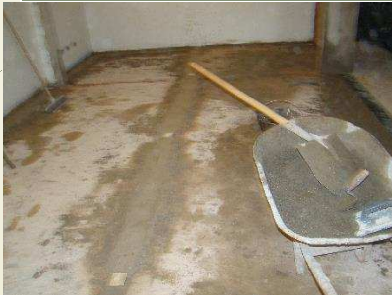
Detalhe da preparação para a instalação do piso na portaria