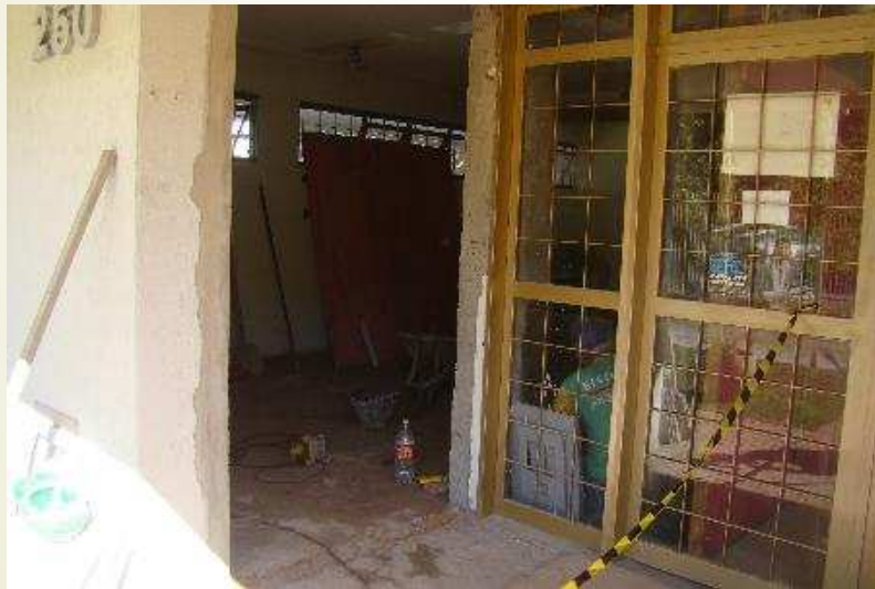
Detalhe da retirada de esquadrias na futura portaria