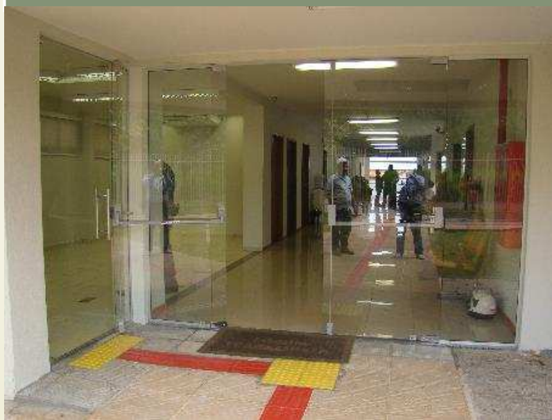
Detalhe da porta de saída de emergência