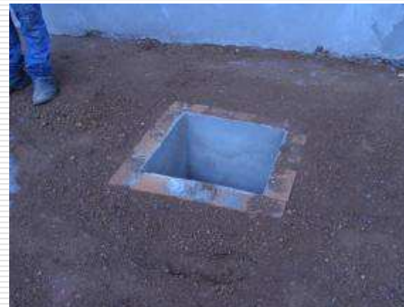
Detalhe da instalação de água fria, cx de águas pluviais e esgoto