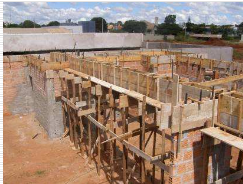
Detalhe da concretagem, formas e ferragens da estrutura do prédio