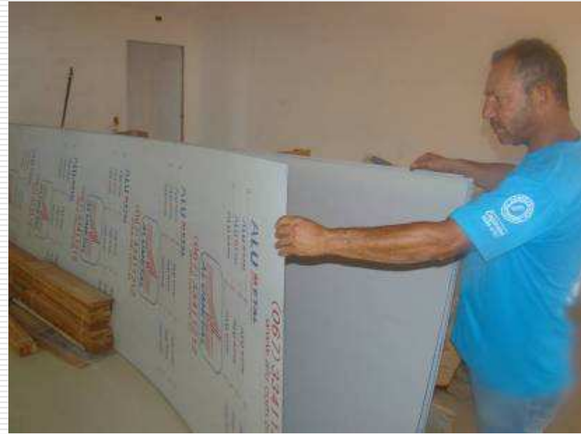
Detalhe da bancada da copa e do alumínio composto da fachada (aditivo)