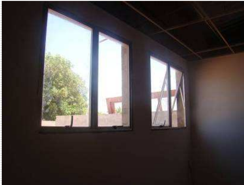
Detalhe das esquadrias de alumínio com vidro (maxim-ar)