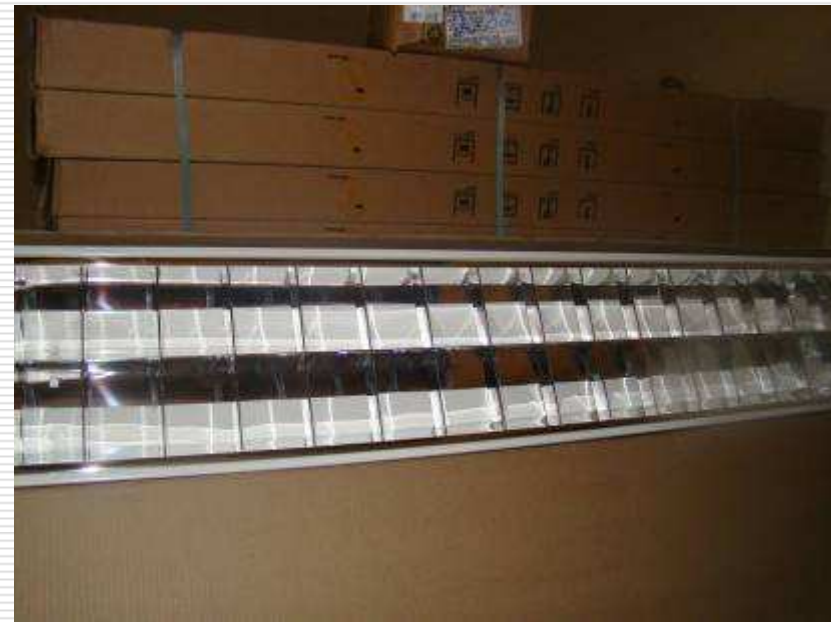
Detalhe das luminárias