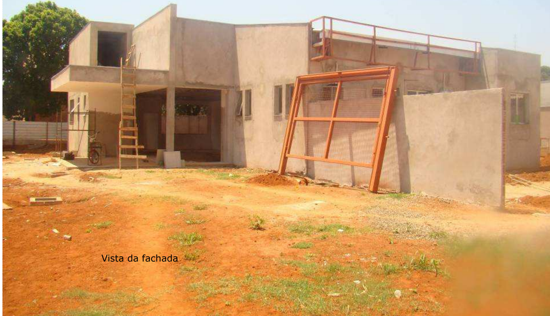
Vista da fachada