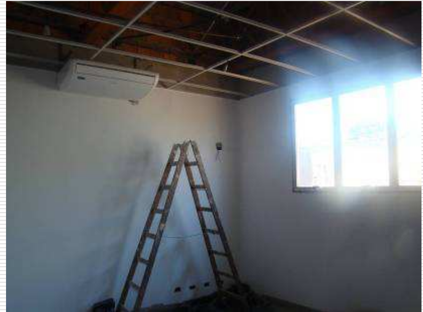
Detalhe dos splits - Gabinete e sala da Assessoria