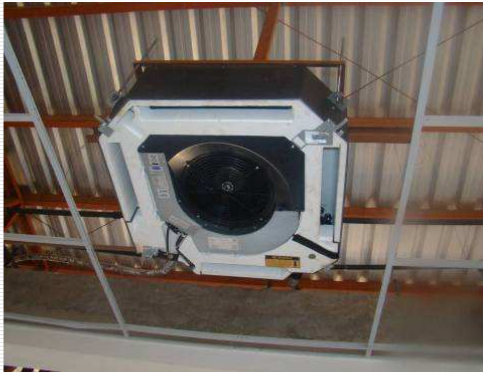
Detalhe da aparelho cassete instalado