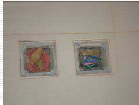
Detalhe dos quadros de iluminação, motores e tomadas de piso de lógica e elétrica