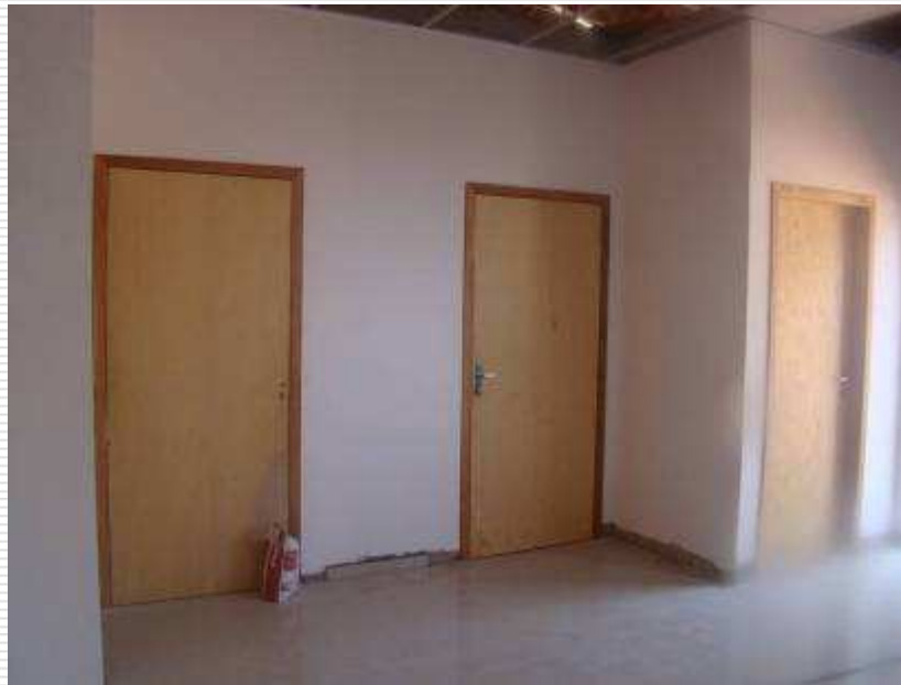
Detalhe das esquadrias de madeira instaladas