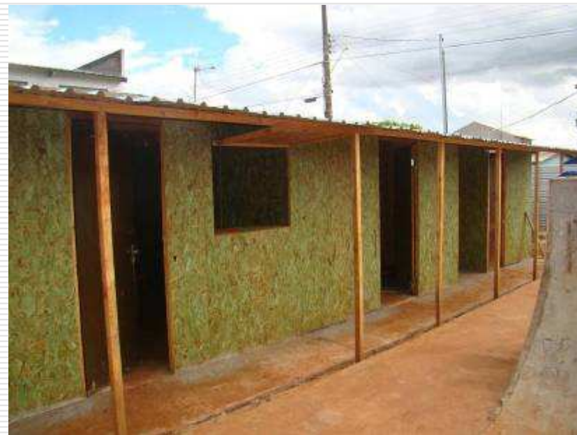
Detalhe do bate estaca e do barracão de obra