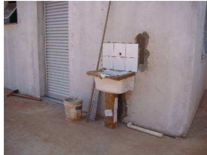
Detalhe do tanque