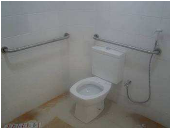
Detalhe da bacia sanitária, ducha higiênica e barras de apoios