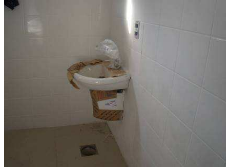
Detalhe da bancada da copa, porta de alumínio e do lavatório com torneira