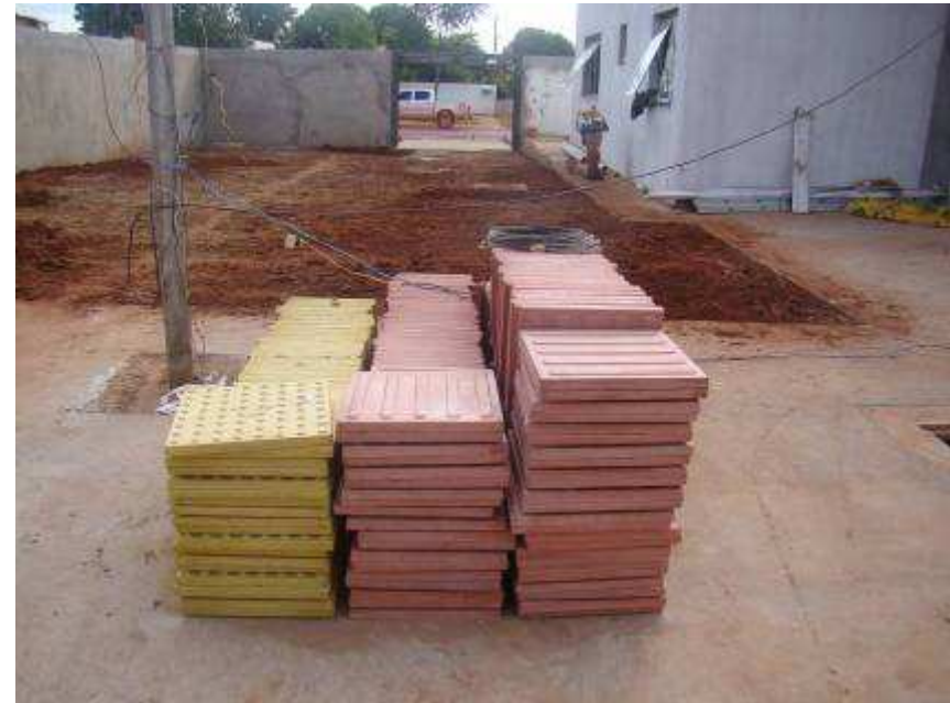
Detalhes do ladrilho hidráulico e do piso tátil depositado na obra.