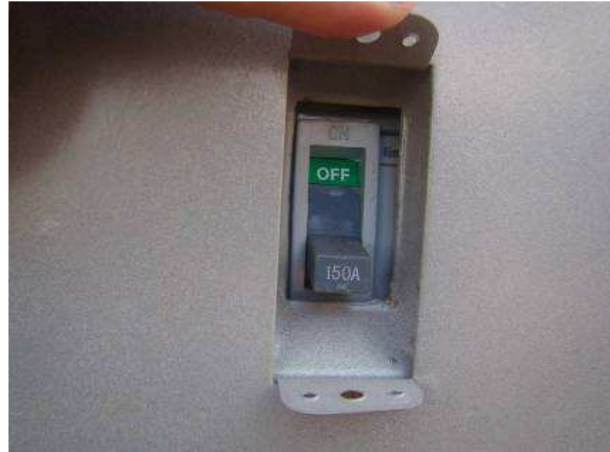
Detalhes do padrão de entrada de energia e do disjuntor geral (150 A)