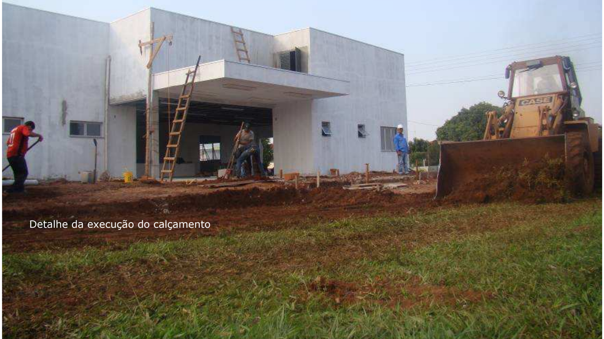
Detalhe da execução do calçamento