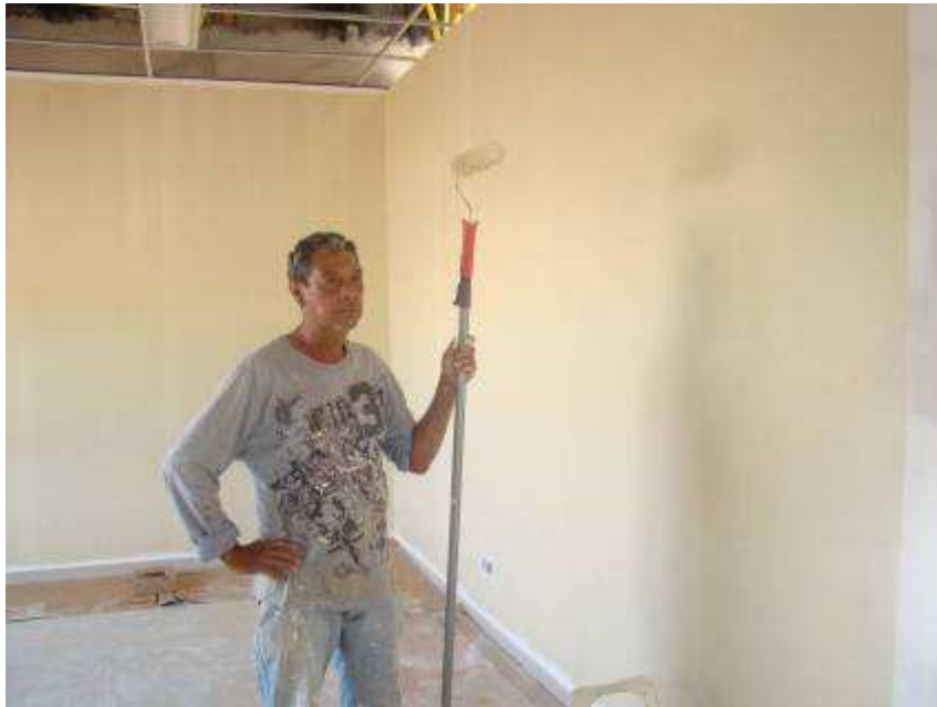
Detalhe da pintura interna (bege)