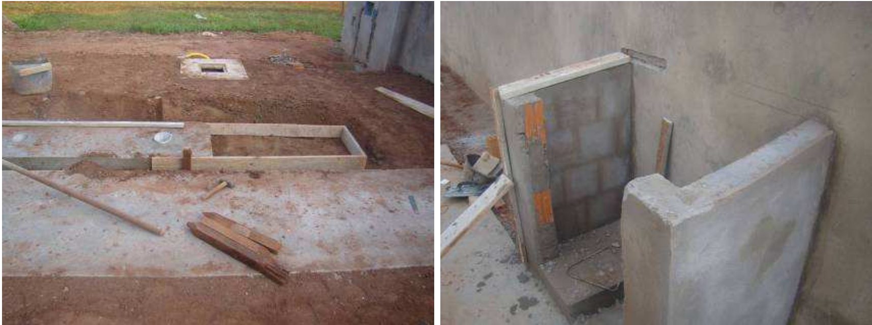
Detalhes do porta bandeira sendo ampliado (mercosul) e do abrigo de gás.