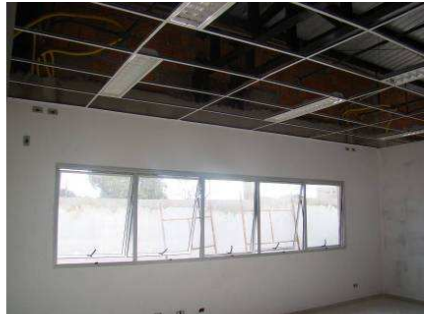
Detalhe da estrutura do forro mineral, luminárias, esquadrias de alumínio com vidro e fechamento da tesoura