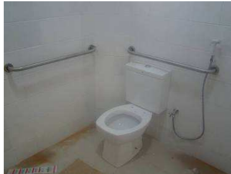
Detalhe das louças adaptada para PNE