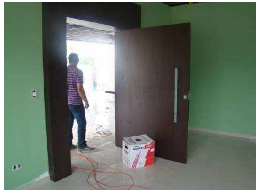
Detalhe da porta dos banheiros e da porta da sala de audiência