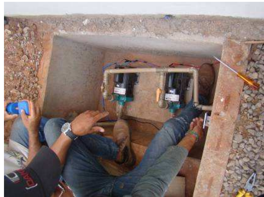
Detalhe do abrigo de gás e da casa de bombas