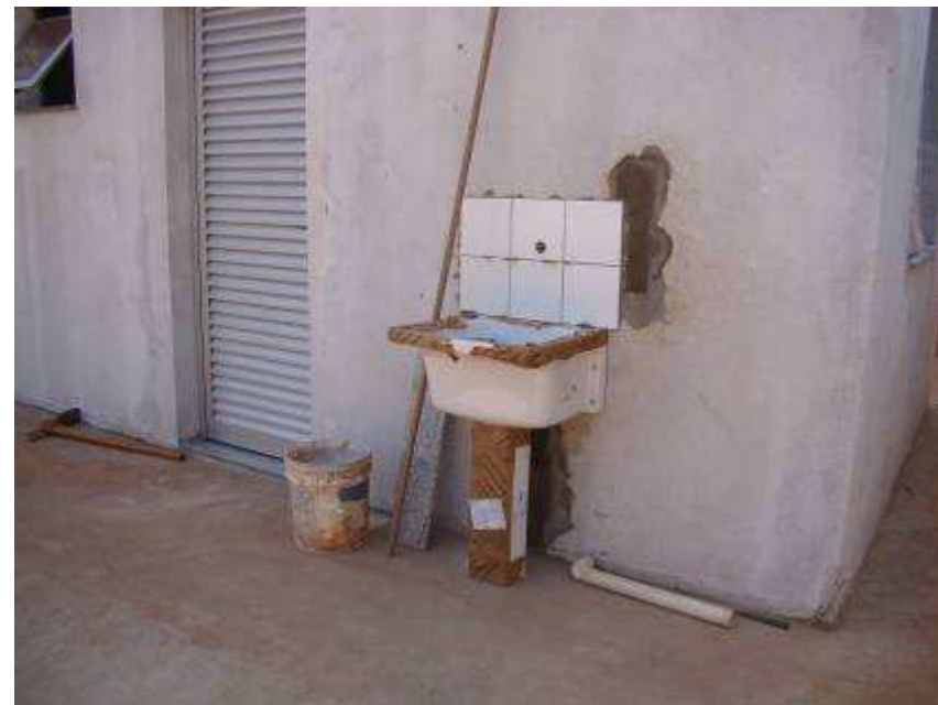
Detalhes da pintura externa e tanque em louça