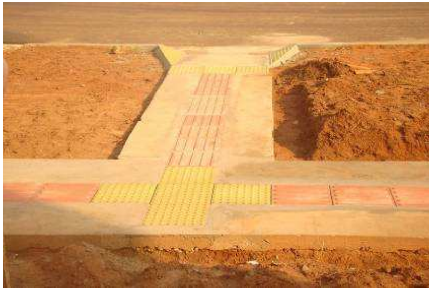
Detalhe do piso tátil e do ladrilho hidráulico