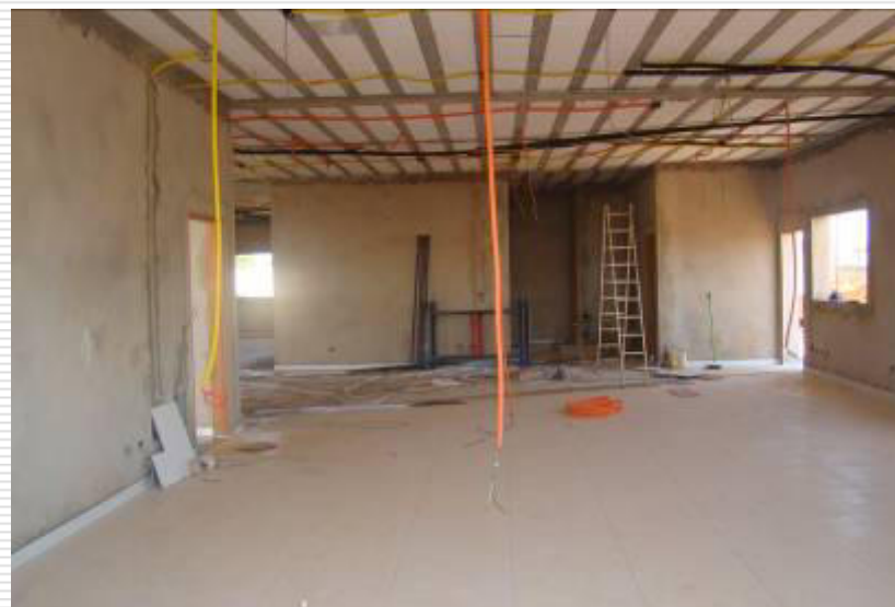
Detalhe do piso cerâmico e do rodapé em cerâmica instalados em todo o ambiente interno da construção