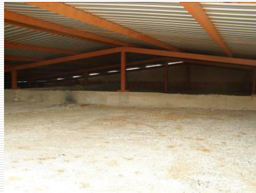
Estrutura metálica e telhas de zinco instaladas desde o mês de agosto/2013