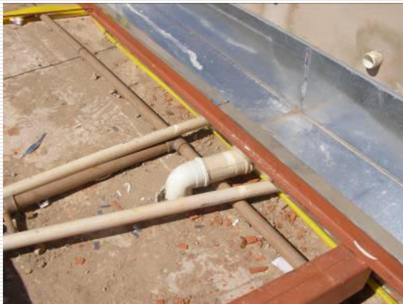
Detalhe da calha do telhado instalada desde o mês de agosto/2013