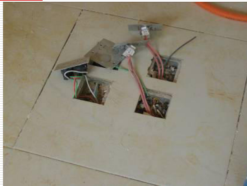
Fios elétricos das tomadas no piso