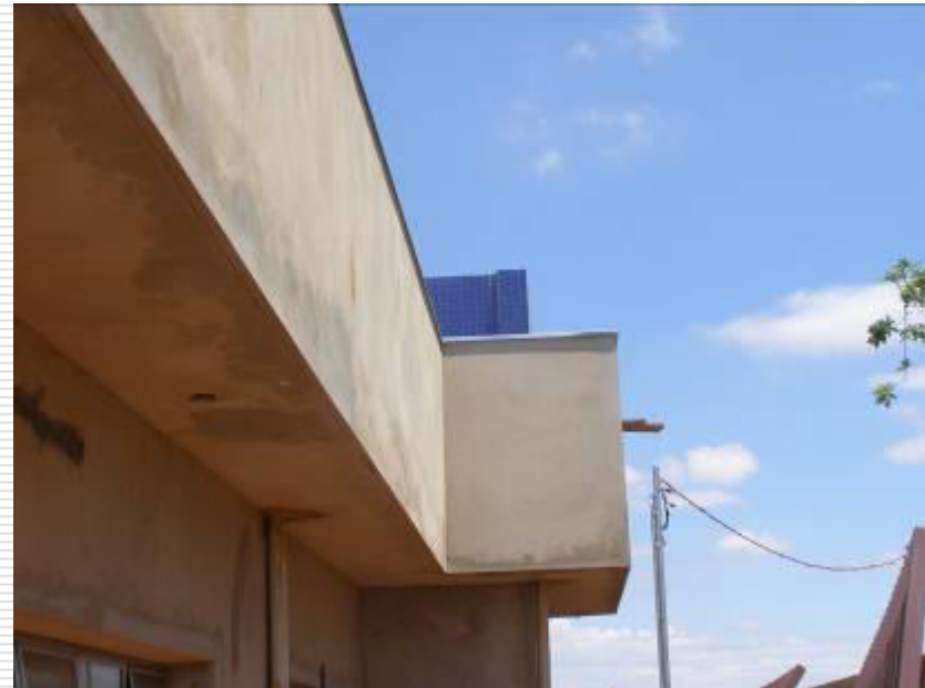
Detalhe da proteção de zinco dobrada sobre as paredes de alvenaria externa a fim de evitar infiltração de águas das chuvas e não ocorrer umidades (rufo)