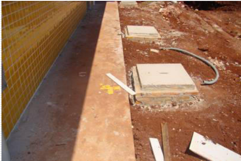
Detalhe das tampas caixas de passagem