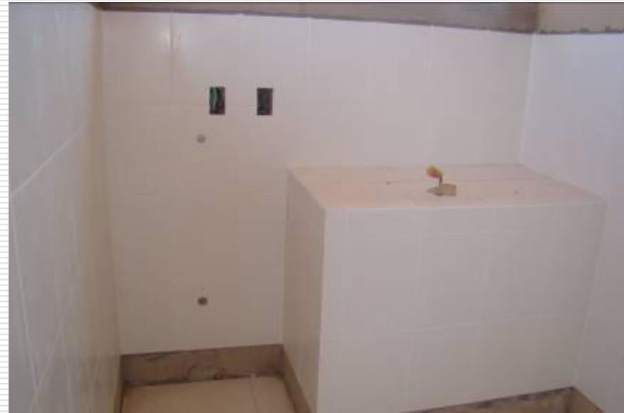
Paredes da lavanderia com o revestimento cerâmico instalado e rejuntado