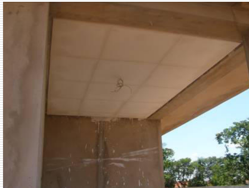
Detalhe do forro de gesso instalado sob a laje da área de serviço