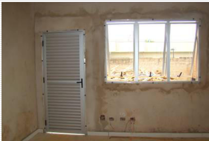
Esquadrias metálicas (portas e janelas) instaladas