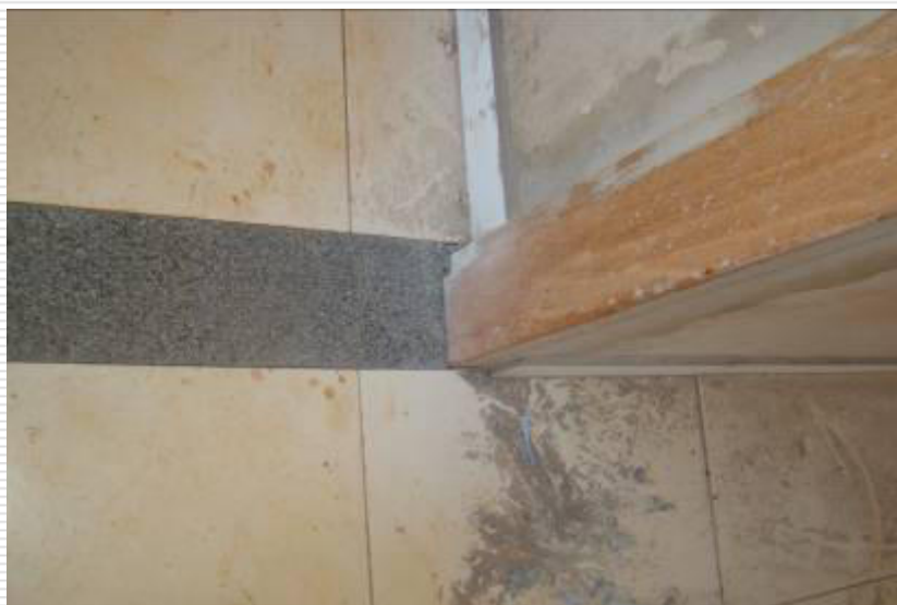
Detalhe da soleira de granito instalada no piso cerâmico