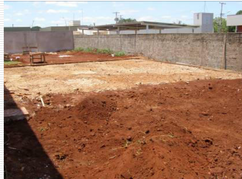
Movimentação de terra e preparação do terreno do estacionamento interno para concretagem