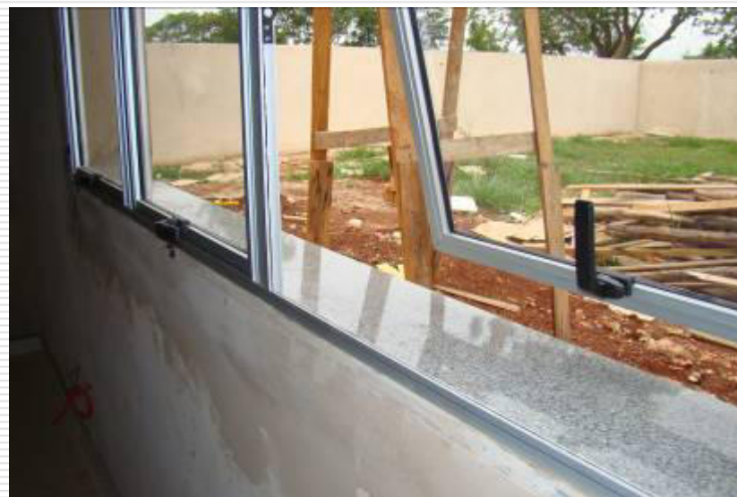
Detalhe da janela metálica de alumínio escovado e do peitoril de granito.