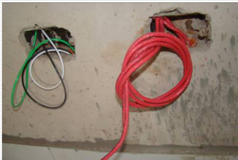
Fios elétricos das tomadas nas paredes