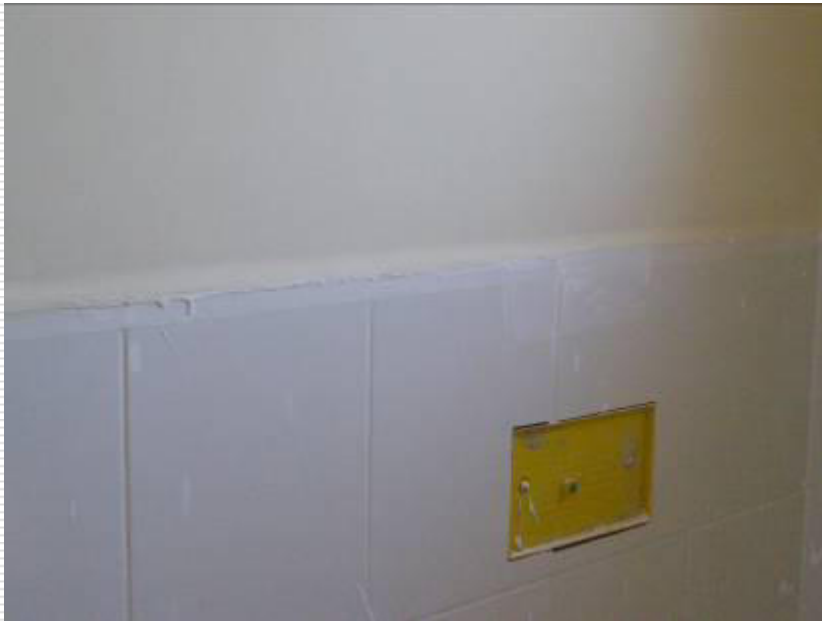
Paredes dos banheiros com o revestimento cerâmico instalado e rejuntado