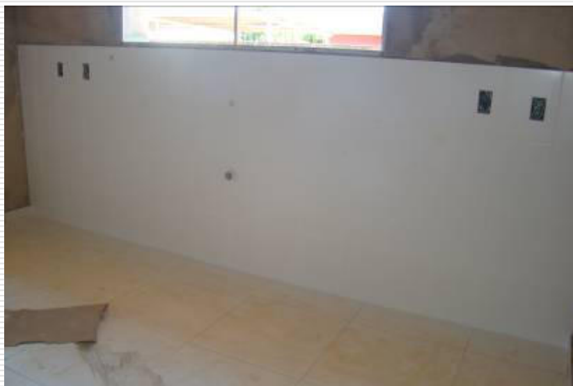
Parede da copa com o revestimento cerâmico instalado e rejuntado