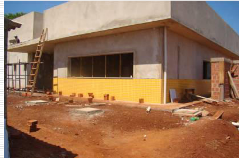
À esquerda, detalhe das tampas da fossa séptica e do sumidouro. À direita, tampa da caixa de passagem de esgoto que descarrega na fossa séptica