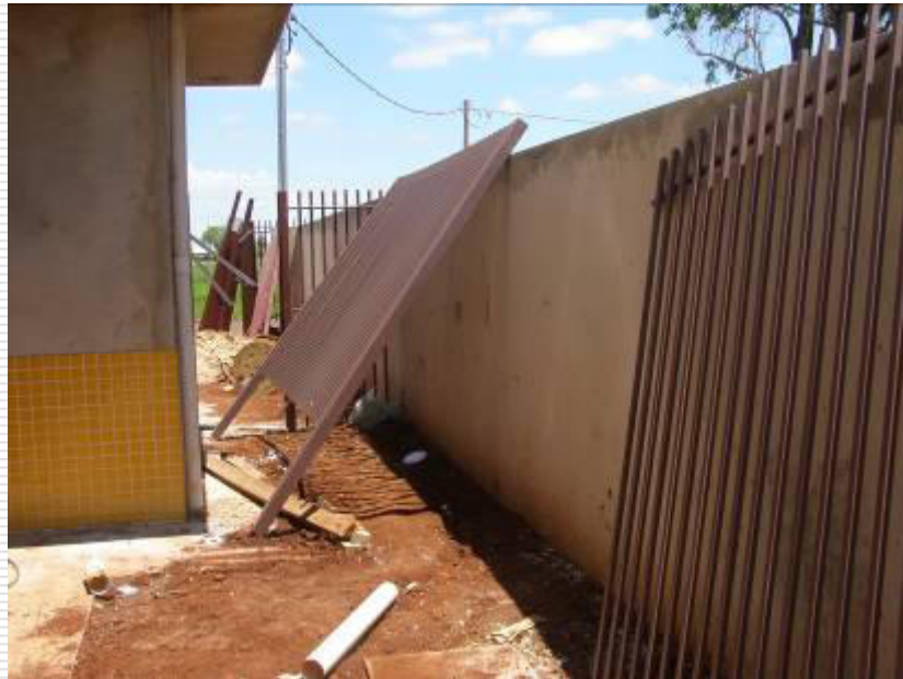
Detalhe de uma das partes do gradil da fachada pronto para ser instalado