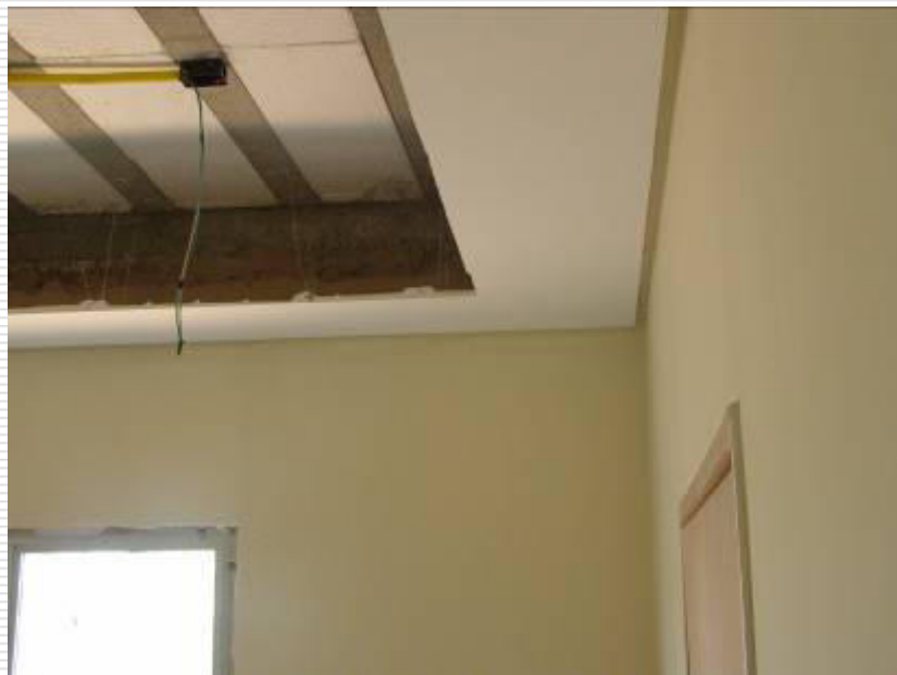
Instalação do forro de gesso no ambiente interno da construção