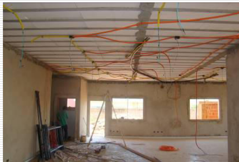
Detalhe do cabeamento e infra estrutura elétrica das luminárias e do ar condicionado instalados