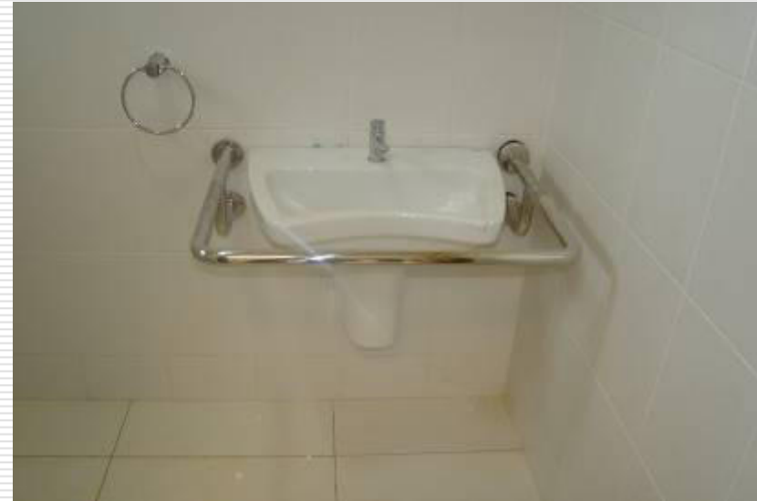
Louças e metais instalados nos banheiros