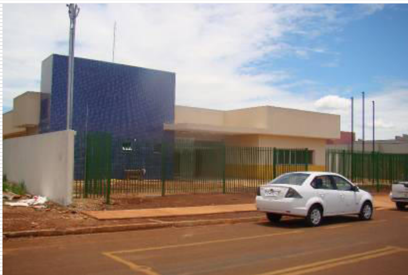
Vista panorâmica da fachada

Prazo prorrogado para 09 de janeiro de 2014