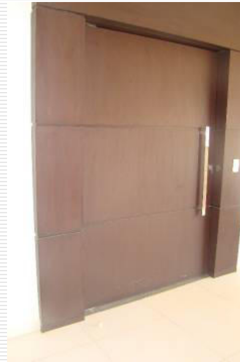
Porta pivotante de acesso à sala de audiências