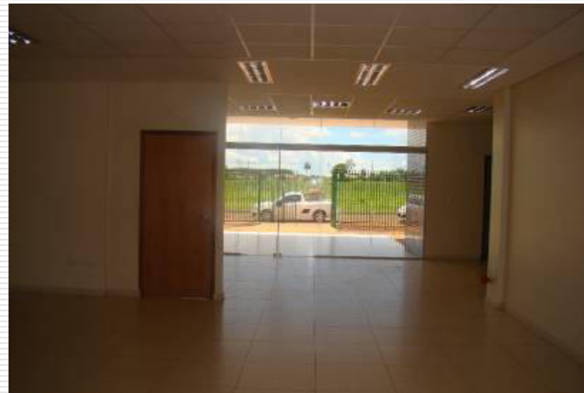
Vista panorâmica da área interna