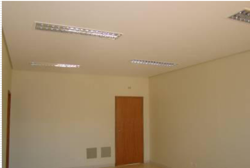
Área interna do espaço cidadão.

Prazo prorrogado para 09 de janeiro de 2014