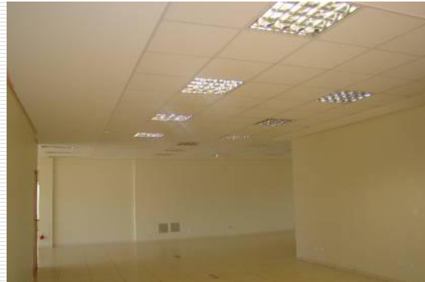
Sala da secretaria da vara. Acabamento em porcelanato, luminárias de alumínio, forro mineral e pintura látex