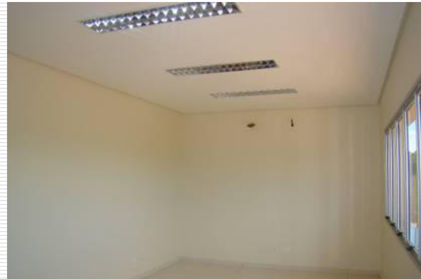
Detalhe da sala de arquivo. Ponto de instalação de ar condicionado, forro de gesso e luminárias de alumínio