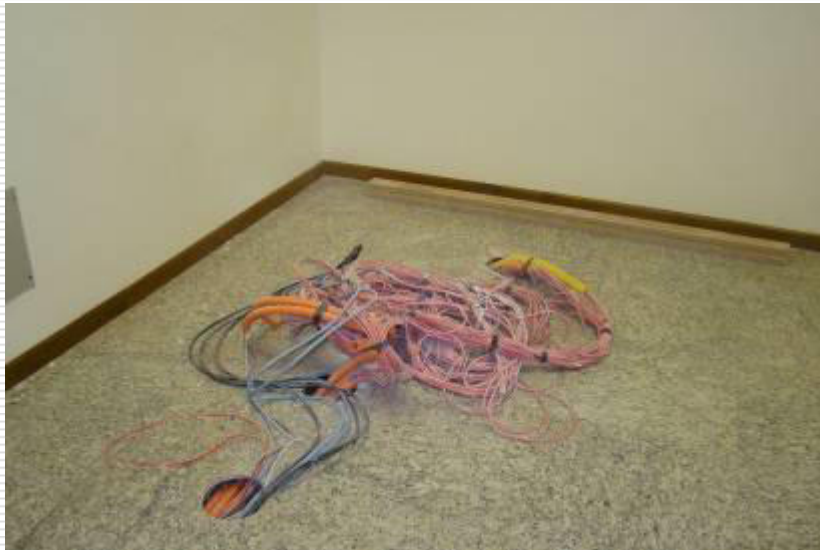
Interior da sala técnica. Piso elevado para facilitar o acesso e manutenção da parte elétrica e lógica da vara

Prazo prorrogado para 09 de janeiro de 2014