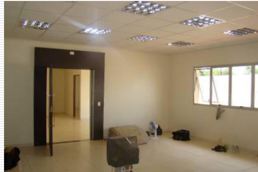
Interior da sala de audiências