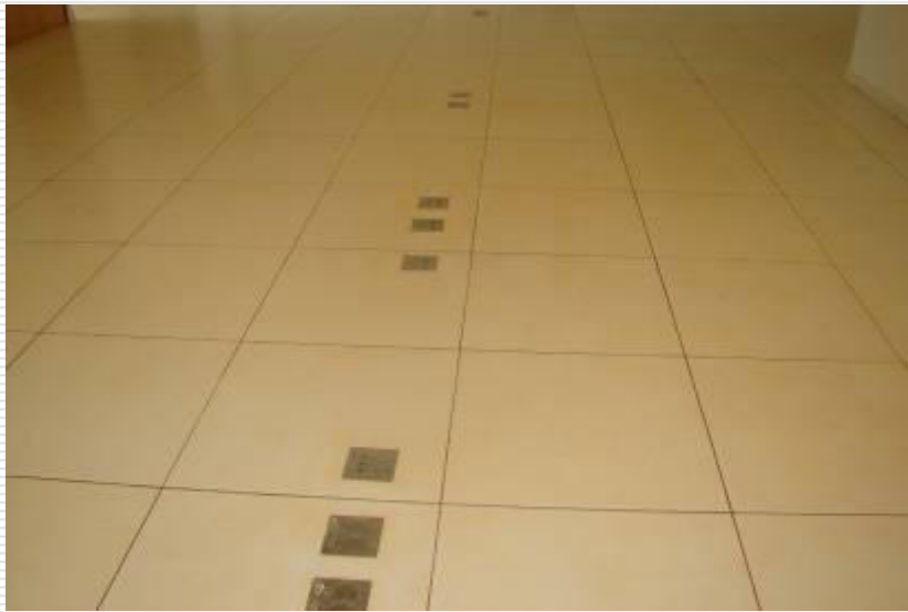
Pontos de tomadas e lógica instalados no piso porcelanato

Prazo prorrogado para 09 de janeiro de 2014