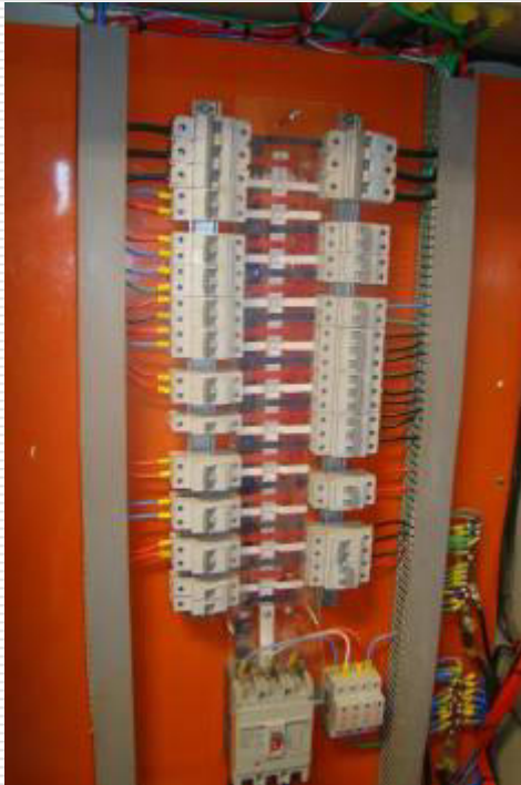
Quadros de distribuição, disjuntores e cabeamento estruturado instalados

Prazo prorrogado para 09 de janeiro de 2014