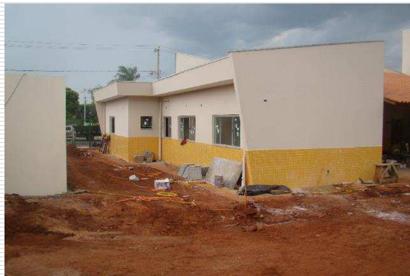
Detalhe dos vidros das janelas