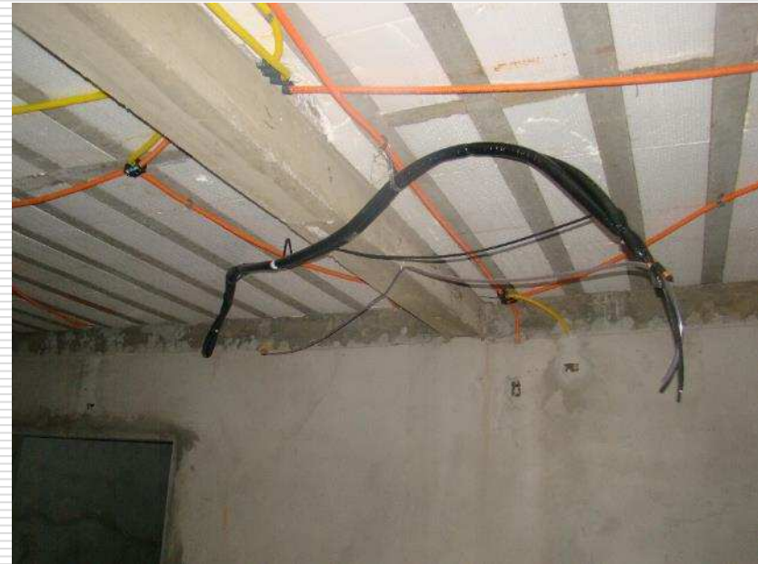
Infraestrutura para ar condicionado