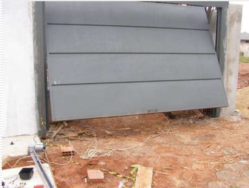
Detalhe do portão de elevação