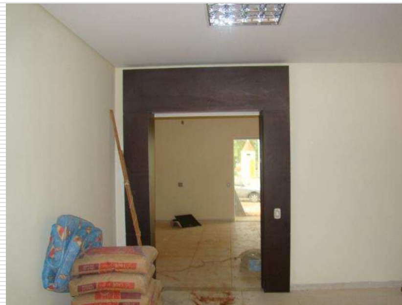
Detalhe das esquadrias de madeira