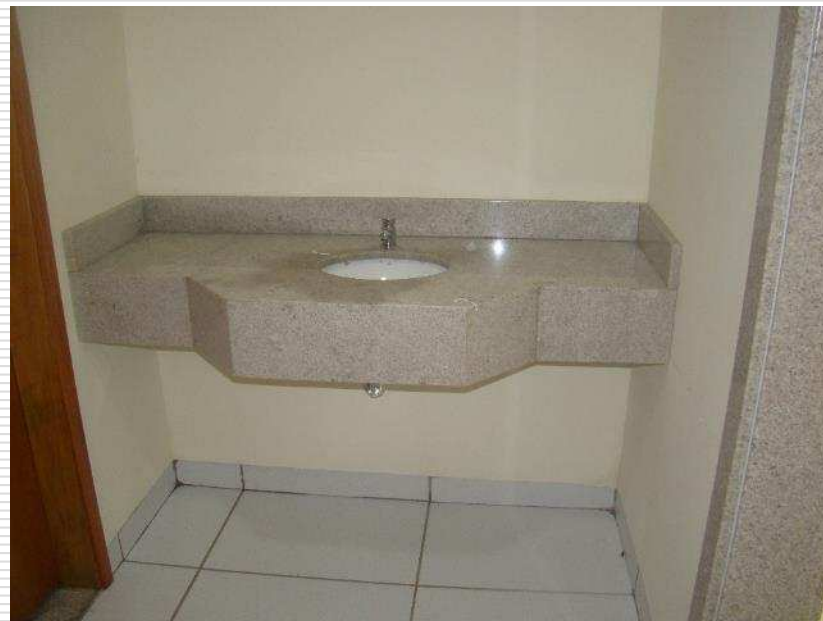
Louças e metais nos banheiros