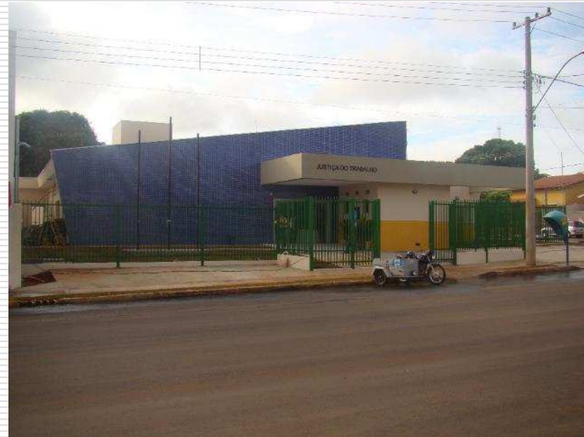
Detalhe dos mastros e gradil