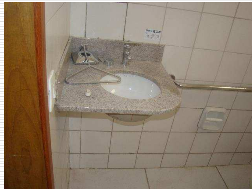
Bancadas dos banheiros em granito