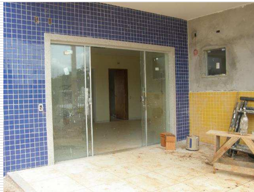
Detalhe dos pisos cerâmicos com soleiras de granito