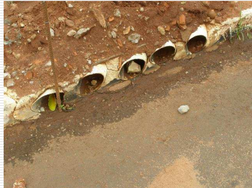
Tubulação de águas pluviais