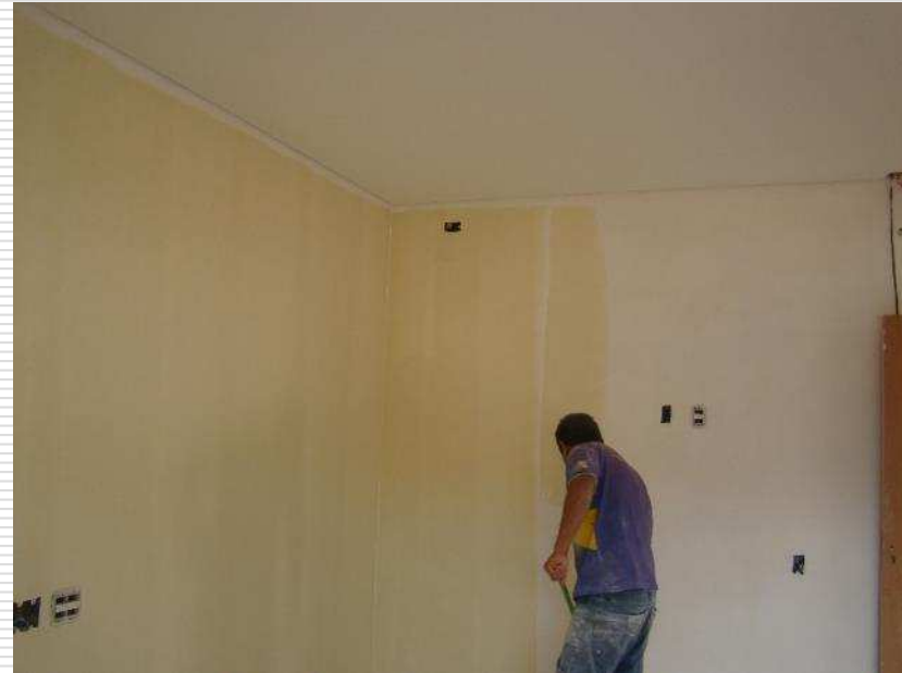
Parede divisória de gesso acartonado