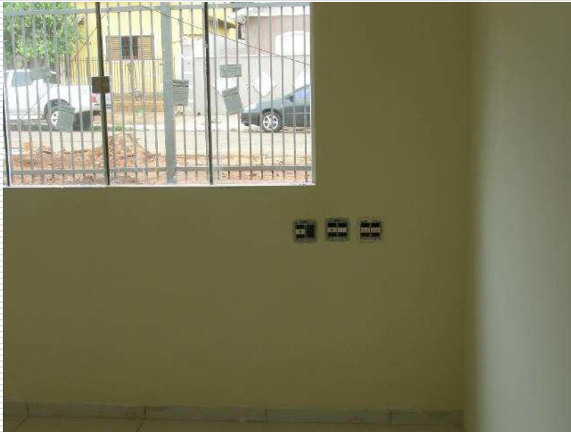
Detalhe das tomadas RJ45 CAT6 e tomadas de energia elétrica