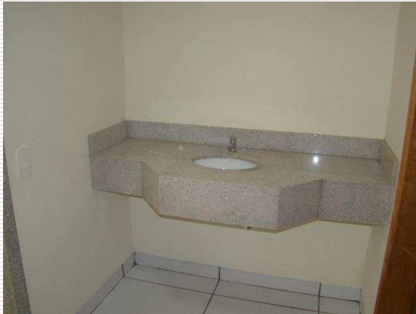
Detalhe da bancada de granito dos banheiros dos servidores