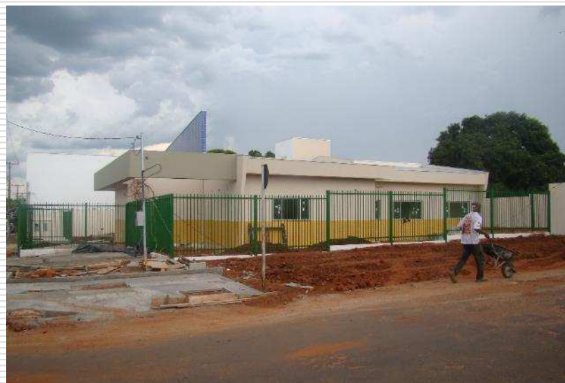
Detalhe da pintura externa