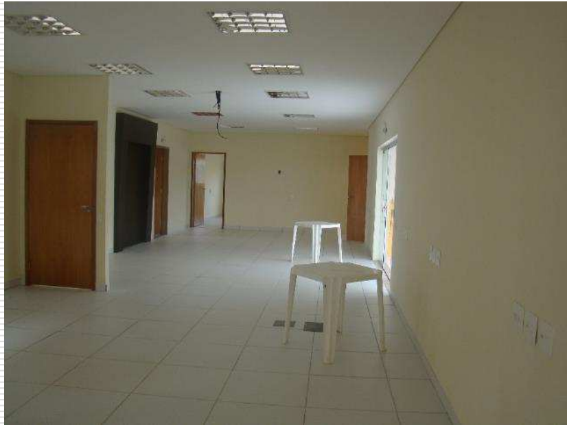
Detalhe da pintura interna