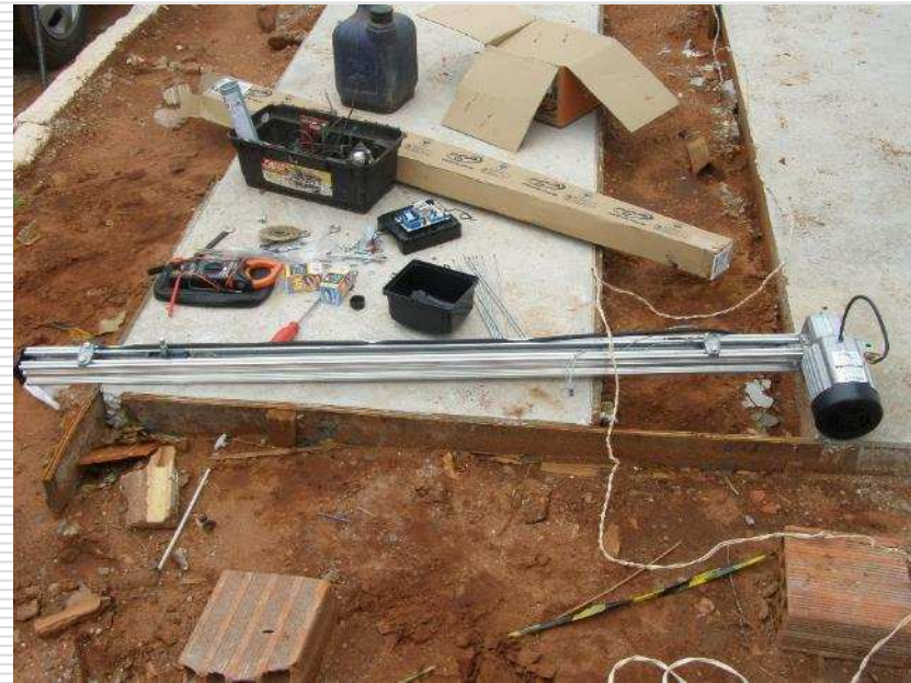
Motor do portão de elevação. Antes da instalação