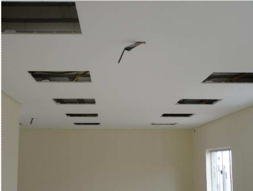
Detalhe do forro de gesso com junta paulista