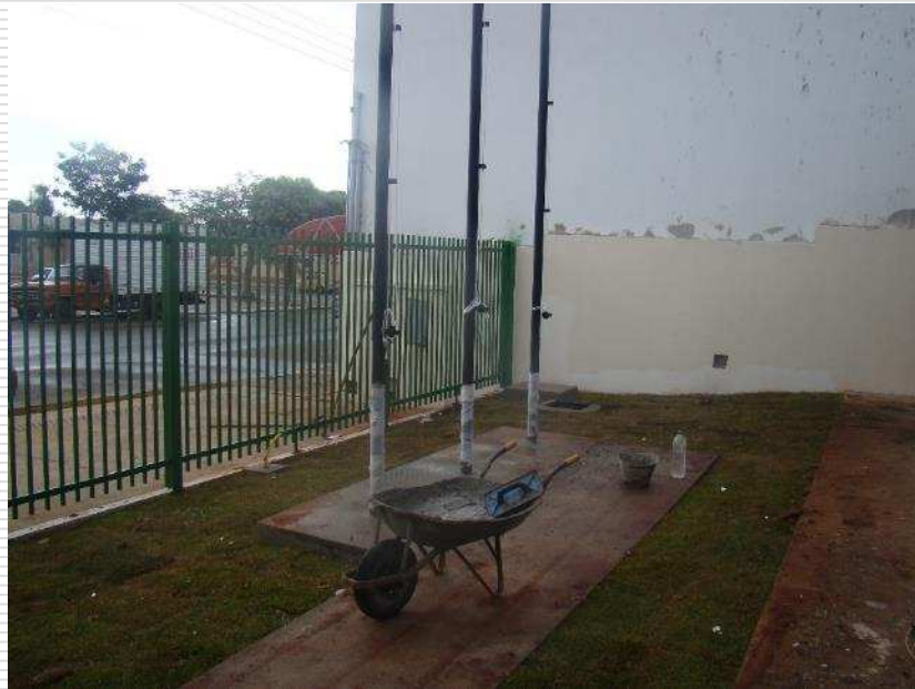
Detalhe dos mastros para bandeiras