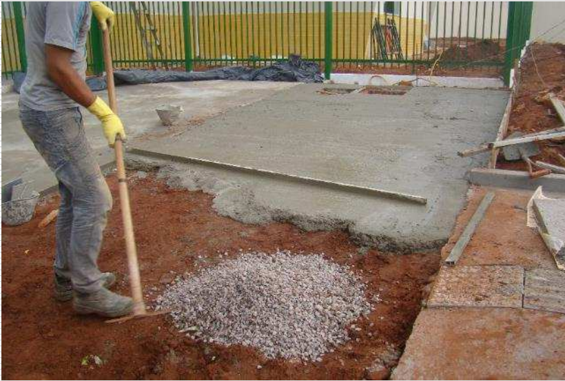
Detalhe do piso de concreto