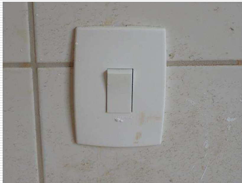
Detalhe das tomadas e interruptores