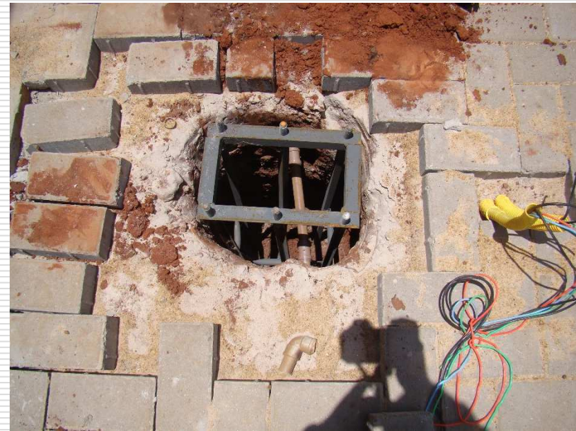
Detalhe da execução das funções dos sombreadores para veículos