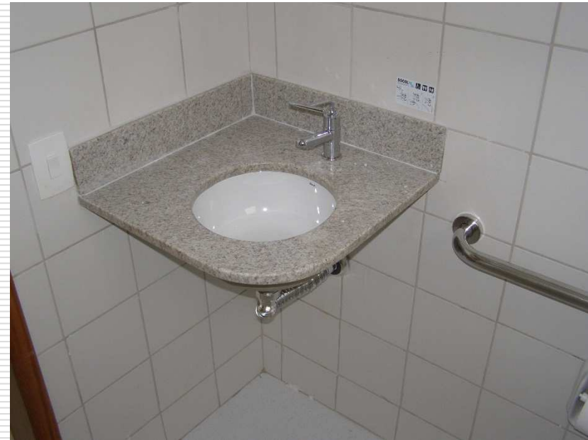
Torneira de fechamento automático para PNE