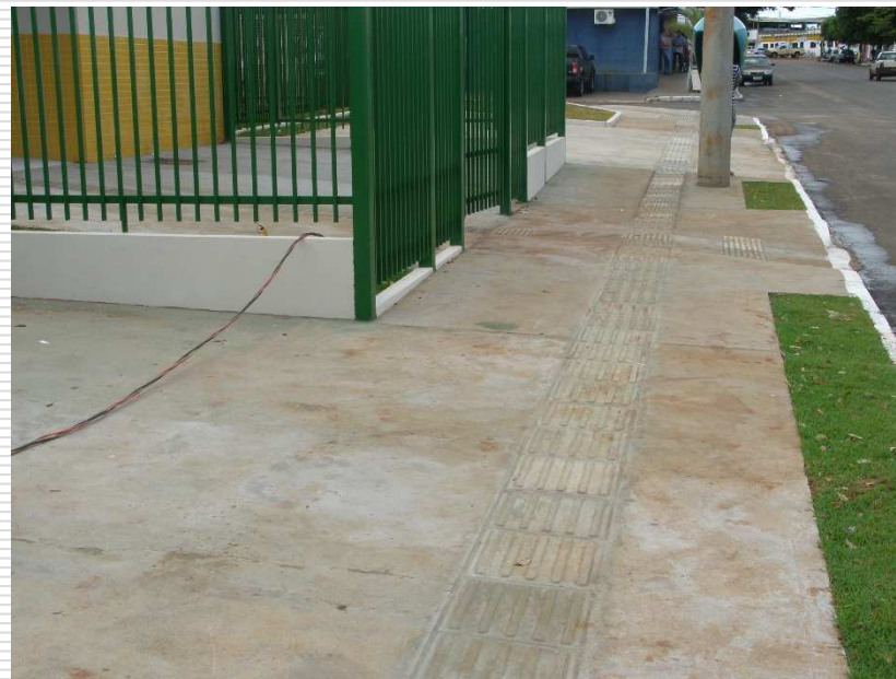
Piso tátil de concreto 40x40cm