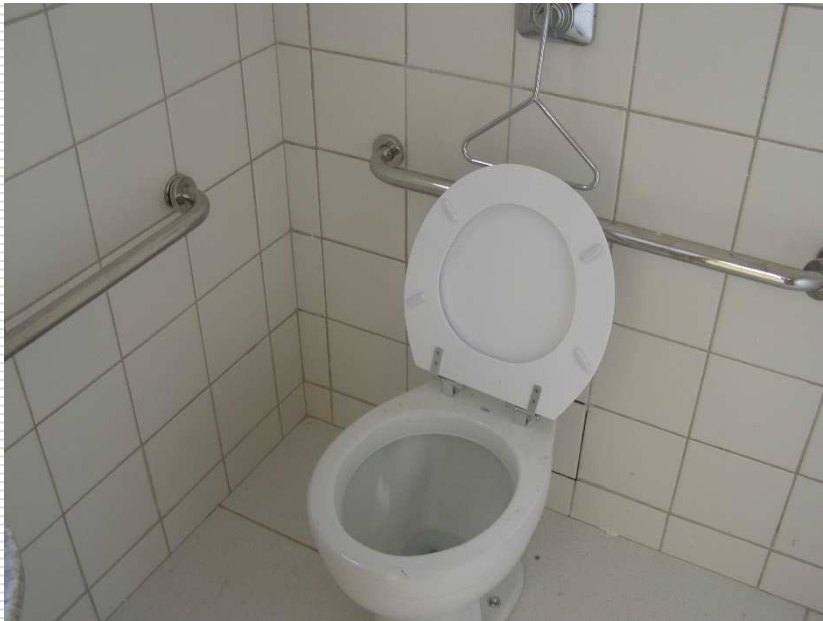
Acabamento de válvula de descarga com alavanca para PNE