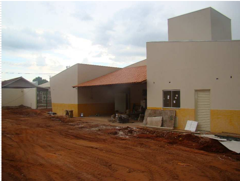
Detalhe da pintura externa com textura acrílica arranhada