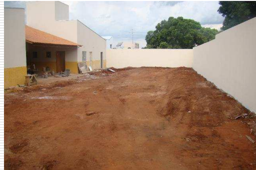
Detalhe da pintura dos muros com textura acrílica