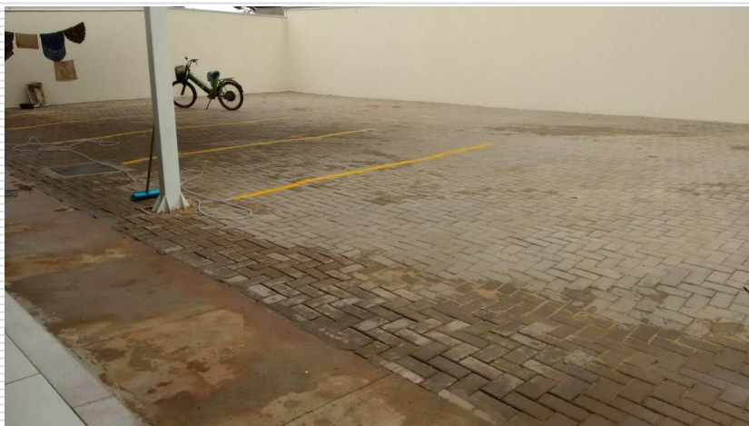
Detalhe da pintura para demarcação das vagas