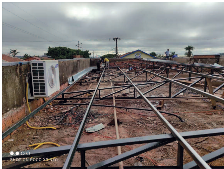
Detalhe do terçamento