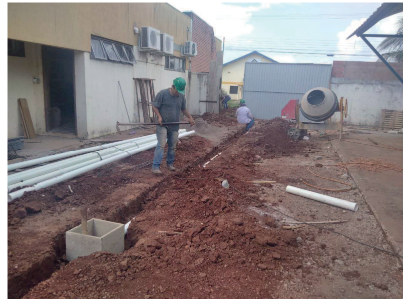
Detalhe da tubulação de drenagem do estacionamento e caixa de passagem