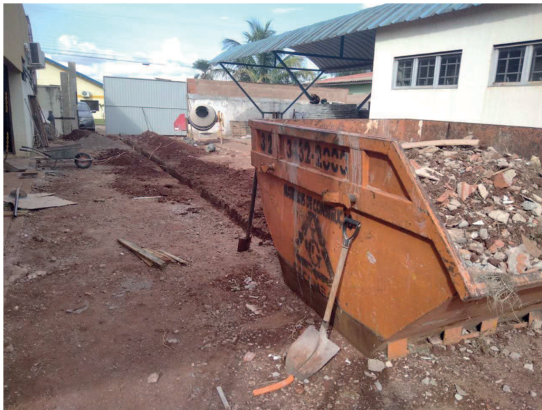
Detalhe de Caçamba cheia de entulho, pronta para o bota fora