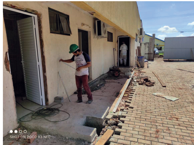
Detalhe das portas de alumínio