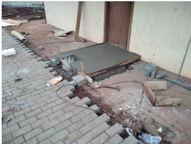
Detalhe da rampa da copa e do piso intertravado do acesso ao estacionamento