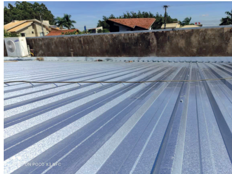
Detalhe das telhas