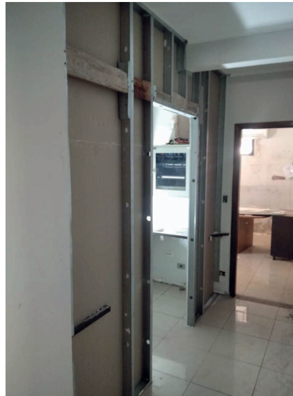
Detalhe da montagem da sala do servidor