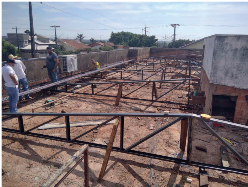
Finalização das tesouras e início do terçamento