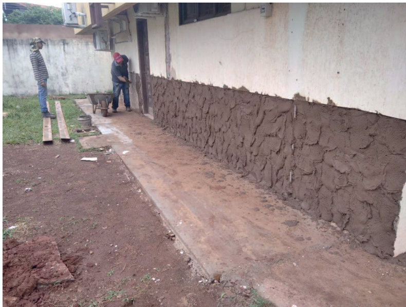
Detalhe do emboçamento com aditivo cristalizante