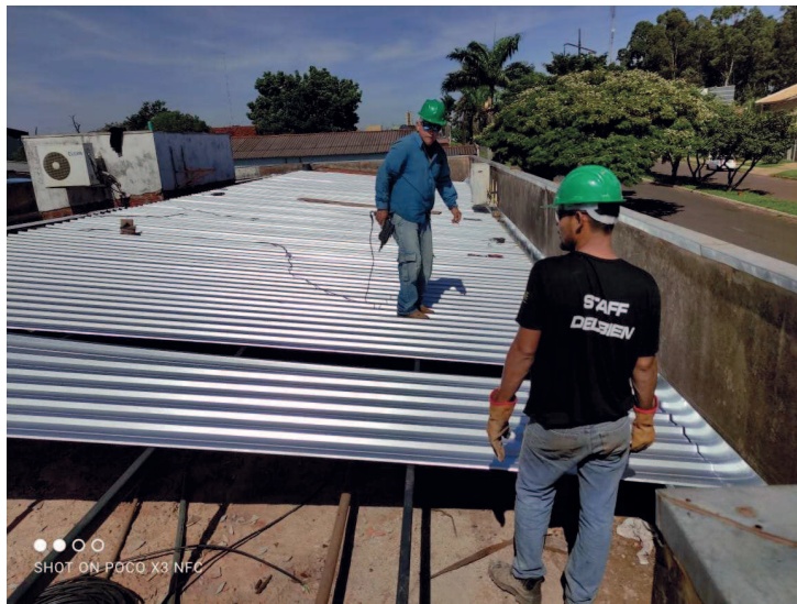
Detalhe do rufo