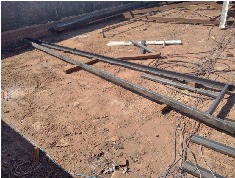
Início das montagens das tesouras