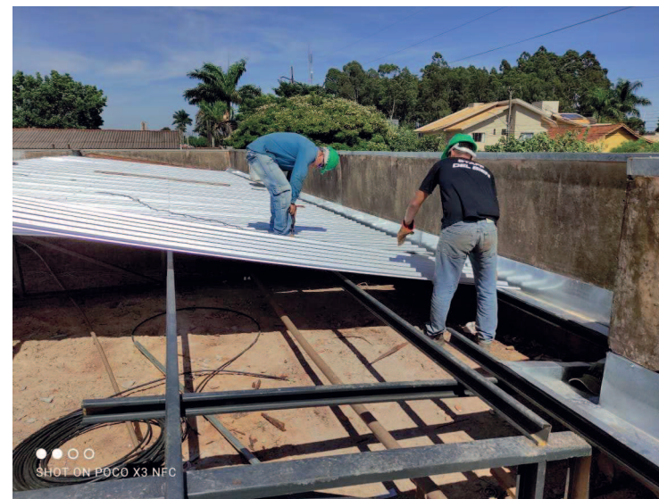
Detalhe das calhas