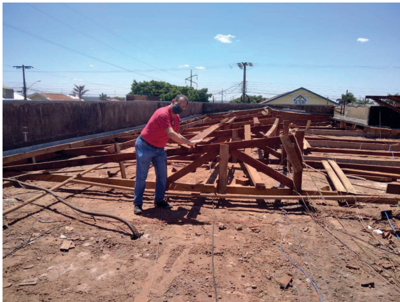
Retirada das telhas e do madeiramento, detalhe das vigas e tesouras empenadas.