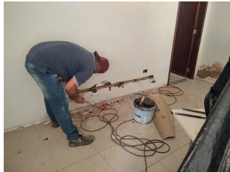
Detalhe da ampliação da oferta de tomadas