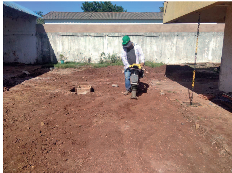
Detalhe da compactação do solo do estacionamento