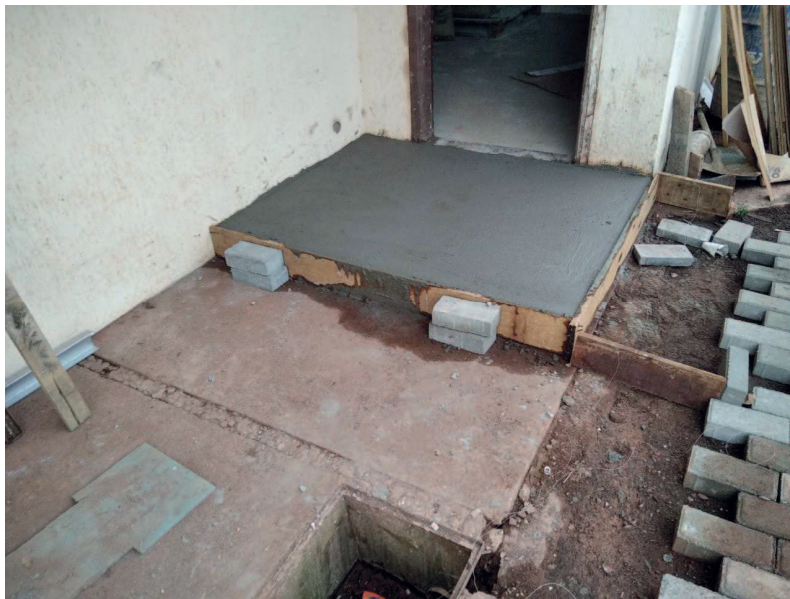
Detalhe da rampa da secretaria e do piso intertravado, ao fundo observa-se o muro ampliado e rebocado.