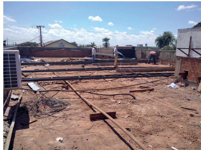
Pintura da estrutura com fundo antioxidação e início da montagem das tesouras