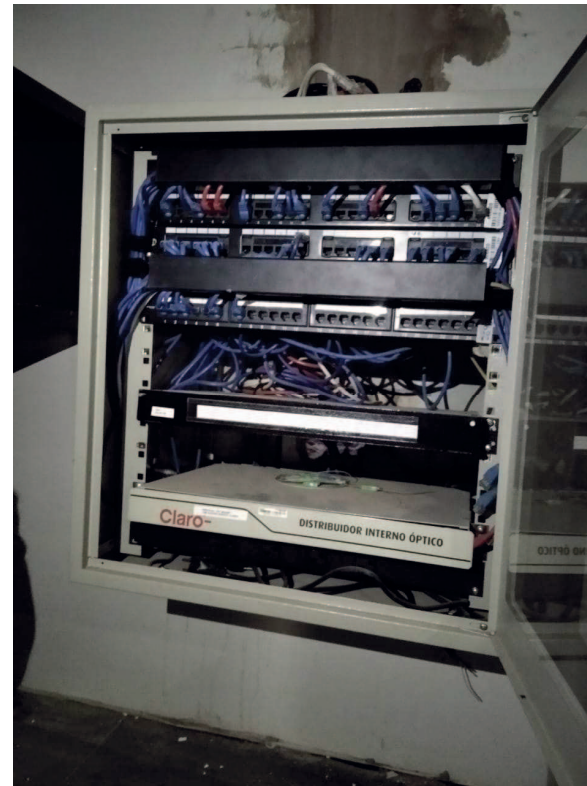
Detalhe da nova infra de lógica e a reinstalação do Rack com seus ativos