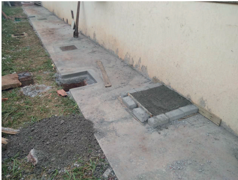
Detalhe do calçamento com a inclinação corrigida