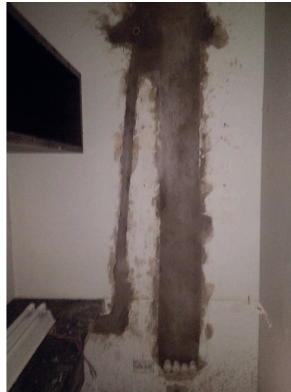
Detalhe da ampliação da infraestrutura para o novo rack.