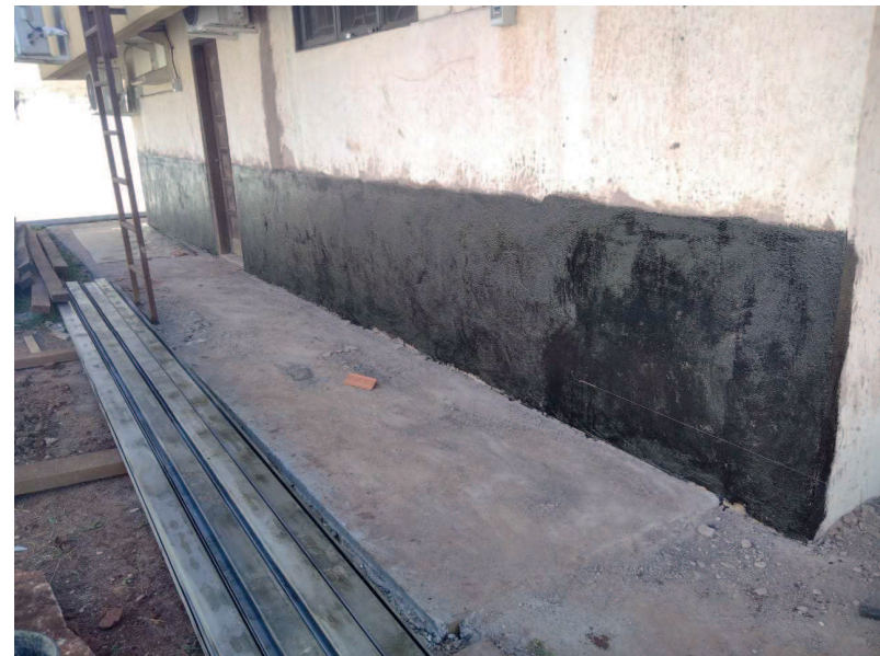
Detalhe da impermeabilização betuminosa