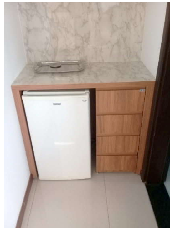
Aparador com parede de fundo com laminado de mármore instalado