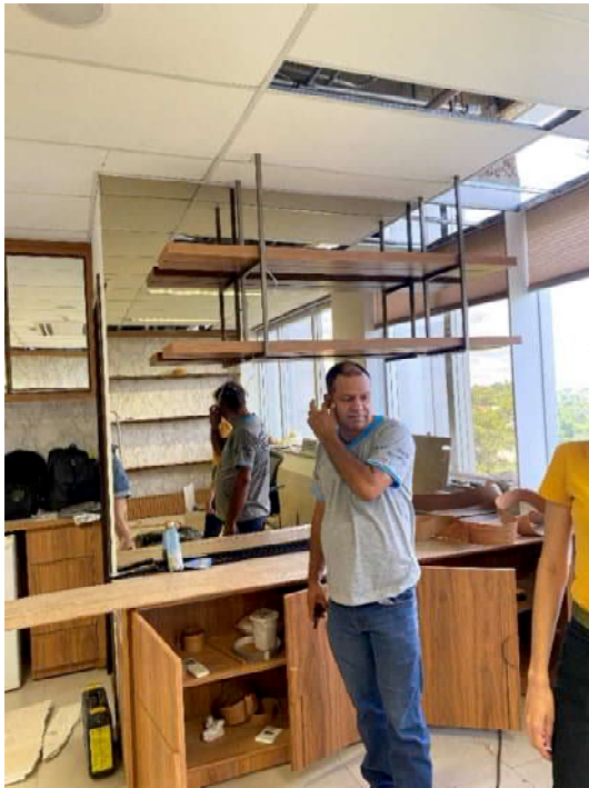
Instalação da prateleira passando pelo forro e fixada na laje de concreto do gabinete