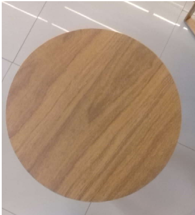
Mesa pronta – vista superior