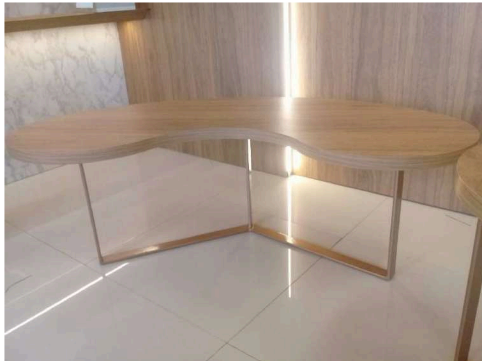
Mesa pronta – vista em perspectiva