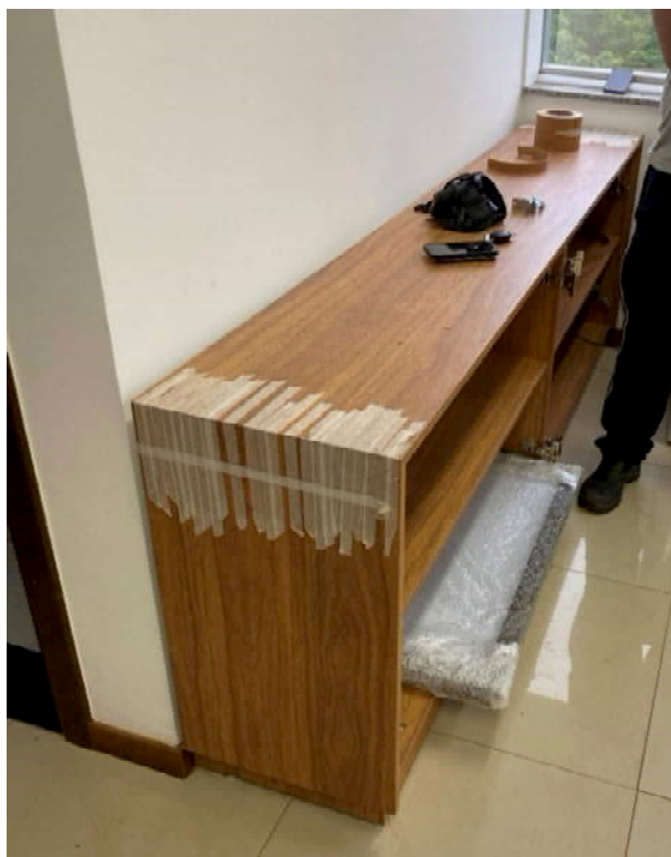
Montagem do Armário Inferior