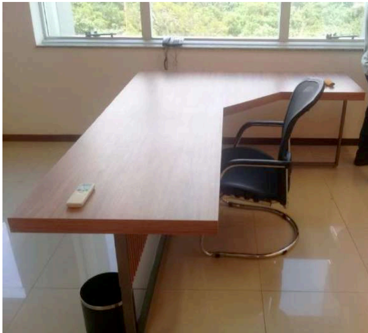
Mesa de trabalho finalizada