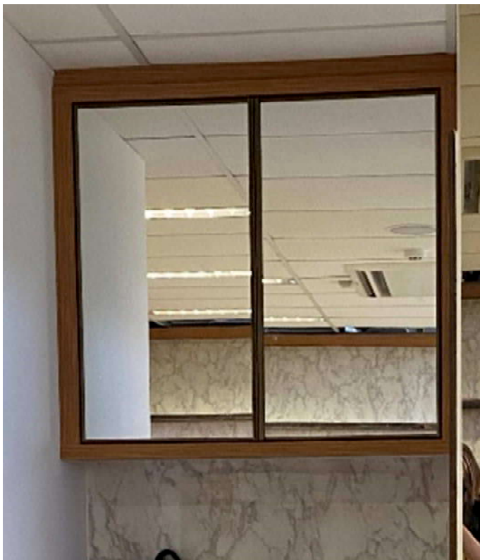
Armário já instalado na parede