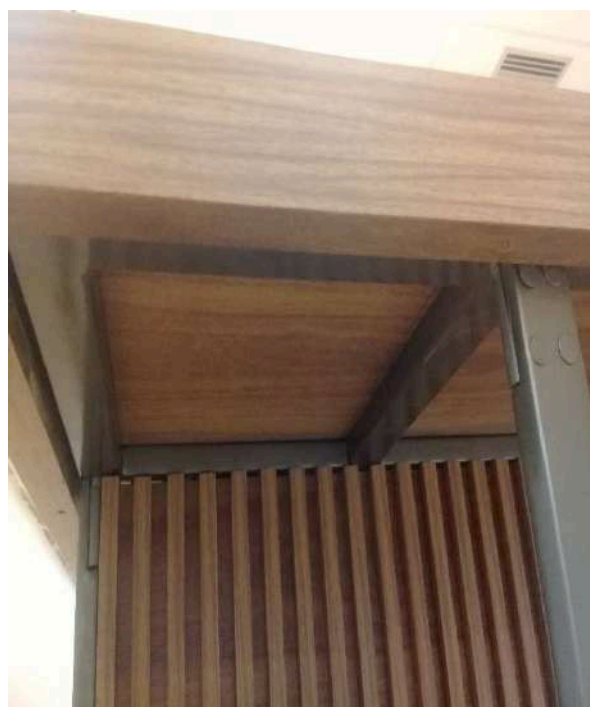
Detalhe do encaixe e parafusamento da estrutura de sustentação do tampo com as pernas da mesa