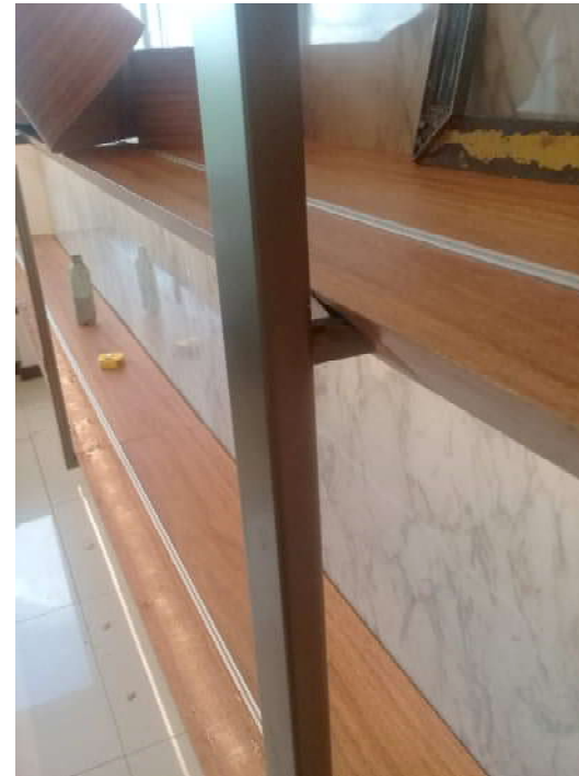
Detalhe do encaixe dos perfis metálicos frontais com os posteriores (embutidos nas prateleiras)