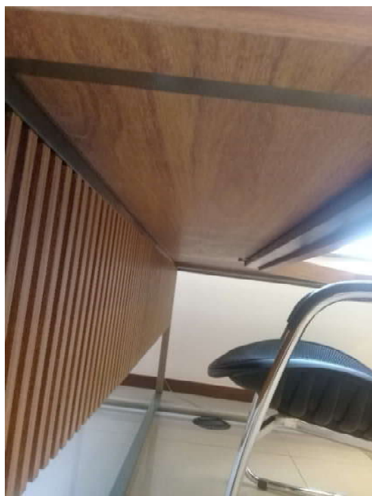
Vista de estrutura de sustentação do tampo (parafusada as pernas da mesa)