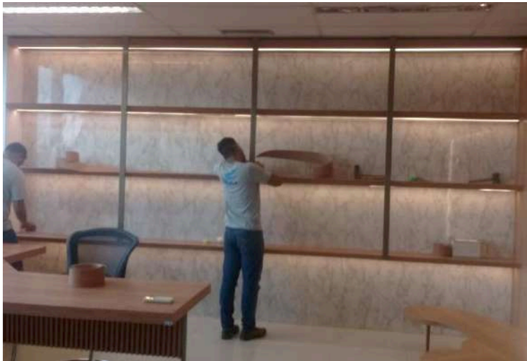
Perfis metálicos frontais instalados e fitas de LED instaladas