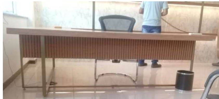
Vista frontal da mesa de trabalho