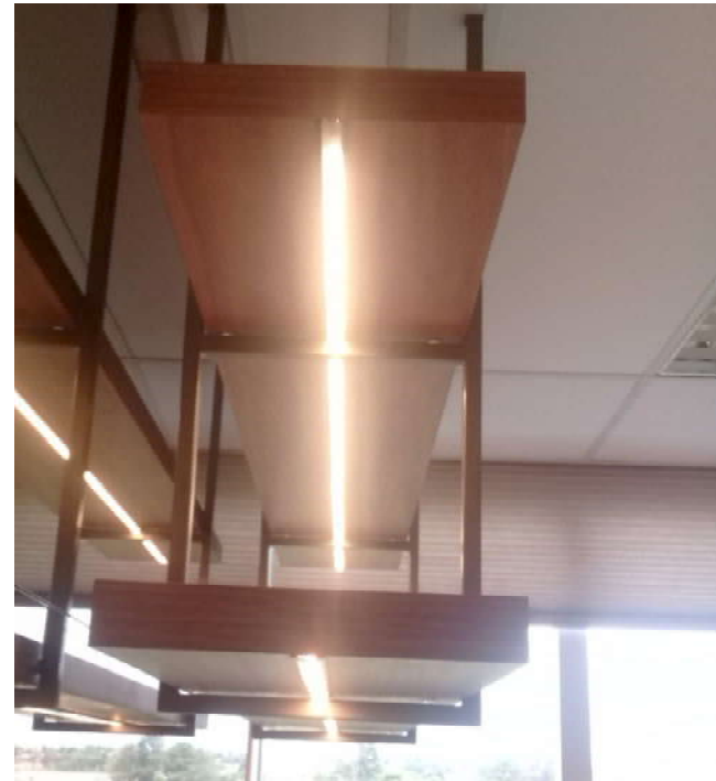
Prateleiras finalizadas com as fitas de LED