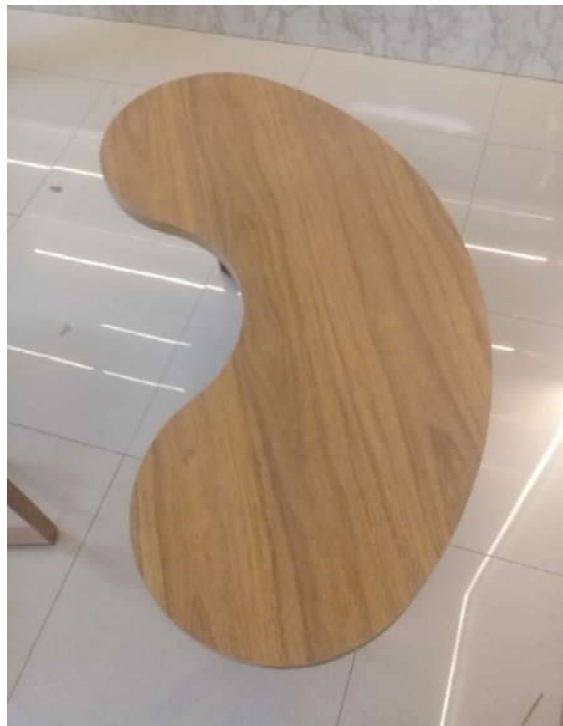
Mesa pronta – vista superior