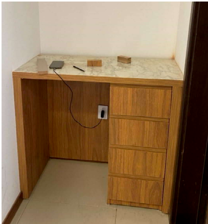
Instalação do Aparador