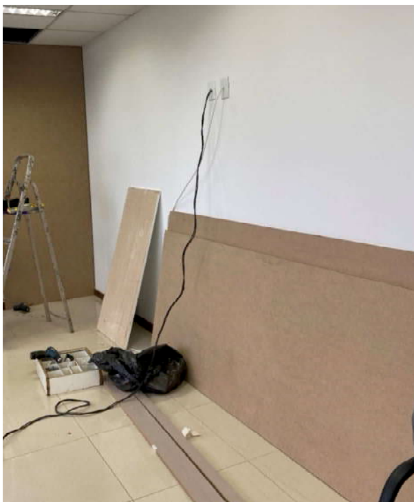
Parede sem o painel de MDF com laminado Cumaru