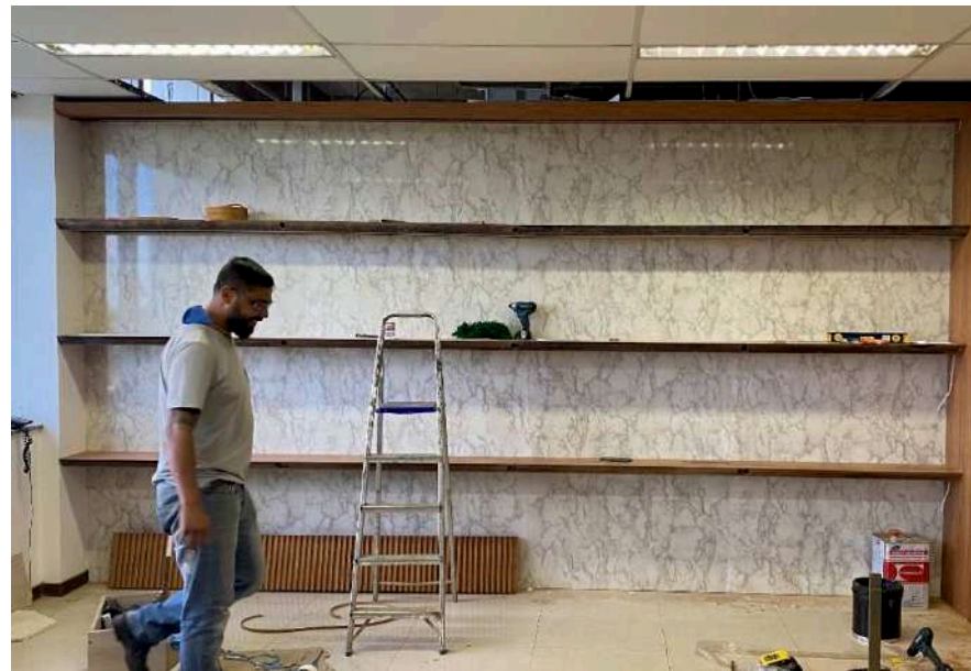
Prateleiras encaixadas e laminado em mármore aplicado na parede de fundo