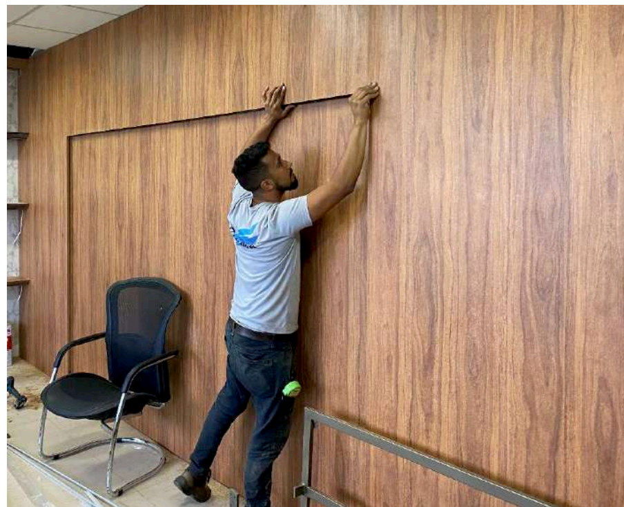
Painel de MDF com laminado Cumaru já instalado e instalação do LED em friso do painel