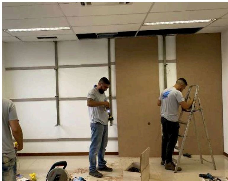
Instalação dos perfis metálicos traseiros na parede (para encaixe e fixação das prateleiras da estante)