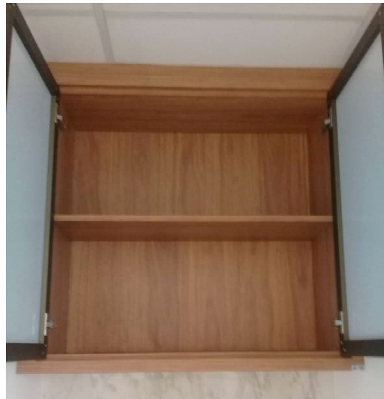
Vista interna do Armário