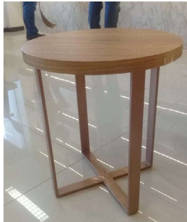
Mesa pronta – vista em perspectiva