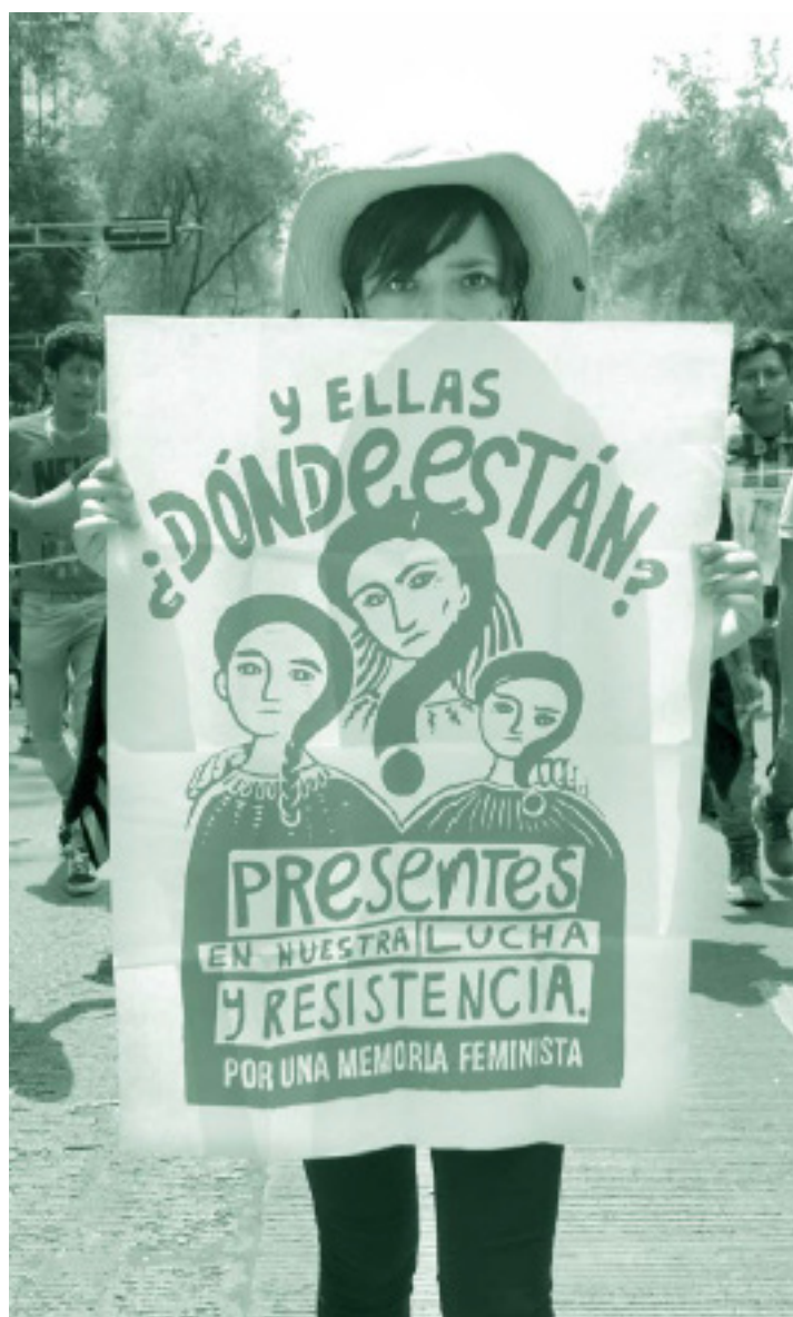
Marcha do Silêncio, CDMX. Texto traduzido: E elas, onde estão? Presentes em nossa luta e resistência. Por uma memória feminista. Data: 8 de setembro de 2019 Artista: Cerrucha www.cerrucha.com

Por sua vez, no caso J. vs. Peru , em que se analisou a omissão do Estado de abordar as alegações de tortura e violência sexual da vítima durante sua prisão pela suposta prática de atos terroristas, o Tribunal IDH, ao corroborar o contexto, determinou que os fatos estavam em um cenário de conflito armado no Peru na década de 1990. Nesse sentido, reconheceu-se que durante esses anos houve execuções extrajudiciais e desaparecimentos forçados de pessoas suspeitas de pertencer a grupos armados como o “Caminho Brilhante”, 132 em que atos de violência sexual contra a mulher, cometidos por autoridades e grupos armados, constituíram uma prática generalizada e tolerada 133 . Com base nisso, concluiu-se que era inadmissível que as autoridades estaduais tivessem descartado os sinais de tortura e violência sexual da vítima, sob a alegação de que era costume que os processados por terrorismo alegassem indevidamente ter sido vítimas de estupro sexual ou outros atos de conteúdo sexual, uma vez que buscavam apenas questionar a legalidade do processo.