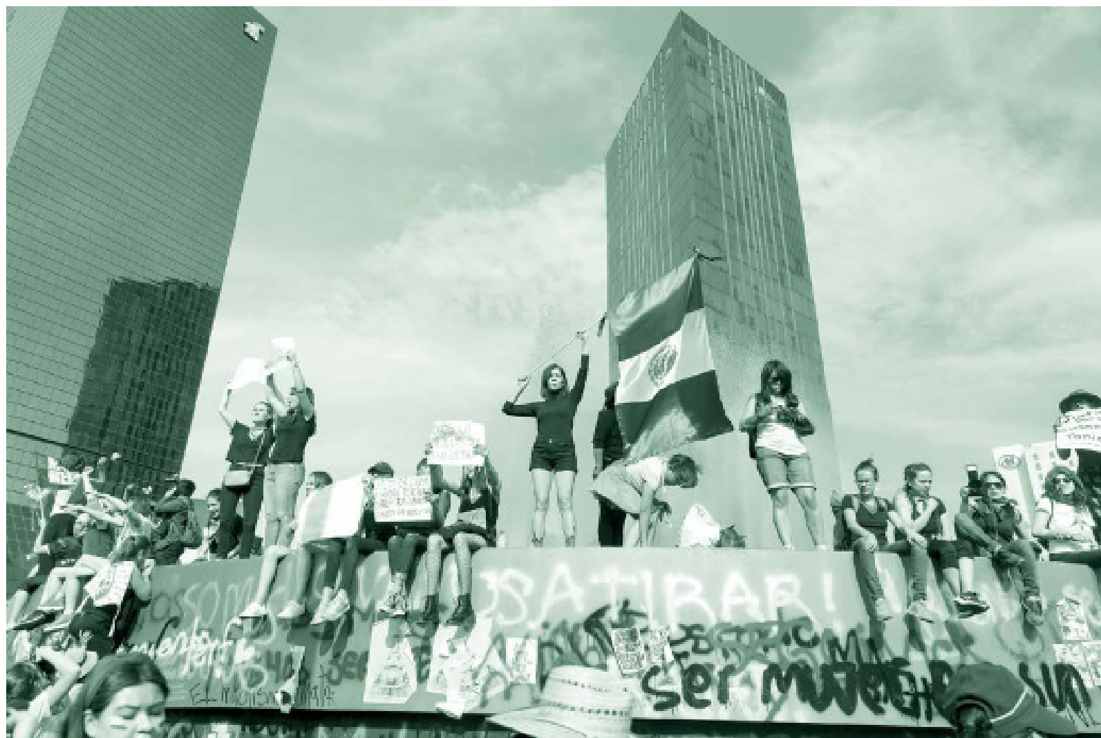
Carregando a bandeira da Revolução Mexicana #8M. Artista: Elsa Oviedo.