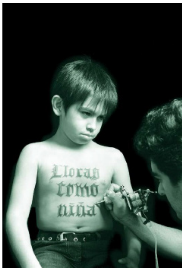
Chora como uma garota Series: In-Visible II Ano: 2012 Artista: Cerrucha www.cerrucha.com

Deve-se notar que a eliminação de estereótipos, preconceitos e práticas tradicionais nocivas baseados no gênero é uma obrigação constitucional nos termos da Convenção sobre a Eliminação de Todas as Formas de Discriminação contra as Mulheres, bem como da Convenção Interamericana de Prevenção, Punição e Erradicação da Violência contra as Mulheres. É por isso que os passos descritos são tão relevantes, porque propõem um caminho para um trabalho mais do que complexo. Uma tarefa que um de seus grandes aliados encontra no Judiciário, graças à força simbólica e restauradora que suas sentenças representam.