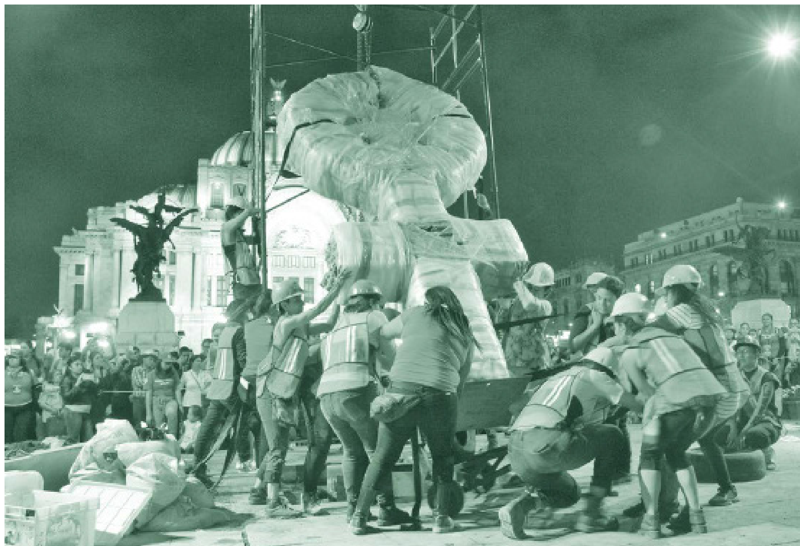
Sempre vivo, 8 de março de 2019. Bruxa de Papoula.