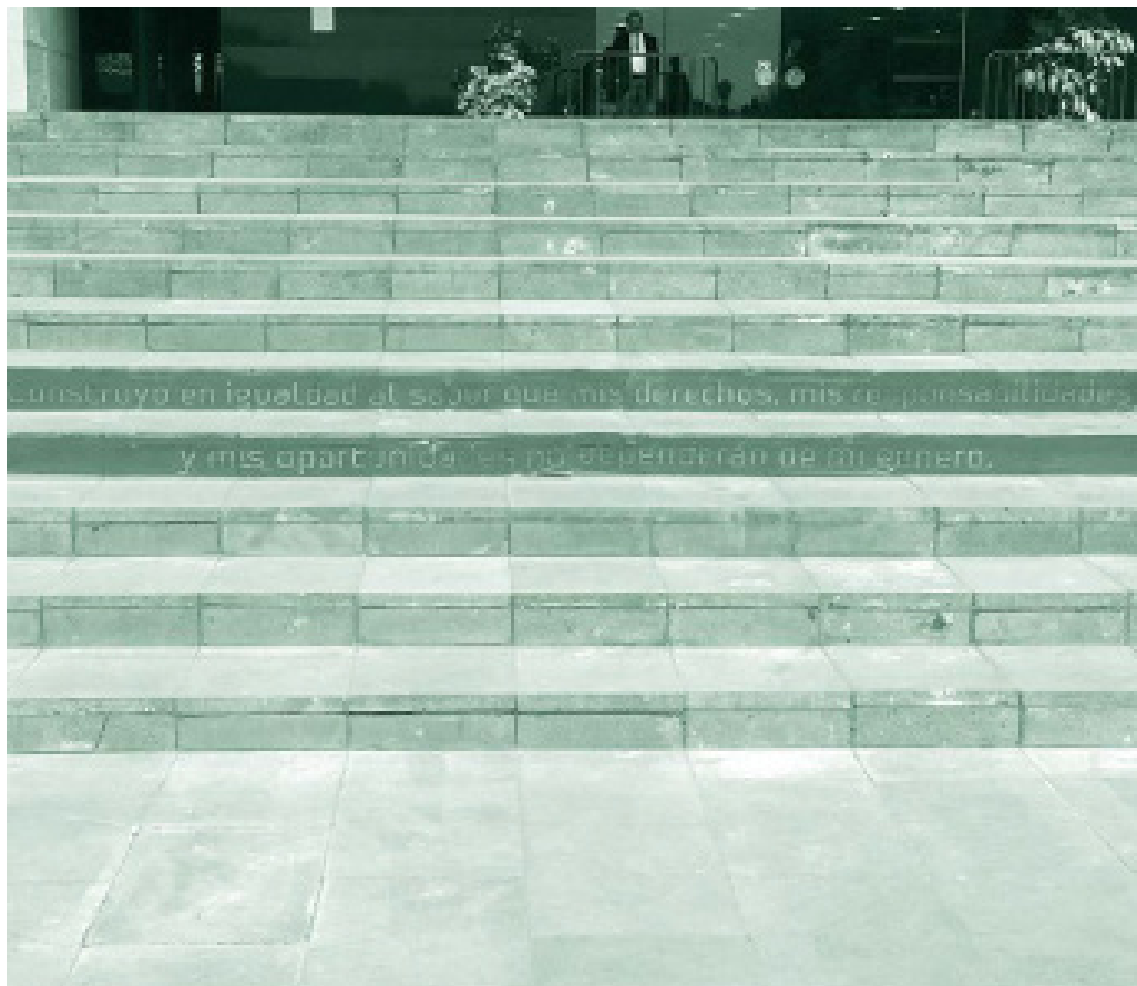
Campanha de Igualdade de Gênero encomendada pelo Congresso da União. Intervenção nas escadas do recinto. Texto: Construo a igualdade ao saber que os meus direitos, as minhas responsabilidades e as minhas oportunidades não dependerão do meu gênero. Ano: 2018 Artista: Cerrucha www.cerrucha.com