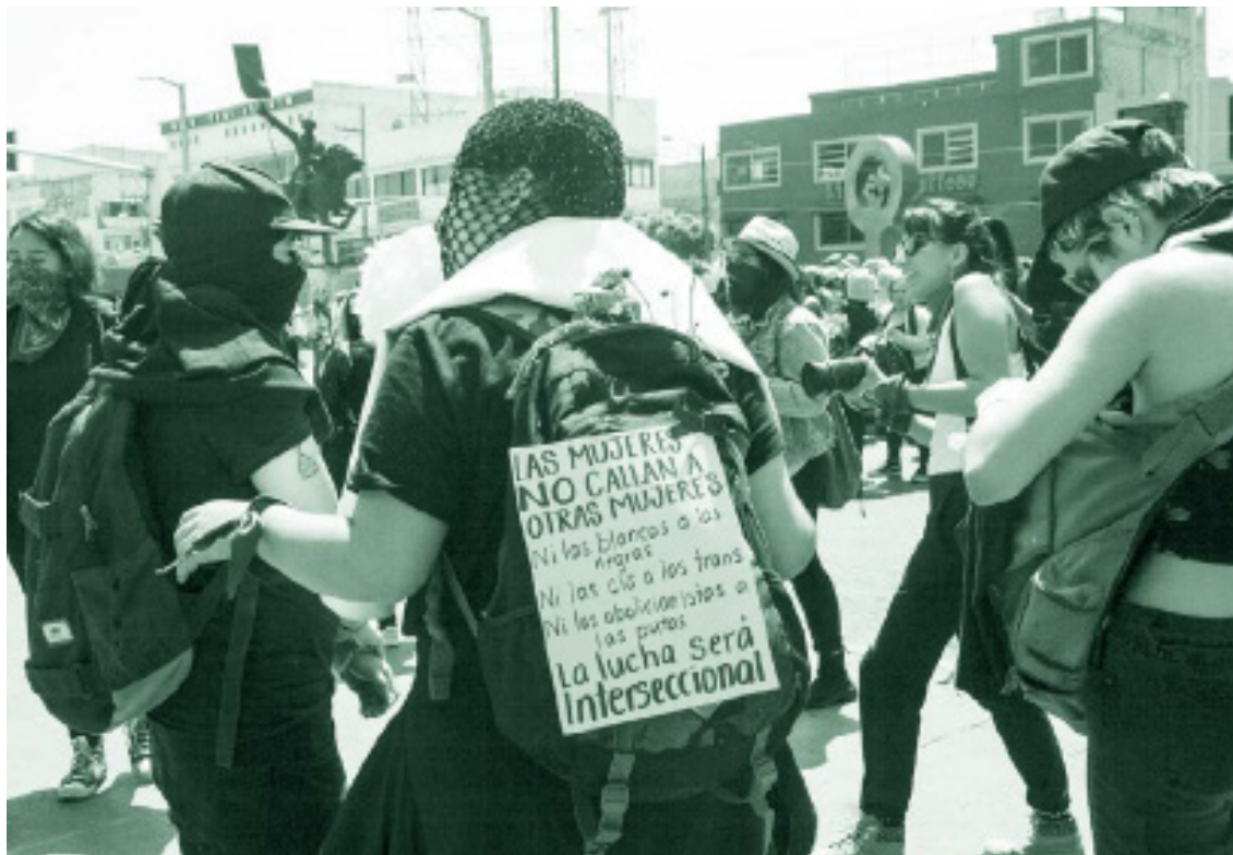
Marcha Feminista em Azcapotzalco, 8 de março de 2020. Texto traduzido: As mulheres não calam as outras mulheres, nem as brancas, nem as negras, nem as cis ou as trans, nem as abolitionistas ou putas. A luta será interseccional.

Essa abordagem "requer a consideração de que as experiências de vitimização muitas vezes fazem parte de uma cadeia de atos discriminatórios, em que um segue o outro" (WOMEN'S LINK WORLDWIDE, 2014, p. 64). Portanto, por meio do uso de uma abordagem interseccional, reconhece-se que as pessoas não experimentam discriminação no abstrato, mas em um contexto social, econômico, político e cultural particular, no qual privilégios e desigualdades são desenvolvidos e reproduzidos. (WOMEN'S LINK WORLDWIDE, 2014, pp. 51, 63)