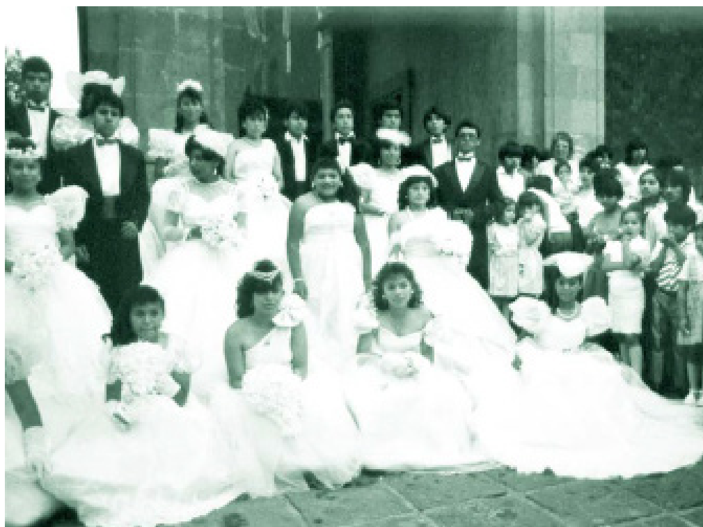
Debutantes meninas e meninos comemorando o 15º aniversário como uma reivindicação da Assembleia de Bairros, organização conhecida do Movimento Urbano Popular na Cidade do México.

Entre a multiplicidade de estereótipos que existem, os estereótipos de gênero se distinguem por serem orientados a um conjunto definido de grupos sociais: o grupo das mulheres, o de homens e os que compõem as diversas identidades de gênero ou minorias sexuais. Esse tipo de estereótipo é dedicado a descrever que tipo de atributos pessoais as mulheres, os homens (ASHMORE E DEL BOCA citados por COOK E CUSACK, 2010, p. 23) e as pessoas de diversidade sexual (traços físicos, características de personalidade, aparência, orientação sexual etc.) devem ter, que estão na forma de um estereótipo descritivo; bem como quais papéis e comportamentos são ou devem ser adotados, dependendo de seu gênero (COOK E CUSACK, 2010, p. 23), que têm o caráter de um estereótipo normativo.