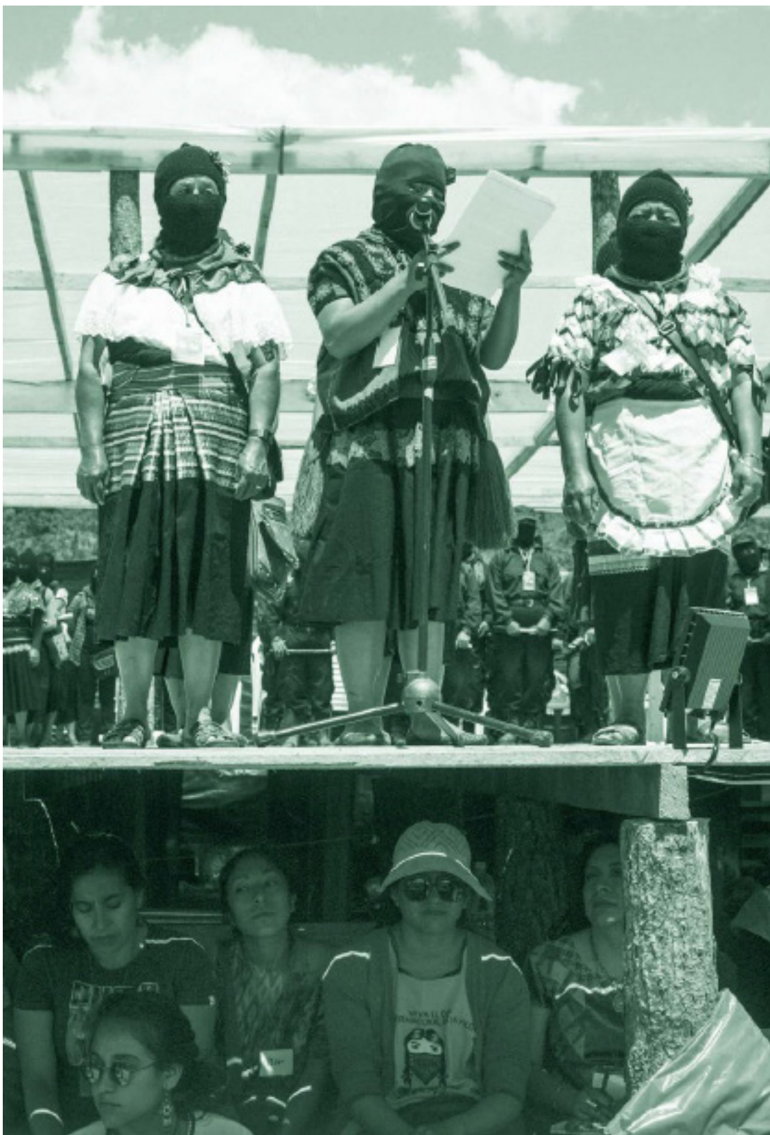
A Dignidade Rebelde, 2018. Morelia Snail, Altamirano, Chiapas.