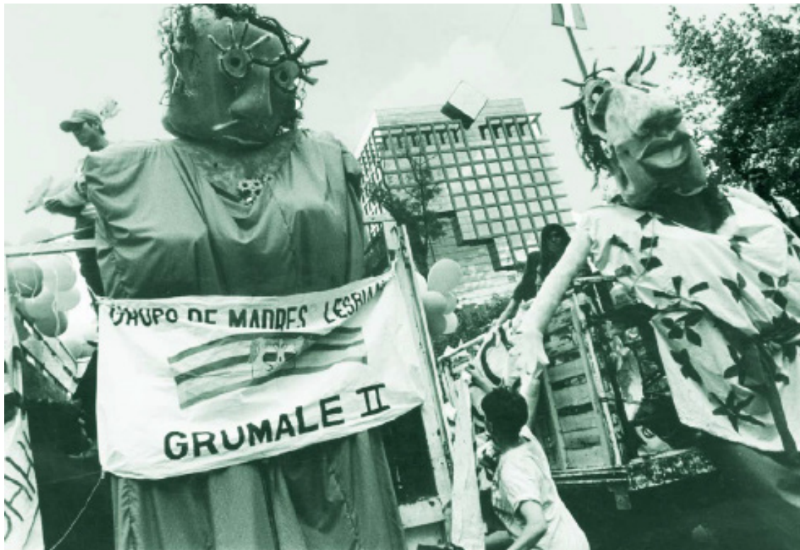
Grupo de Mães Lésbicas, Grumale II, que buscou gerar espaços de encontro e promover o desenvolvimento de uma cultura sobre maternidade lésbica. Grumale I nasceu em 1986 e Grumale II em 1995. Fonte: CAMENA/UACM, Fund I, Vol. 1, Exp. K IS36.

são óbvias, mas exigem análises mais profundas por parte das pessoas que fazem justiça. Verifica-se no Recurso de Revisão n. 852/2017 433 , resolvido pela Primeira Câmara do STJN.