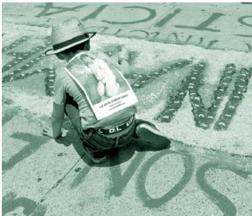
Marcha do Silêncio, CDMX. Data: 8 de setembro de 2019. Artista: Cerrucha www.cerrucha.com

invisibilizada e normalizada, especialmente nas esferas das relações familiares e conjugais, laborais e acadêmicas, e em espaços públicos. É uma forma de agressão que se tornou parte do cotidiano, apesar dos esforços para preveni-la e erradicá-la.