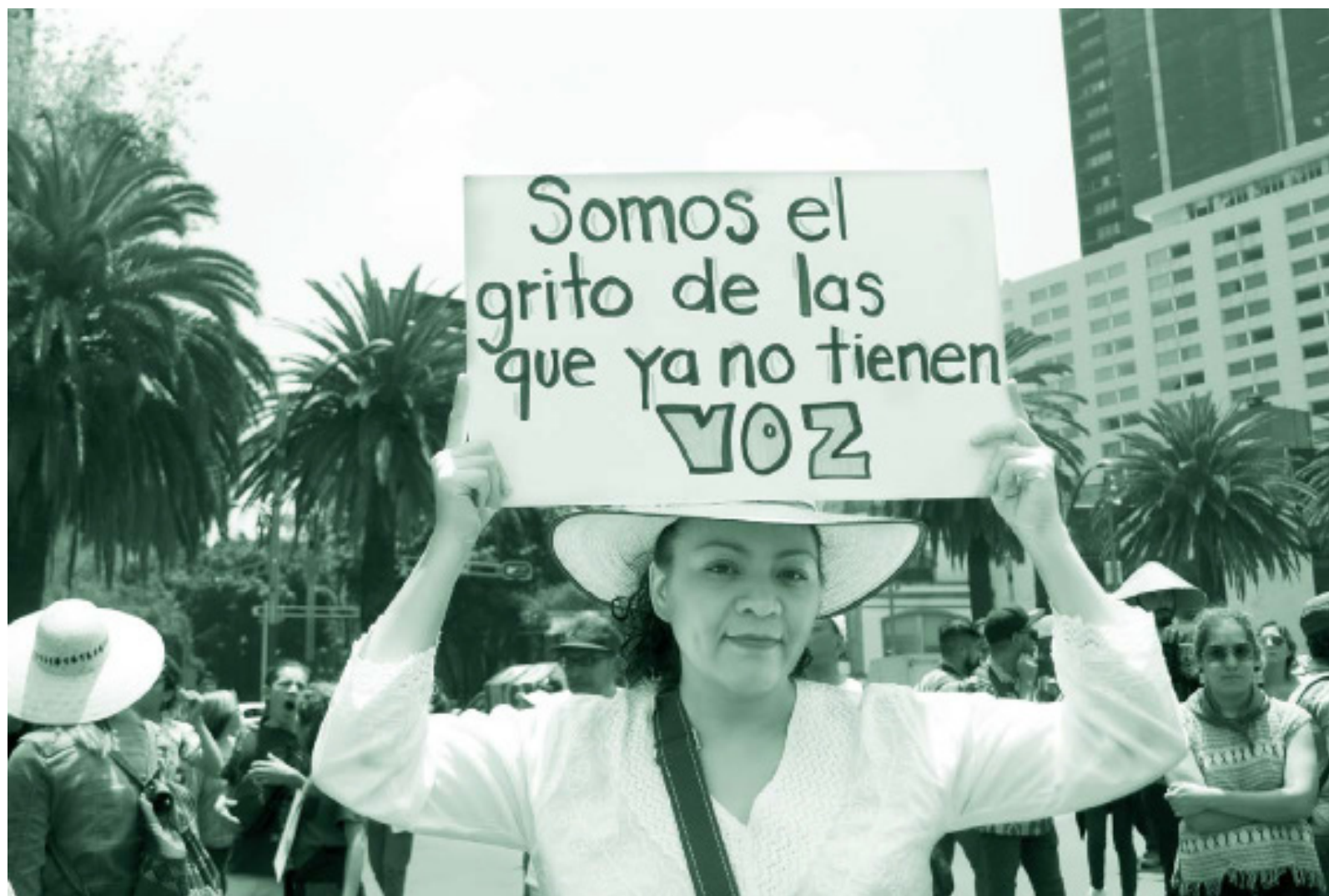
| Marcha do Silencio, CDMX. Data: 8 de Septiembre, 2019. | Tradução do texto: Somos o grito das que já não têm voz | Artista: Cerrucha, www.cerrucha.com