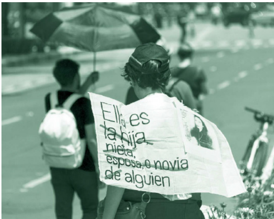
Texto (traduzido): Ela é a filha, neta, esposa ou namorada de alguém Marcha do Silêncio, CDMX. Data: 8 de setembro de 2019. Artista: Cerrucha, www.cerrucha.com

A análise de contexto também está relacionada aos deveres constitucionais para prevenir, investigar e remediar violações de direitos humanos. No que diz respeito ao dever de prevenção, estudar o contexto permite que as autoridades tenham maior capacidade de evitar a ocorrência futura de eventos vitimizadores decorrentes de um ambiente sistemático de violência ou desigualdade (FLACSO, 2017, p. 27). Por sua vez, o dever de investigar é estendido com essa ferramenta, na medida em que a autoridade é obrigada a considerar os fatos de um caso específico com base em um quadro mais amplo, que pode até demonstrar um padrão de comportamento (FLACSO, 2017, pp. 27-28). Por fim, o dever de reparar é complementado permitindo que os reparos determinados em um caso concreto levem em conta o ambiente em que a vítima é desenvolvida, bem como suas condições individuais (FLACSO, 2017, pp. 27-28).