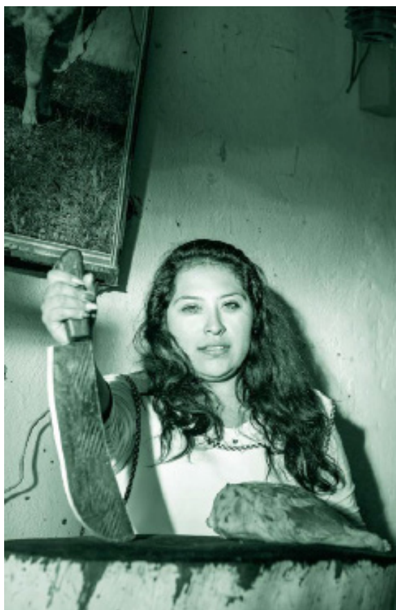
Comissão da ONU Mulheres França Empreendedora participante do programa “Avançamos pela Igualdade” da ONU Mulheres, com o objetivo de tornar visíveis as diferentes áreas de trabalho em que as mulheres desenvolvem, Xochimilco, CDMX. Ano: 2019 Artista: Cerrucha www.cerrucha.com